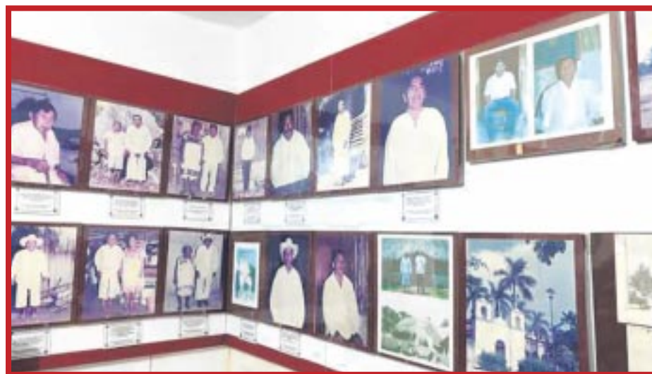
La Asociación de Cronistas de Quintana Roo, resalta la importancia del Apóstol de la raza.

Resaltó que entre las acciones del defensor del Mayab están el declarar de interés público la industria del henequén, el reparto de tierras y la socialización de la producción de ejidos, así como establecer el salario mínimo en Mérida, promulgar las leyes de previsión social y del trabajo, y el divorcio y la creación de cooperativas de producción y consumo.