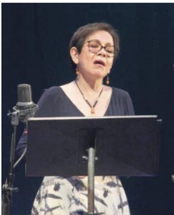
“Canciones de invierno” fue el primer nombre del disco, pues fueron temas hechos en esa estación del año 2022, no obstante, después cambió.

en plataformas y en formato Digi Cards que son unas tarjetas con un código QR, donde podrás escuchar y descargar las canciones y portada del disco.