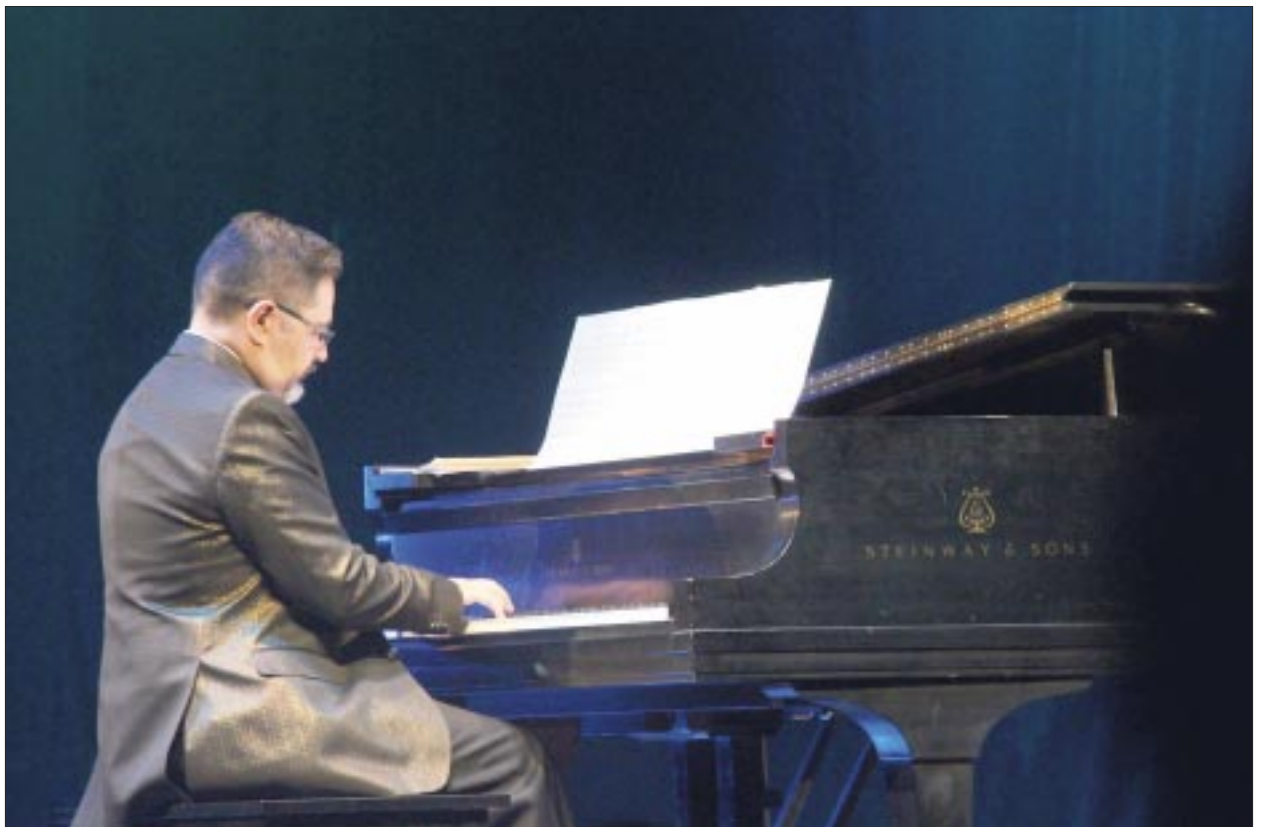
Entre otros temas, el disco incluye “Eres como una ola” y “Arrullo de invierno”.