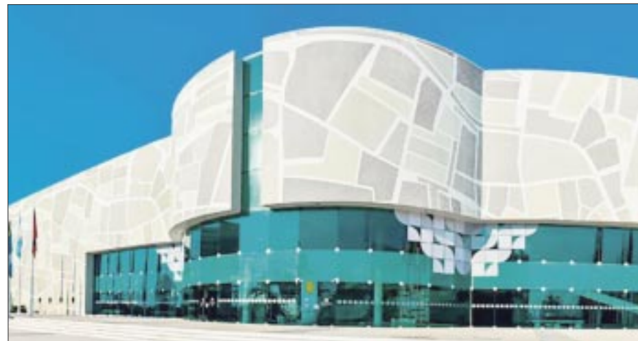
Aquí será el Tianguis Nacional de Pueblos Mágicos.

Ruta 2: explora “El Templo de los Imprevistos Financieros” y descubre la importancia de contar con crédito, seguros y fondo de emergencia como medidas preventi-