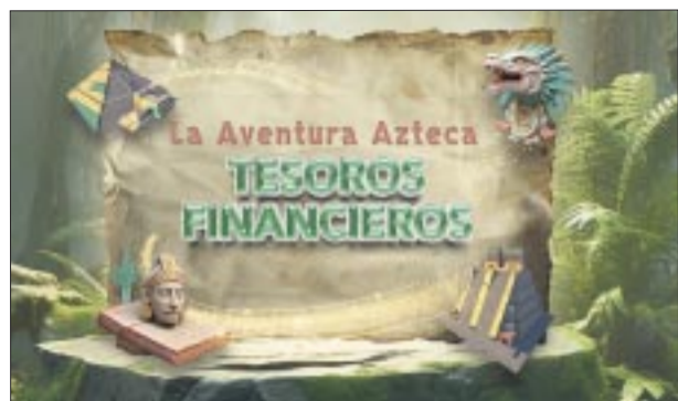
Descubre las finanzas.

victoriagprado@gmail.com X: @victoriagprado