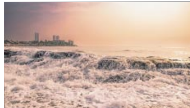
Boca del Río, lugar donde está el World Trade Center Veracruz.

El programa de educación financiera de Banco Azteca impartirá 22 webinars a 16 universidades, se abordarán temas como ahorro, uso del crédito, cómo hacer un presupuesto, el abc de las inver-