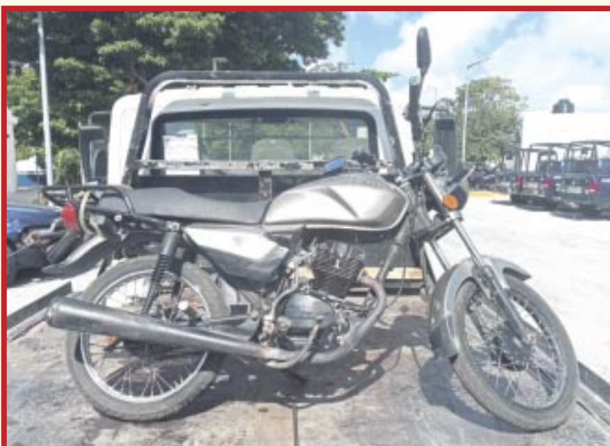
La SSC realizó un operativo de verificación de documentos de motocicletas, como tarjeta de circulación, licencia de conducir y placas entre motociclistas de Chetumal.

Chetumal.- Elementos de la Dirección de Tránsito de la Secretaría de Seguridad Ciudadana del Estado de Quintana Roo (SSC) dieron a conocer los resultados del operativo de verificación de documentos, como tarjeta de circulación, licencia de conducir y placas entre motociclistas de Chetumal, el cual tuvo efecto sobre la avenida Centenario.