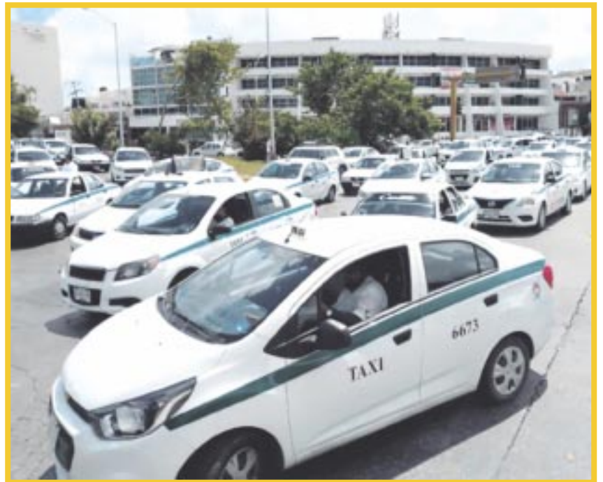
Taxistas del sindicato “Andrés Quintana Roo”, se sumarán a los transportistas federales para realizar una manifestación, hoy viernes 30 de agosto.