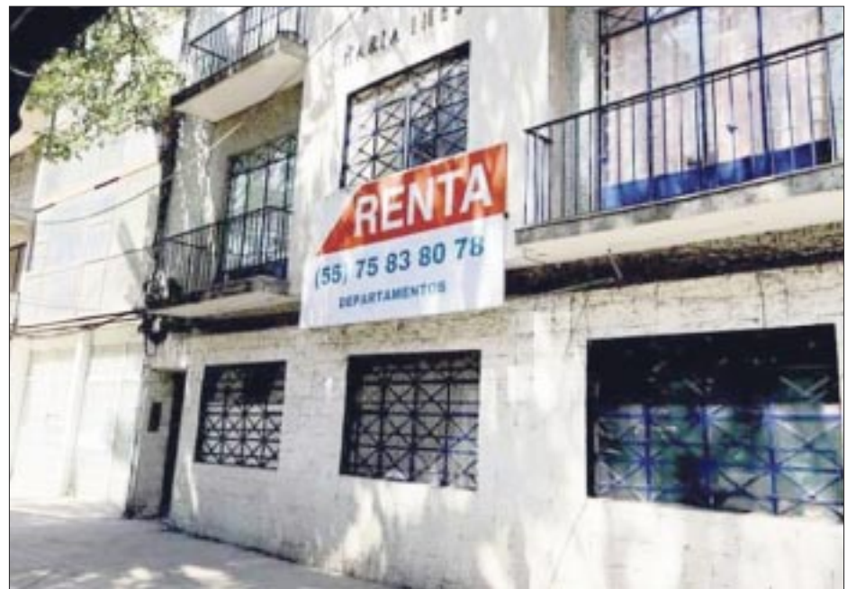
El Clúster de Innovación y Transformación Inmobiliaria advirtió que la iniciativa aprobada en el Congreso de la CDMX sobre tope a rentas de inmuebles es autoritaria.

sidera que aunque la reforma es “noble” para contrastar y compensar la diferencia entre las alzas de la renta y el costo real de las familias mexicanas, la propuesta “no es clara” y genera interrogantes.