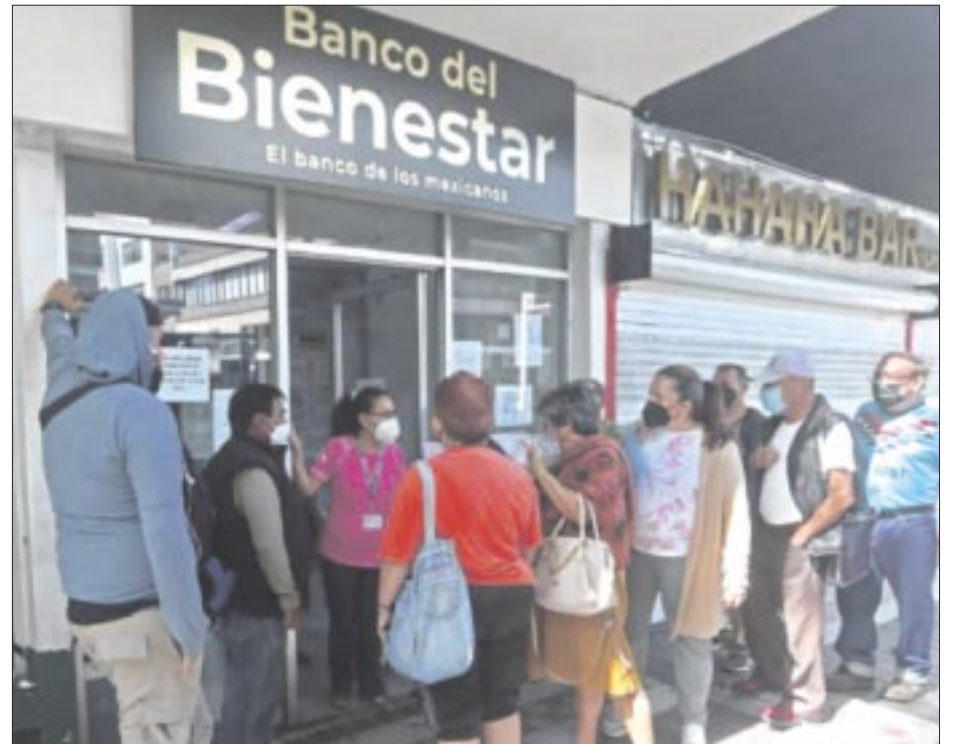
Este miércoles 3 de enero inicia el pago de las pensiones del Bienestar, anunció este martes la secretaria Ariadna Montiel.

Además, se hizo mención del incremento del salario mínimo, el cual se establecerá