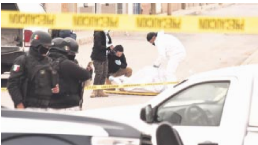
En 2023 se reportaron 26 mil 301 víctimas de homicidio doloso, lo que representa que en promedio cada mes fueron privadas de la vida 2 mil 192 personas.

Desde el día de los hechos, unidades de la Guardia Nacional, elementos estatales y personal militar de la Sedena trabajan de forma coordinada realizando recorridos de seguridad y vigilancia sobre varios tramos carreteros y en la Autopista Matamoros-Reynosa. “Para seguir en esta búsqueda y dar con las personas que fueron privadas de su libertad”, dijo Cuéllar Montoya. Medios han informado de una serie de plagios masivos contra migrantes en la frontera de Tamaulipas, por lo que sacerdotes, pastores y activistas que defienden a los extranjeros alertando por un agravamiento de los secuestros.