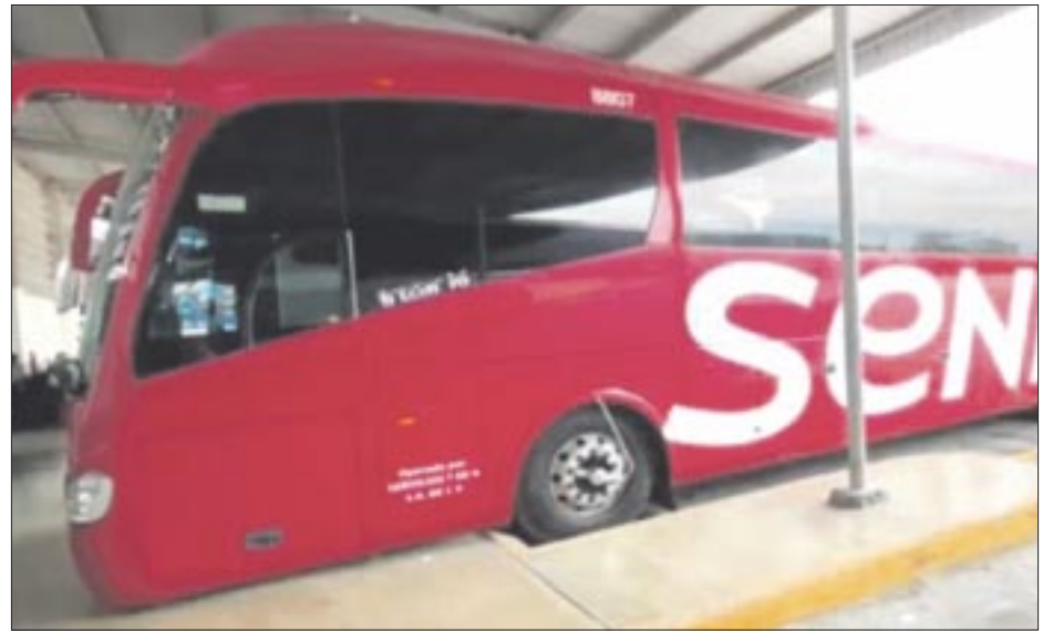
Criminales interceptaron un autobús en Reynosa, Tamaulipas, y plagiaron a 31 migrantes extranjeros.

El consultor y analista político David Saucedo afirma que de acuerdo con estas cifras preliminares no hubo éxito en el combate a la inseguridad, más bien se observa una contención de los homicidios.