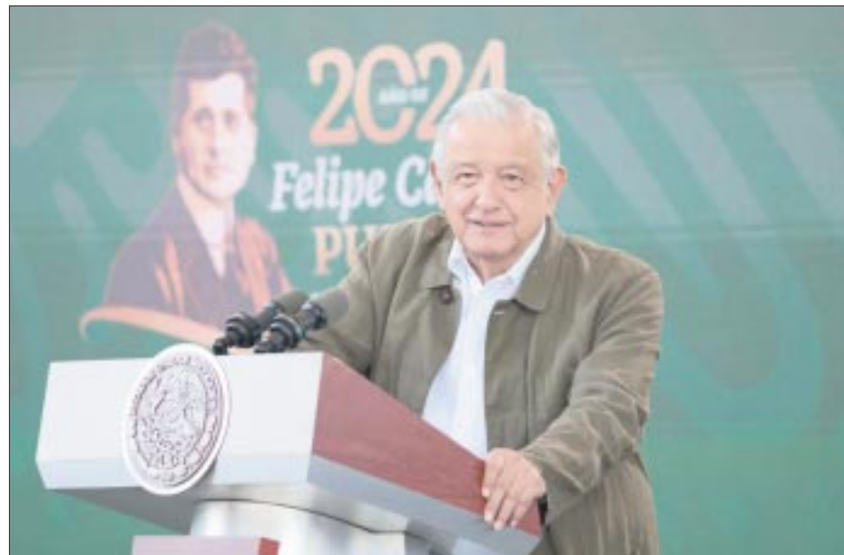
Andrés Manuel López Obrador reclamó durante su mañanera en Acapulco, Guerrero, que algunas comunidades protejan a grupos criminales a cambio de ‘migajas’ como juguetes en Día de Reyes y despensas.

A nivel global, señala la OIT en el informe, tanto la desocupación como la brecha laboral, la cual abarca la necesidad más amplia de empleo del mercado, tuvieron un comportamiento positivo en 2023 y ya regresaron a los niveles previos a los registrados antes de la emergencia sanitaria por la Covid-19.