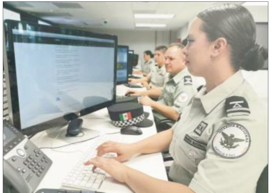
De 2019 a septiembre del año pasado, las quejas cibernéticas que documenta la Guardia Nacional aumentaron en 186%.

cales han visto la necesidad de crear áreas cibernéticas. En algunos casos, las fiscalías tienen un sitio para revisar estos delitos, pero no hay una estrategia que las coordine como en Estados Unidos, Reino Unido y Colombia, entre otros países.