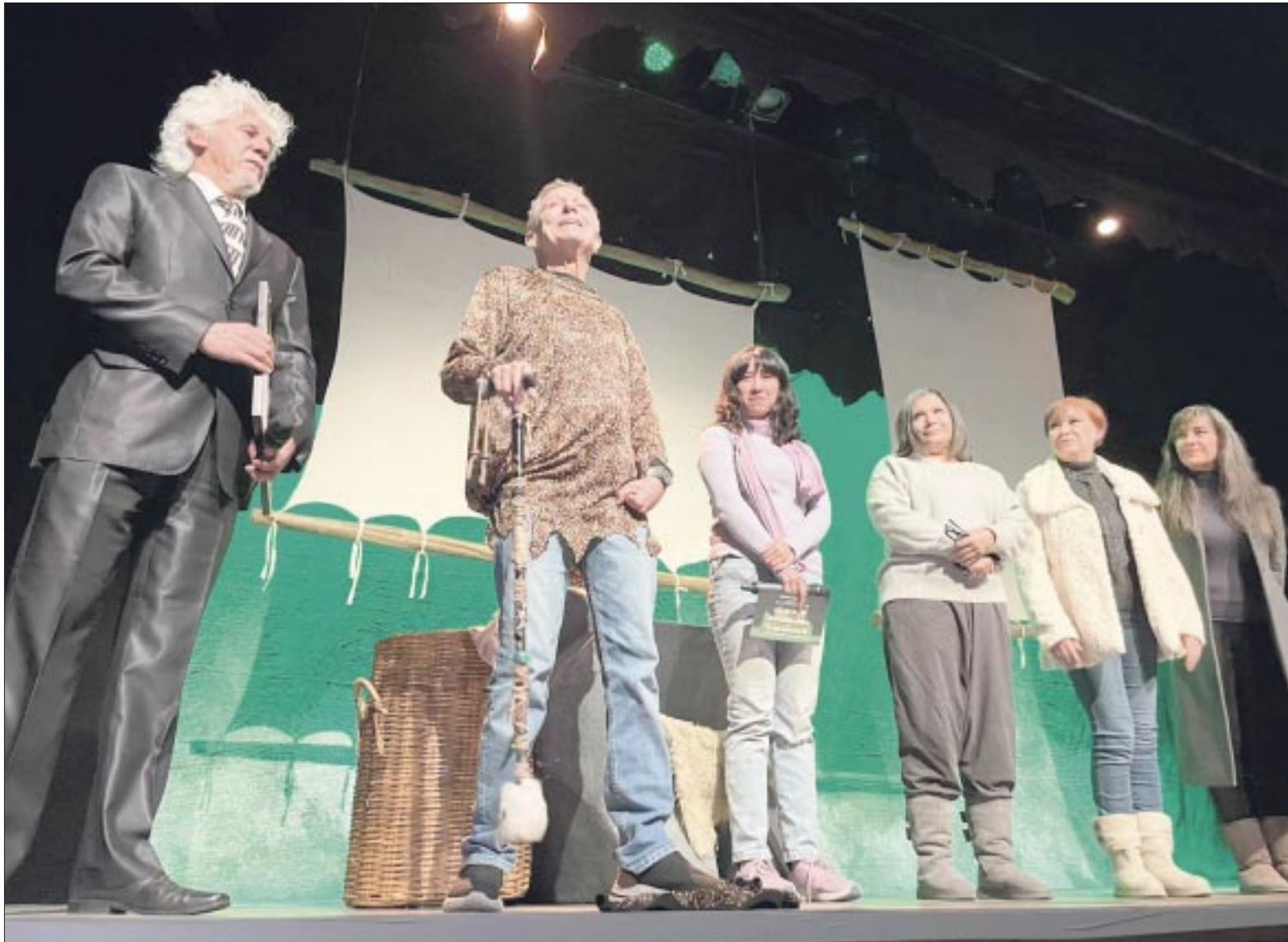
Bono recibe la medalla Eduardo Arozamena, que le entrega la ANDA, por sus 50 años de brillantísima trayectoria.

¡Salve César! ¡Salve el gran César Bono!