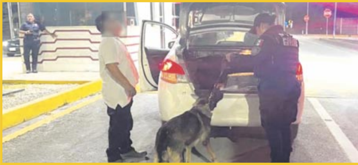
La Unidad Canina K9, de la Secretaría de Seguridad Ciudadana realiza acciones coordinadas con las autoridades de los tres órdenes de gobierno.

Actualmente se mantiene el despliegue estratégico en las distintas estaciones de autobuses, así como en las terminales portuarias en las entradas y salidas de ferry, con el objetivo de evitar actividades ilícitas que pongan en riesgo la integridad de las personas.