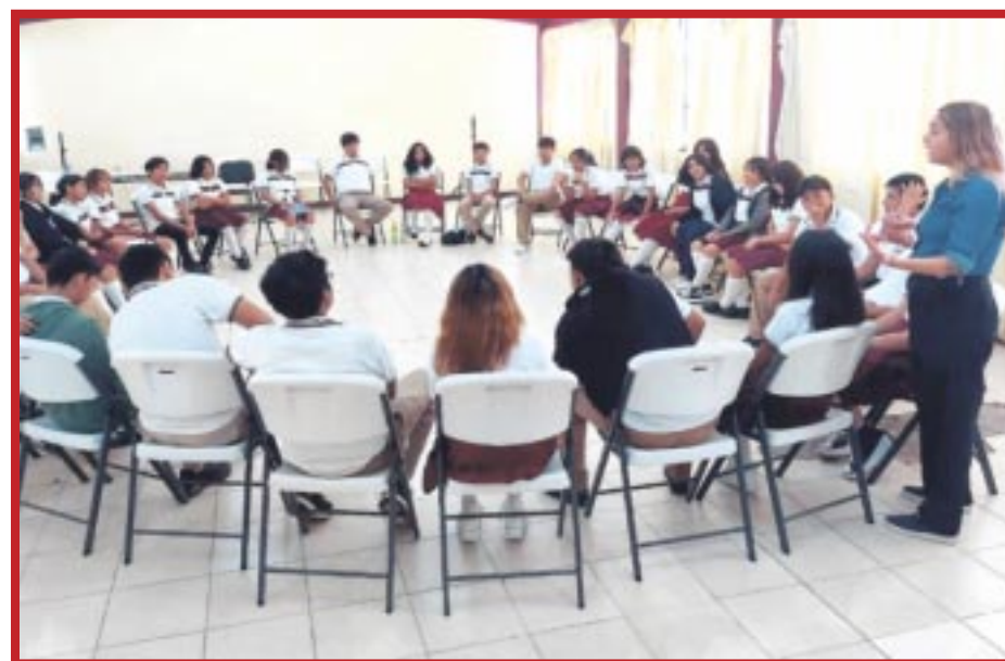
El IQM llevó a cabo acciones para prevenir y atender la violencia de género desde el enfoque de las masculinidades igualitarias.

Los talleres de prevención con juvenudes duran 16 horas y a través de dinámicas, se facilita la apropiación de formas respetuosas de relacionarse.