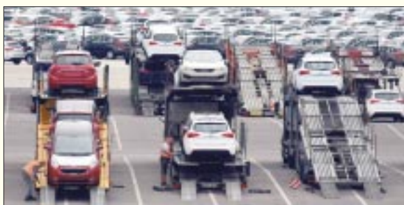
El año pasado, México exportó más de 3 millones de automóviles, un nivel no visto desde el año 2011.

El integrante del Consejo de Datos y Tecnologías Emergentes explica que el robo de contraseñas ocurre por un mal manejo por parte de las personas: “Somos muy descuidados a la hora de administrar nuestros passwords [contraseñas], es un tema del usuario”.