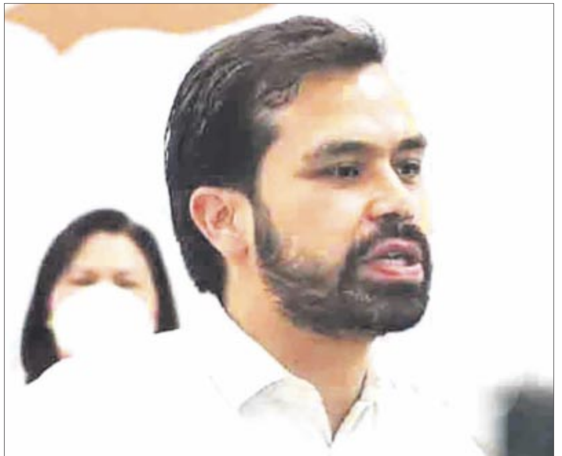
Jorge Álvarez Máynez es la “nueva” joya de MC.