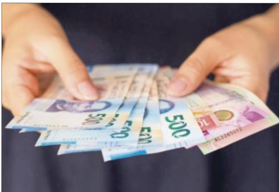
Los ajustes al salario mínimo en México han reducido el número de trabajadores en precariedad laboral en los últimos años.

Interrogado sobre la crisis de violencia que se vive en territorio ecuatoriano, el mandatario mexicano confió en que la situación sea transitoria y pronto se restablezca la paz.