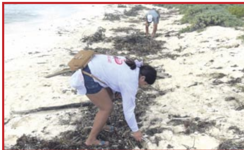
FPMC llevó a cabo la primera limpieza de playas del año en el Parque Ecoturístico Punta Sur.