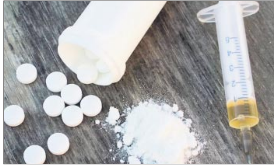
El 50 por ciento de las dosis de cocaína vendidas en “raves” son mezcladas con fentanilo, de acuerdo a un estudio del Comité de Ética del Instituto Nacional de Psiquiatría Ramón de la Fuente Muñiz.

A través del programa de Análisis de Sustancias del Colectivo ‘ReverdeSer’ se realizaron las pruebas siguiendo