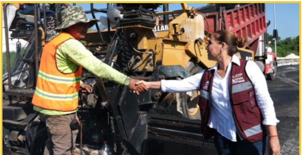
La gobernadora Mara Lezama Espinosa anunció la pronta apertura de la prolongación de la Av. Maxuxac, una obra largamente solicitada.

Además, resaltó la importancia de combatir la corrupción y gestionar correctamente los recursos públicos. La gobernadora informó que la vialidad contará con toda la señalética vial necesaria para su correcto funcionamiento.