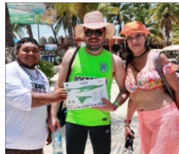
El municipio de Isla Mujeres invita a paseantes a disfrutar de sus playas limpias, ordenadas y seguras con el distintivo Blue Flag, que las certifica como lugares de excelencia turística.