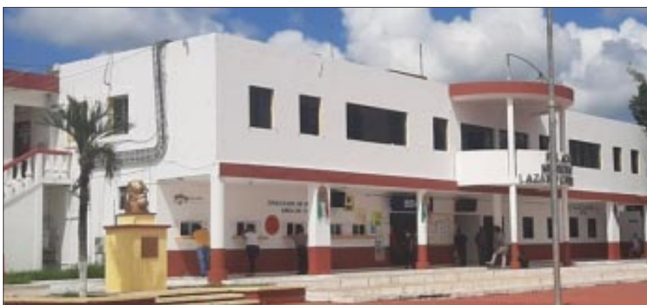
En el municipio de Lázaro Cárdenas, con el pago en una sola emisión, se aplican descuentos del 50% hasta el 10% en este mes de enero.