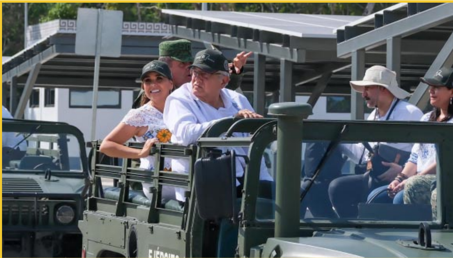
Mara Lezama Espinosa acompañó al presidente Andrés Manuel López Obrador en una visita de supervisión a los tramos 5, 6 y 7 del Tren Maya.