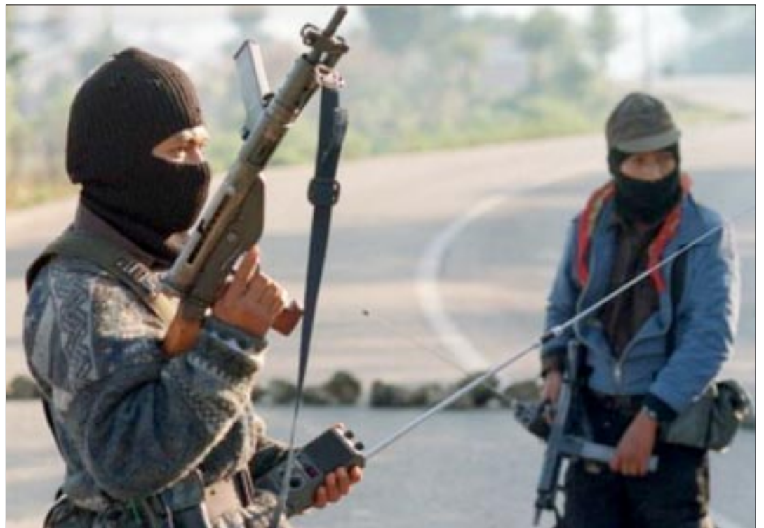
Los cárteles desplazaron a los integrantes del EZLN en las zonas que mantuvieron bajo control por más de 25 años.

ramonzurita44@gmail.com ramonzurita44@hotmail.com