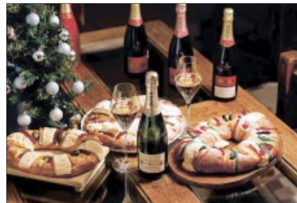
Acompaña los tamales con vinos mexicanos.

Para los tamales de frijol con queso y hoja santa, Copernicus , el multipremiado blend de Cabernet Sauvignon con Merlot . Los aromas de frutos negros y rojos en conjunto con los dejos herbales y especiados del vino lo acompañan muy bien.