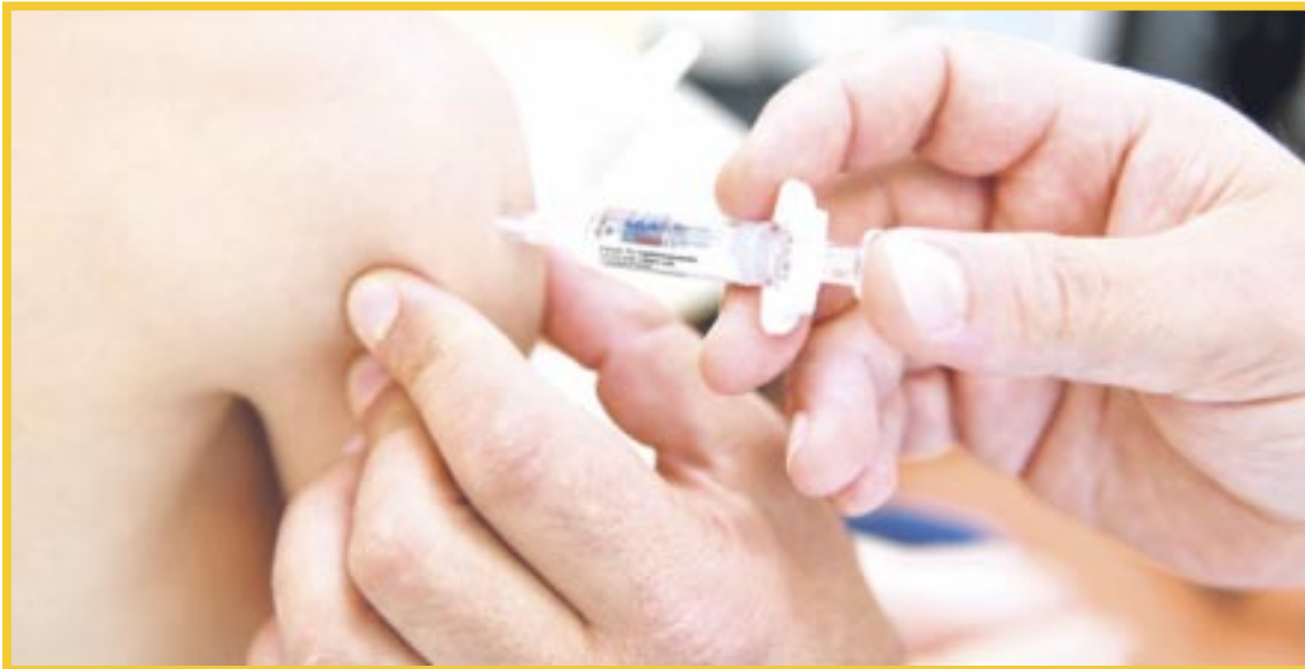
La vacuna triple viral o SRP protege a niñas y niños contra el sarampión, rubéola y parotiditis.

El secretario de Salud estatal, Flavio Carlos Rosado, explicó que la primera dosis de la vacuna triple viral les corresponde a las niñas y niños con 1 año de edad, mientras que la segunda dosis es para los que tienen 1 año y 6 meses de edad, y para los que cumplan 6 años en este 2024.