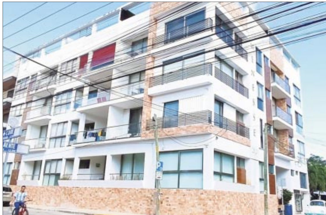
La Mesa de Seguridad Patrimonial en Q. Roo identifica desarrollos en venta que no cuentan con los registros necesarios para su comercialización.

Destacó que el objetivo es que no se desarrollen proyectos irregulares e invasiones, asimismo evitar enfrentamientos, ya que muchos de los terrenos en cuestión son ejidales