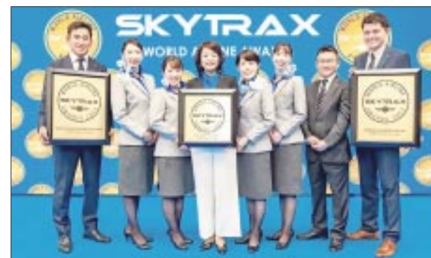
Premio por 11 años consecutivos para la aerolínea.

ofertas de servicio para garantizar una experiencia de viaje aéreo más segura y cómoda.