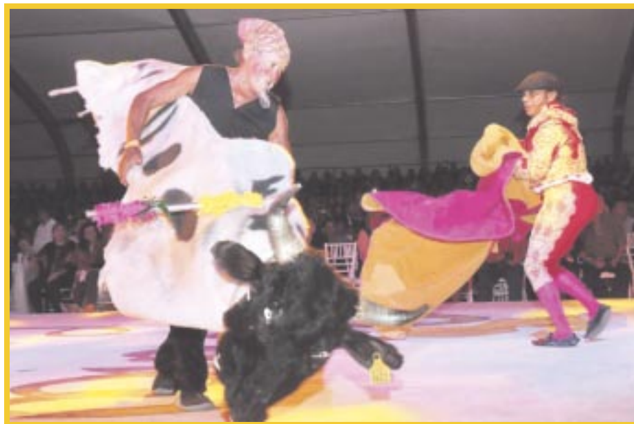
Lanzan la convocatoria para el “Concurso de Torito Wacax Ché”.

En cuanto a los que utilizarán música en su presentación ésta tendrá que estar descargada en forma legal y autorizada para su uso, asimismo, tendrá que ser entregada en una USB