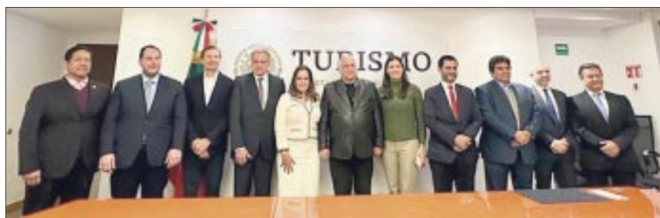
El Tianguis Turístico 2025 será en Tijuana, Baja California.

victoriagprado@gmail.com X: @victoriagprado