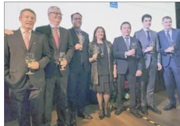
Durante la reunión en la BMV.

La compañía recibió grandes elogios por su alto nivel de servicio continuo proporcionado por su personal en todos los aspectos del viaje. El premio también reconoció los esfuerzos continuos para mejorar sus productos y