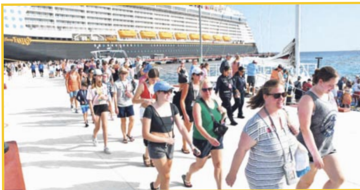
En los primeros 15 días del año , se han recibido un total de 106 barcos flotantes, siendo 75 en Cozumel y 31 en Mahahual.

Cabe recordar que el año pasado, Quintana Roo recibió más de 5 millones de cruceristas en alrededor de mil 500 barcos, tanto en los muelles de Cozumel como en Mahahual, ubicados en el norte y sur del estado.