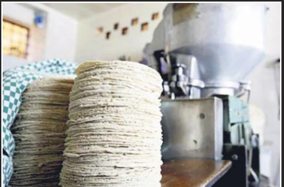
En la ciudad de Cancún se descartó un posible aumento al precio del kilo de tortilla.

Concluyó que también se debe pagar la anuencia de Protección Civil y Desarrollo Urbano, y costear la renta de los locales por el aumento de la plusvalía.