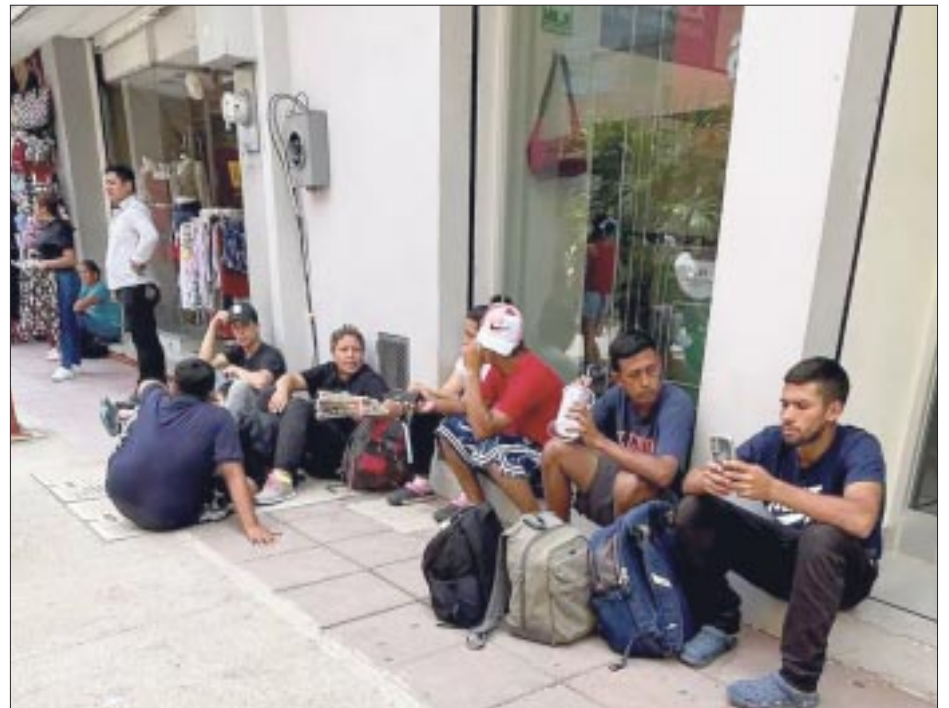
Ante las dificultades para lograr el “sueño americano”, cientos de migrantes extranjeros han decidido quedarse en México, sobre todo como alternativa antes de llegar a Estados Unidos.

Además, está condicionado a la propia ubicación sur, que es el punto de ingreso y