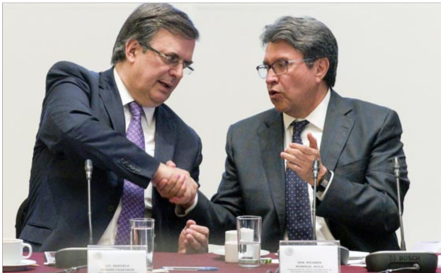
Los reyes del trapecio son el senador Ricardo Monreal y Marcelo Ebrard.