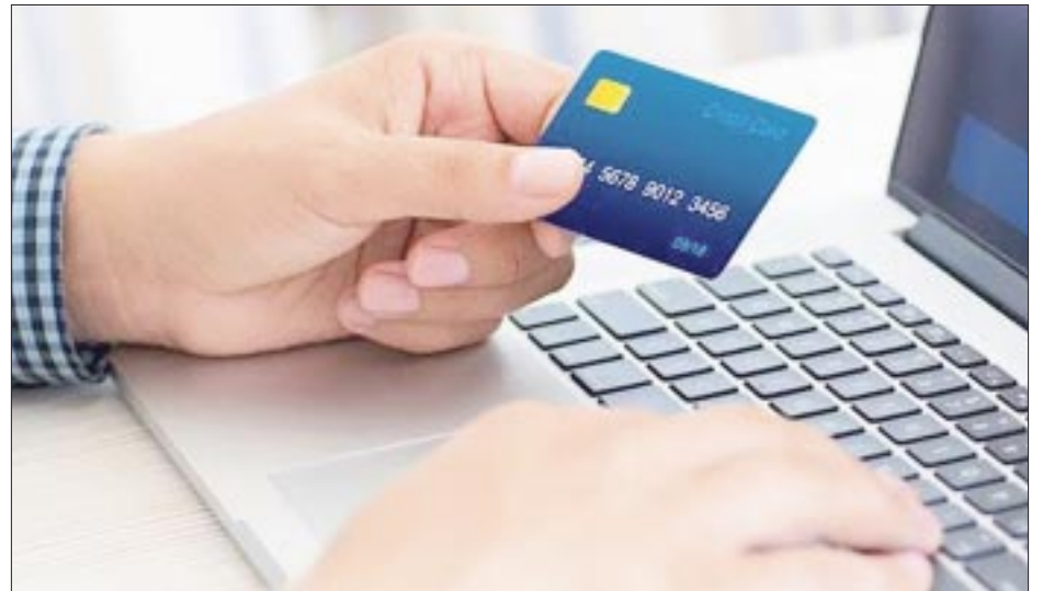
Bancos en México elevan sus alertas ante la sofisticación de técnicas de la delincuencia organizada para defraudar a clientes con cuentas digitales.