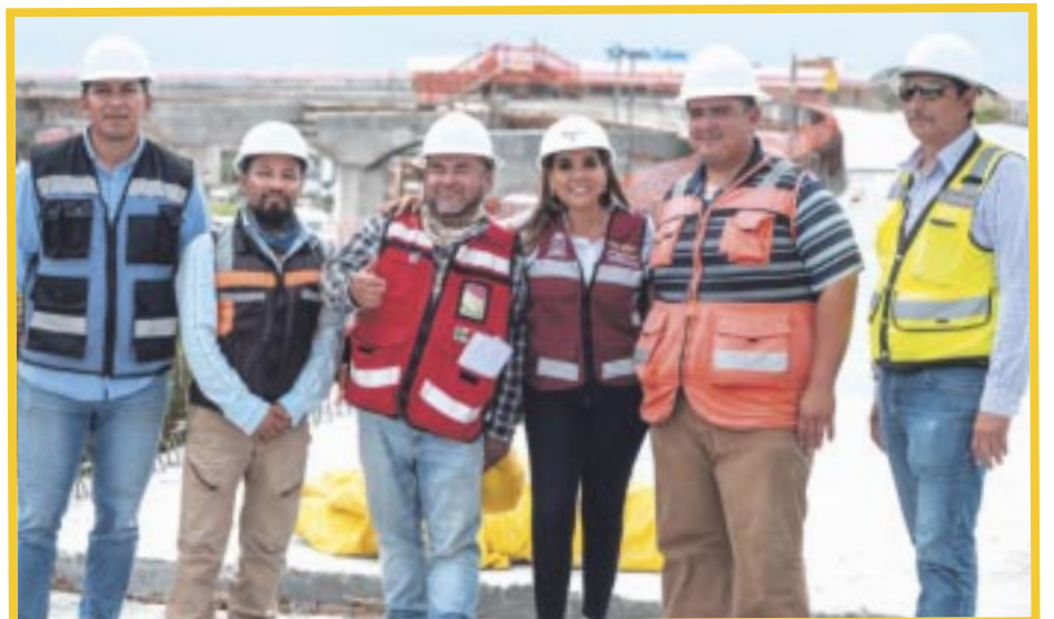
Mara Lezama Espinosa recorrió la construcción del puente vehicular Nichupté, una de las grandes obras de infraestructura que promovió, junto con el Tren Maya, en la Feria Internacional de Turismo (Fitur).

La gobernadora de Quintana Roo reiteró que este puente reducirá notablemente los tiempos de traslado para que las y los miles de colaboradores de la industria hotelera y de servicios pasen más horas con sus familias, y los turistas estén más tiempo en la ciudad.