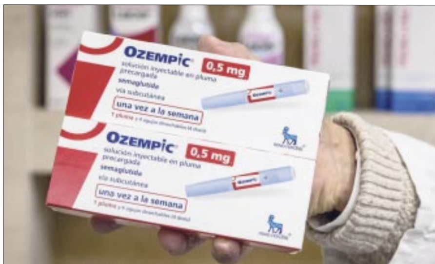
La oferta de productos milagro para bajar de peso pone en riesgo la salud de mexicanos, advierten representantes del sector farmacéutico y especialistas.

La especialista en nefrología recalcó que medicamentos como el Ozempic y Wegovy que son de alta demanda, han probado ser eficaces para ayudar a combatir el sobrepeso siempre y cuando se administren bajo tratamiento médico y tiempos no prolongados.