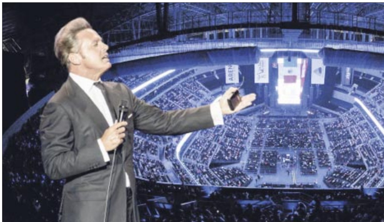
Luis Miguel es el único artista en lograr presentarse en 8 ocasiones en el 2023 en la Arena Ciudad de México.

El 29 de septiembre en Mazatlán, Sinaloa / Estadio El Encanto. Y posteriormente el 5 de octubre en Tampico / Estadio Tamaulipas y los días 8, 9, 11, 12, así como las nuevas fechas 15 y 16 del mismo mes en la Arena Ciudad de México.