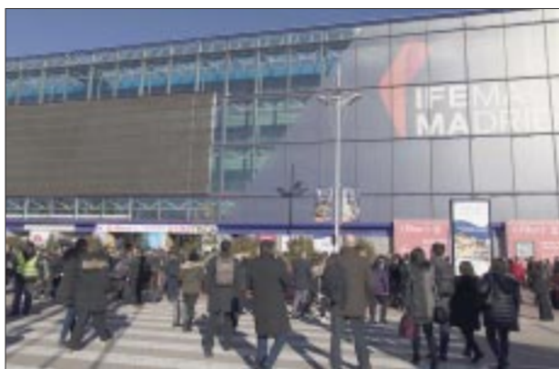
Cerró la Fitur en las jornadas dedicadas a profesionales.

victoriagprado@gmail.com X: @victoriagprado