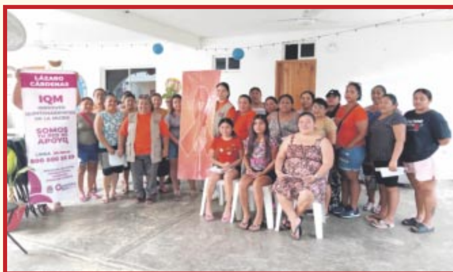
El Instituto Quintanarroense de la Mujer acerca servicios a las mujeres y realiza actividades en todo el territorio del estado con la finalidad de sensibilizar y generar conciencia para prevenir la violencia.

versas actividades como talleres, pláticas, difusión de servicios integrales y brigadas de servicios gratuitos, entre otras, con el objetivo de in-