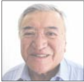
Por Miguel Ángel Rivera

El próximo miércoles 31, el grupo parlamentario de Morena en el Senado efectuará su sesión plenaria para definir la llamada agenda electoral, en la que se incluirán los temas que deberán tratar en el periodo ordinario de sesiones que se iniciará un día después, el 1 de febrero.