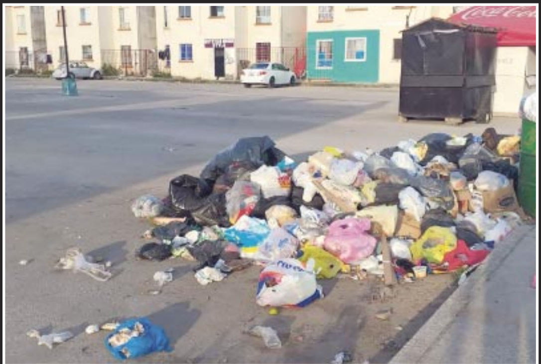
Durante el año pasado, la generación de residuos sólidos urbanos en Quintana Roo se disparó un 5.3% comparado con 2022.

Cabe recordar que en 2023, la Sema destinó 32 millones 971 mil 364.40 pesos para la evacuación y disposición final de residuos de la estación de transferencia de la isla de Holbox al relleno sanitario de Kantunilkín.