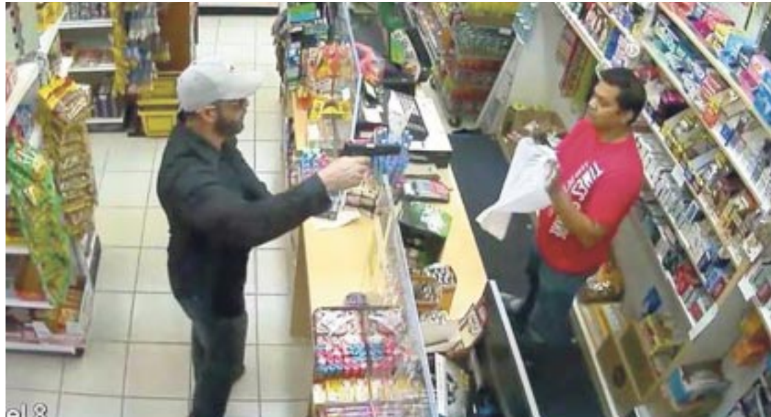
El robo a negocios en Chetumal se disparó 70.1 por ciento, entre el 2021 y el actual 2024.