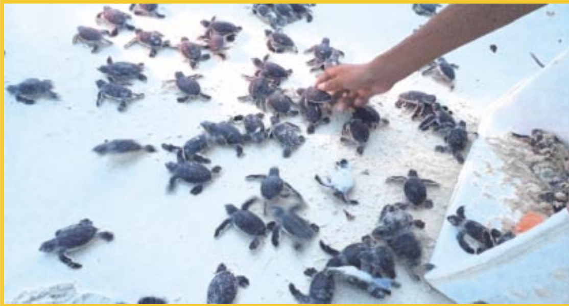
Durante el 2023 en Cancún se resguardaron 10 mil 865 nidos y más de 1.2 millones de tortugas.