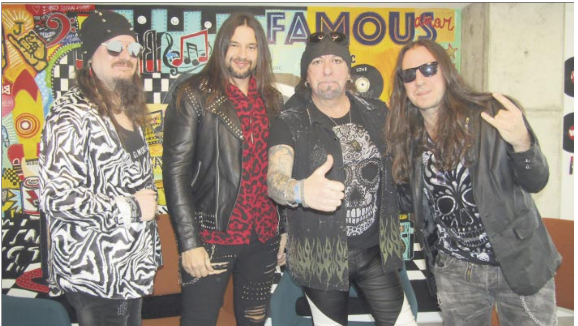
El álbum fue producido por Alberto Seara “Flor” en los estudios Cube.

“estuvimos trabajando en las canciones, diferentes tonalidades, y en cuanto empezamos a grabar en estudio todo fue muy fluido, la verdad que muy bien, yo personalmente estoy muy contento con el trabajo que se ha hecho porque está todo muy bien grabado, es un discazo”.