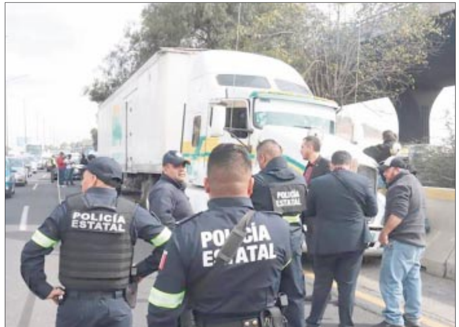
Integrantes de la Confederación de Cámaras Industriales pidieron a los gobiernos federal y del Estado de México blindar las carreteras de la entidad para reducir el robo al transporte de carga.

La industria pierde 7,000 millones de pesos anuales por el robo de mercancías y vehículos, así como por las acciones para cuidar a unidades en carreteras del Estado de