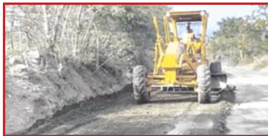
Hoteleros del sur piden que se reparen las carreteras que han sido dañadas con las obras del Tren Maya, para no afectar el turismo.