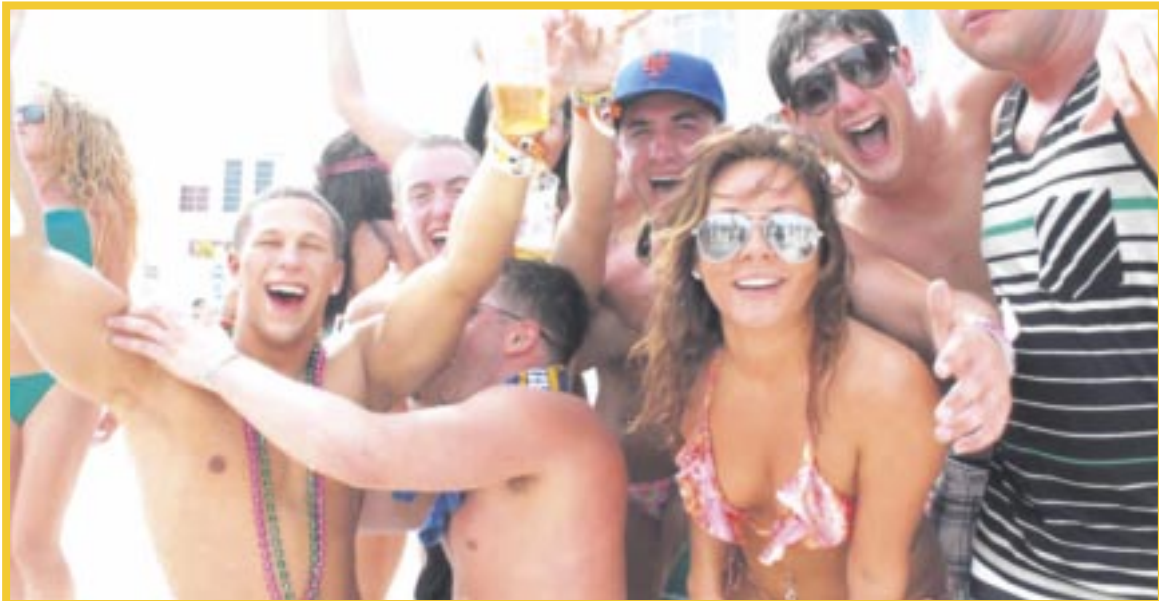
Cancún registró un crecimiento en captación de viajeros estadounidenses de 3.1% el año pasado.

Tan sólo el Aeropuerto Internacional de Cancún captó 5.6 millones de viajeros procedentes de Estados Unidos entre enero y diciembre de 2023, la cifra más alta en su historia, superando en 170 mil viajeros captados en 2022, cuando fueron 5.4 millones de visitantes desde el país vecino del norte.