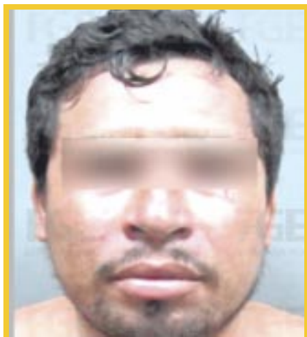
Candelario “N” recibió fallo condenatorio de 20 años y cinco meses de prisión por homicidio agravado.