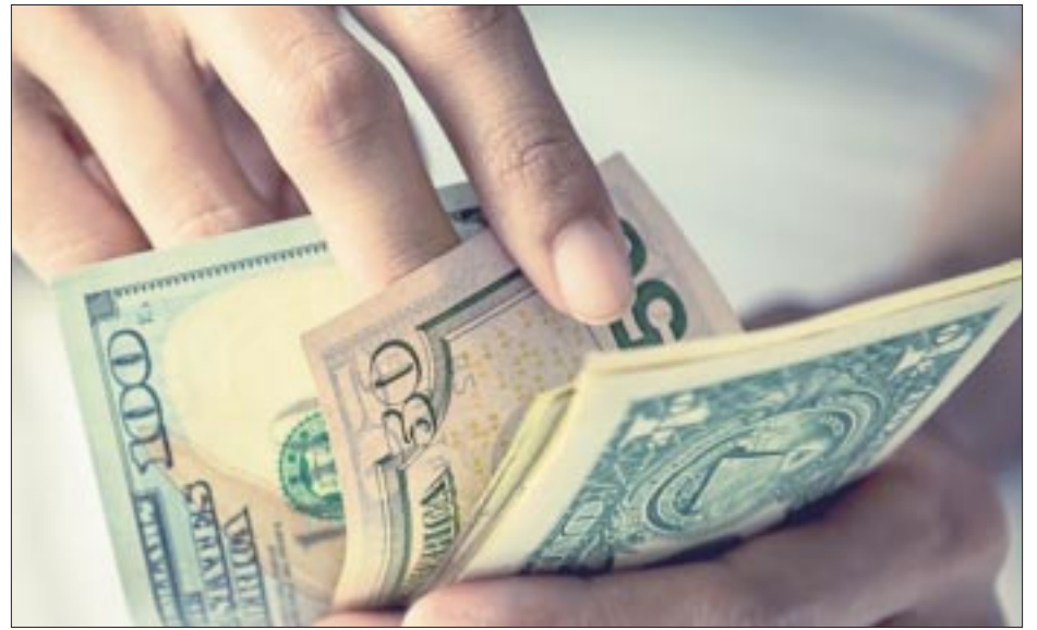
Tan sólo en noviembre pasado, México captó 4 mil 908 millones de dólares en remesas, un avance interanual del 1.9 por ciento.

El problema radica en la subocupación, que les afecta de manera más acuciante que a los hombres. Las mujeres están más sobrecalificadas en las tareas que desempeñan. Como consecuencia, el número de mujeres que ocupan cargos de dirección es mucho más reducido que el de hombres. Hay un filtro brutal a la hora de permitir a las mujeres promocionarse para estos cargos y no siempre está relacionado con una opción personal.