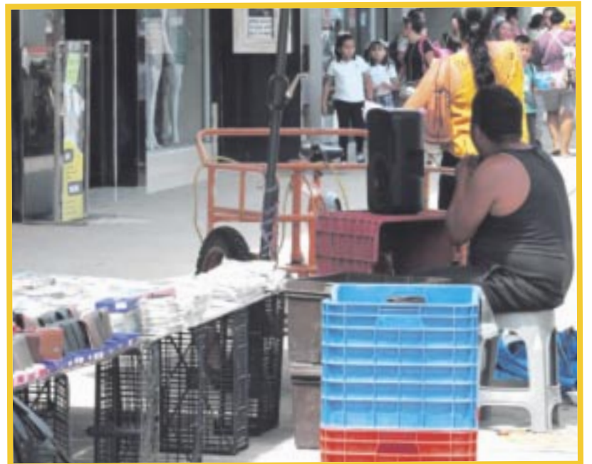
Los jóvenes quintanarroenses tienen una mayor probabilidad de que su primer empleo sea informal.

En el 70% de los casos que sí lo lograron, mencionaron que eran trabajos con sueldos bajos, pues casi no los consideran para puestos de gran responsabilidad como gerentes o jefes de departamento. El trabajo informal se refiere a aquellas actividades laborales que no están reguladas por un marco legal.