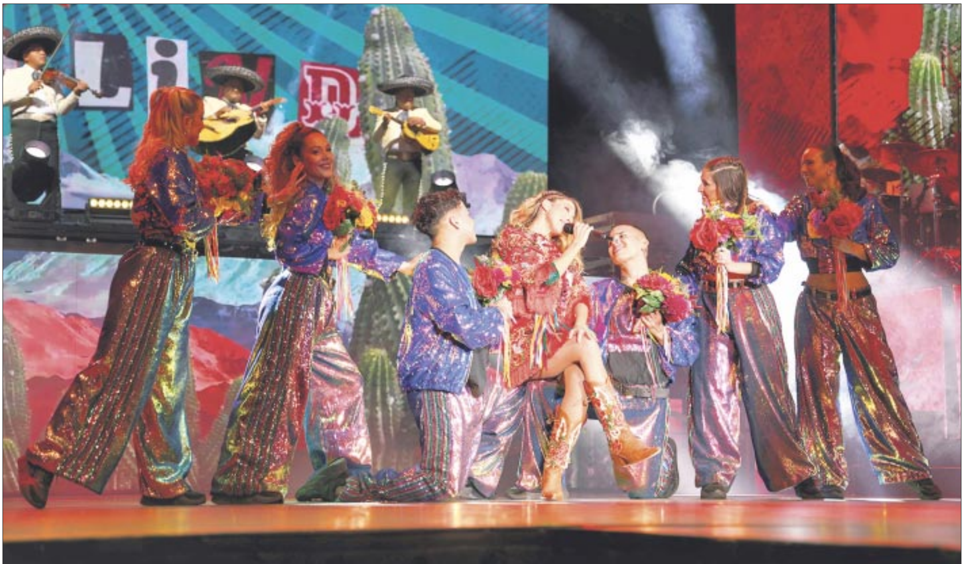
La estrella argentina revivió el fenómeno de Floricienta e inundó el recinto de cientos de flores amarillas.

8 de febrero – Guadalajara – Auditorio Telmex 11 de febrero – Monterrey – Arena Monterrey – Agotado 12 de febrero – Monterrey – Arena Monterrey 14 de febrero – Puebla – Auditorio Metropolitano 20 de marzo – Querétaro 22 de marzo – Mérida. 24 de marzo – Ciudad de México – Auditorio Nacional – Pocas localidades 27 de marzo – Tijuana.