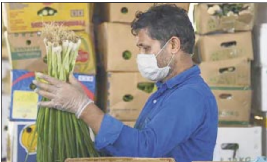
El principal problema del mercado laboral en México no es el desempleo, sino la subocupación por insuficiencia de ingresos, que asocia bajos ingresos con empleos de baja productividad.

Las remesas recibidas en países de bajo y mediano ingreso aumentaron un 3.8% en 2023 y se esperaba que la cantidad en dicho año alcanzara los 669 mil millones de dólares.