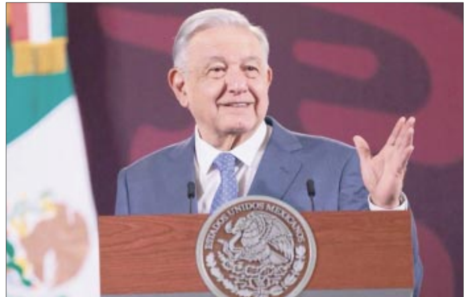
Andrés Manuel López Obrador detalló que se analizarán en las mañaneras las 20 reformas que presentó al Congreso de la Unión a fin de informar a la ciudadanía.

— Anuncia el Presidente análisis de las 20 iniciativas enviadas al Congreso