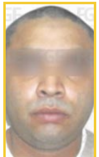
A Leonel “N” y José “N” , les impusieron la pena de 31 años y tres meses de prisión, así como a Jaime “N”, que alcanzó una penalidad de 37 años y seis meses de prisión por homicidio calificado.