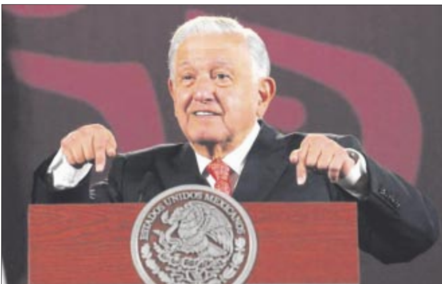
Andrés Manuel López Obrador justificó la reforma del Poder Judicial porque se trata de una institución que “está al servicio de la delincuencia de cuello blanco”.

El producto alimentario más importado sigue siendo el maíz amarillo (principalmente estadounidense). Las compras de este cereal crecieron 1.3% a un récord de 5,872 millones de dólares.