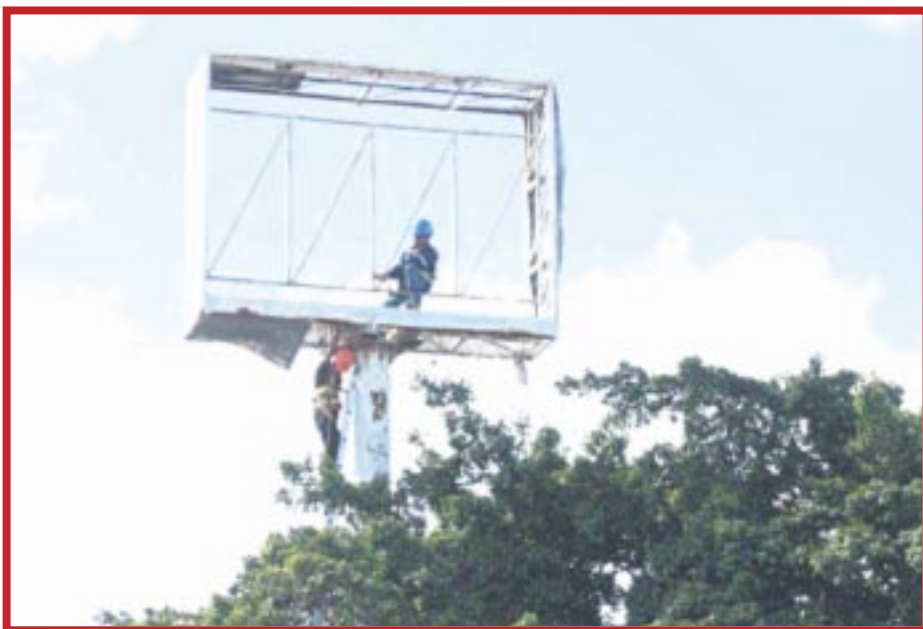
Autoridades retiran anuncios espectaculares en avenidas de Cancún.

La presidenta de la Confederación Patronal de la República Mexicana, Angélica Frías, aclara que 30 por ciento de las empresas que ya están aplicando estos procesos tecnológicos dan una mayor respuesta a sus clientes y de manera más satisfactoria, lo que representa avances importantes.