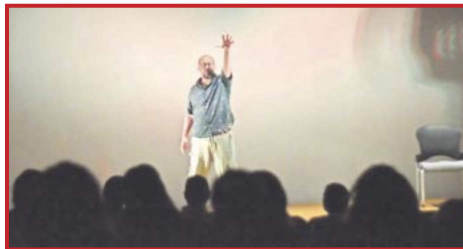
La FPMC ofrece un espacio para quienes aman el mundo de la actuación e invita al público a la obra de teatro "El Vagabundo del Blanquita".

Reiteró la invitación al público cozumeleño para que disfrute de la obra de teatro que se presentará gratuitamente este sábado a las 19:00 horas en el auditorio del Museo de la Isla.