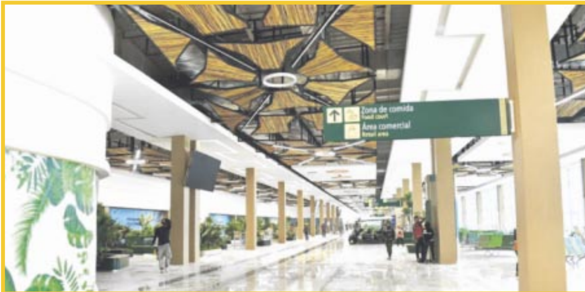
El Aeropuerto Internacional "Felipe Carrillo Puerto" de Tulum ya despegó en sus operaciones aeroportuarias.

Del 27 de enero al 2 de febrero, en el Aeropuerto Internacional Felipe Carrillo Puerto de Tulum se registraron 39 salidas y 39 llegadas nacionales, superando así las cifras del Aeropuerto Internacional de Chetumal, afirma la Secretaría de Turismo de Quintana Roo.