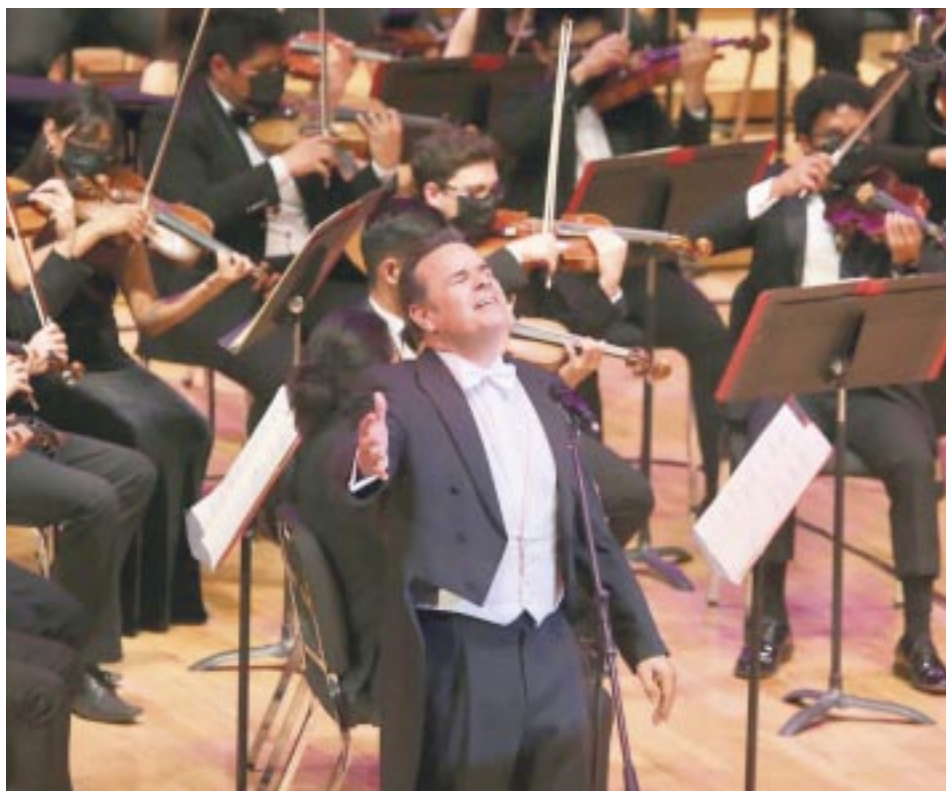
Su incansable labor en pro de Israel y el pueblo judío le valió el Premio Jerusalén en mayo de 2022.