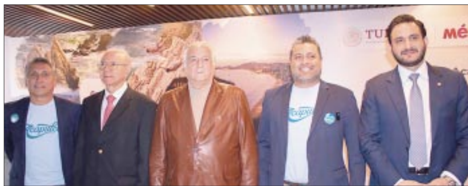
Los miembros de la cuarta edición de Sales Mission .

victoriagprado@gmail.com Twitter: @victoriagprado