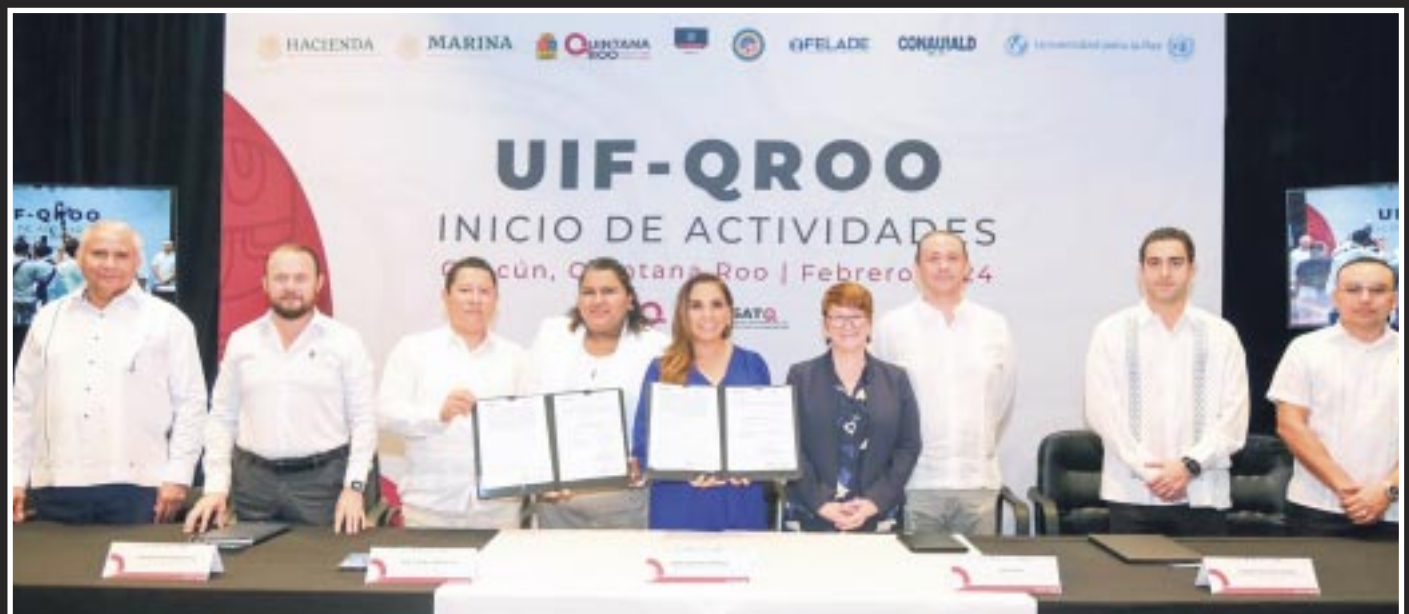
La gobernadora Mara Lezama Espinosa afirmó que el combate a la corrupción permite avanzar en la transparencia y rendición de cuentas para que nunca más se permita la impunidad.

En la ceremonia inaugural estuvieron presentes la presidenta honoraria del Sistema DIF Quintana Roo, Verónica Lezama Espinosa y diversas personalidades y representantes del sector turístico.