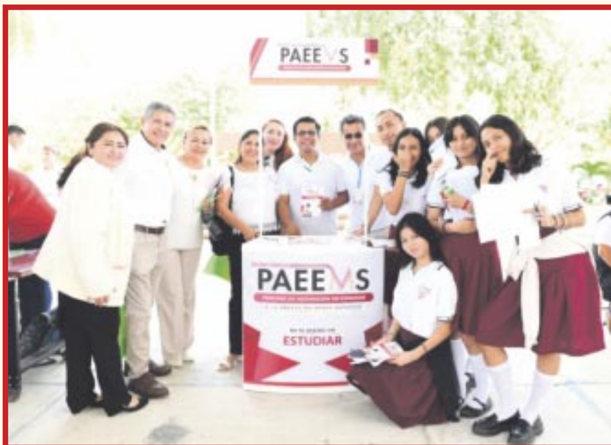
Fue inaugurada en las instalaciones de la escuela secundaria general número 14 “Los Corales”, la Feria Oferta Educativa Media Superior 2024.

Cancún.- En el marco del Proceso de Asignación de Espacios a la Educación Media Superior 2024 (PAEEMS), se inauguró en las instalaciones de la escuela secundaria general número 14 “Los Corales”, la Feria Oferta Educativa Media Superior 2024, diseñada para atender a 29 mil 652 jóvenes que se encuentran estudiando el tercer grado de secundaria de los 11 municipios del estado.