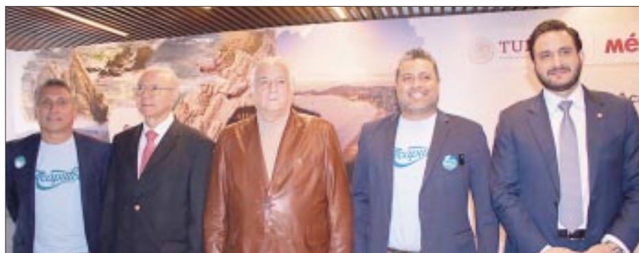
Los miembros de la cuarta edición de Sales Mission .

victoriagprado@gmail.com Twitter: @victoriagprado