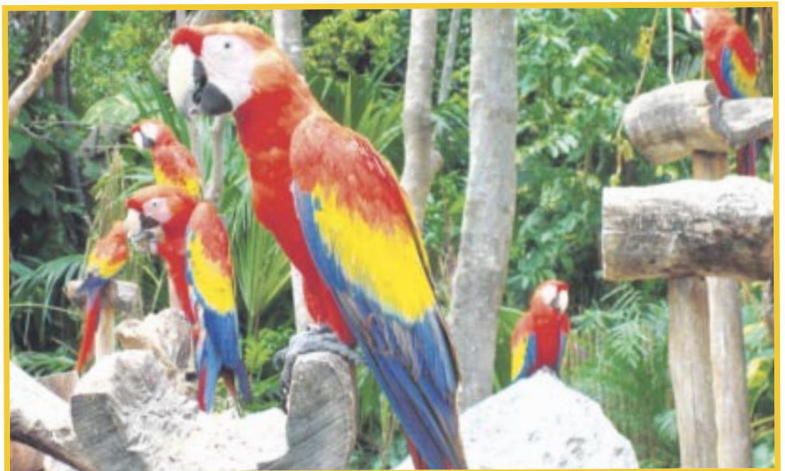
Reconocimiento a Grupo Xcaret por su contribución a la industria turística del país, así como su ejemplar liderazgo en temas de sostenibilidad.

Grupo Xcaret opera bajo un modelo de Xostenibilidad, que permite comunicar con facilidad las acciones encaminadas al desempeño de un negocio próspero, la generación de bienestar social y la conservación del entorno.