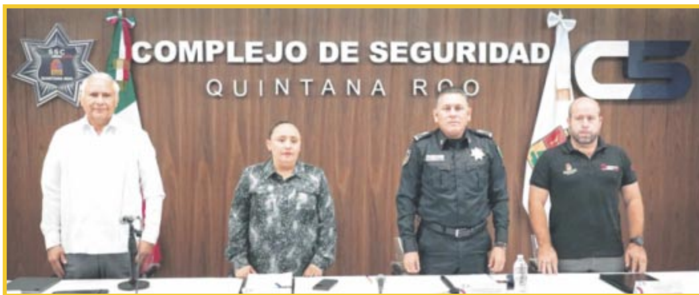
El fiscal Raciél López Salazar informó que del 5 al 11 de febrero, el organismo a su cargo inició 915 carpetas de investigación, además de que cumplimentó 27 órdenes de aprehensión y llevó cabo nueve cateos.

Finalmente, el Fiscal General informó que en el periodo mencionado obtuvieron cuatro sentencias condenatorias: dos por homicidio calificado, una por homicidio en grado de tentativa y una más por robo de autopartes.