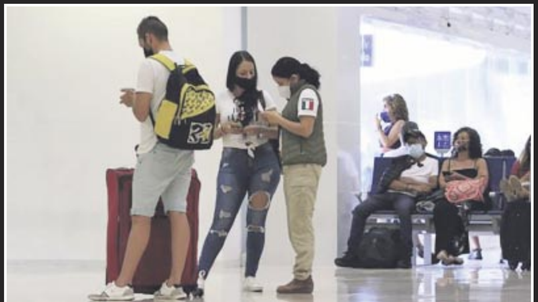
El Consulado de la República Checa en Quintana Roo informó que se presentan 6 casos de robo de pasaportes en el estado, mensualmente.

Los destinos que más prefieren son Cancún, Playa del Carmen y Tulum; es un turismo de mochila, de aventura y por lo general tienen una estancia de dos semanas.