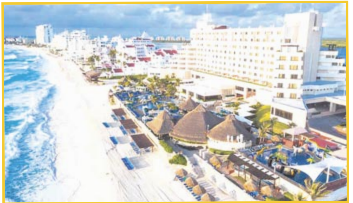
En los hoteles de Quintana Roo se ofrecen menos habitaciones como una consecuencia directa del grave déficit de trabajadores.