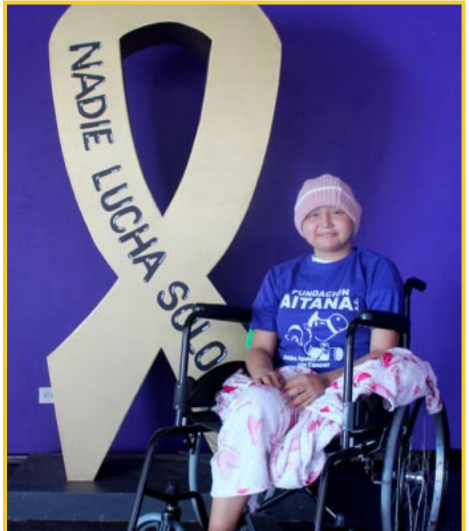
La Fundación Aitana retomará la caminata de concientización por el Mes del Cáncer Infantil, cuyo principal objetivo es dar visibilidad a los niños y niñas que están en proceso de recuperación, así como a aquellos que han superado el cáncer.

A fin de crear conciencia de la detección temprana