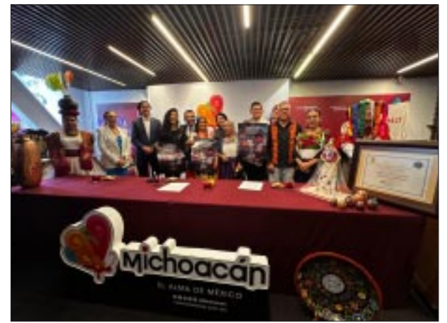
Fiestas en Michoacán.