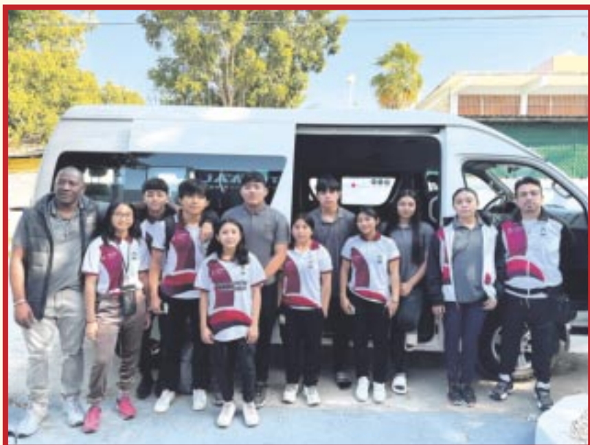
Un equipo integrado por 12 deportistas quintanarroenses viajaron a Celaya, Guanajuato, para tomar parte del Campeonato Nacional Juvenil 2024.

Chetumal.- Como parte de su preparación y fogueo de cara a la eliminatoria para los Nacionales Conade 2024 y como clasificación al Campeonato Mundial Juvenil 2024, el equipo de Quintana Roo en la disciplina de levantamiento de pesas, viajó con destino a Celaya, Guanajuato, para competir en el Campeonato Nacional Juvenil Sub-15 y Sub-17.