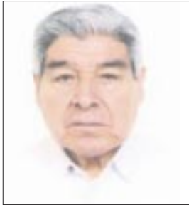
Por Eleazar Flores

ITESO ES LA VÍCTIMA.- Al margen de que le daré nombres y le detallaré hechos, el Movimiento de Regeneración Nacional, Morena, propinó este fin de semana su primera derrota al DESCAFEINADO Instituto Nacional Electoral, INE, siendo la víctima el Instituto Tecnológico de Estudios Superiores de Occidente, ITESO.