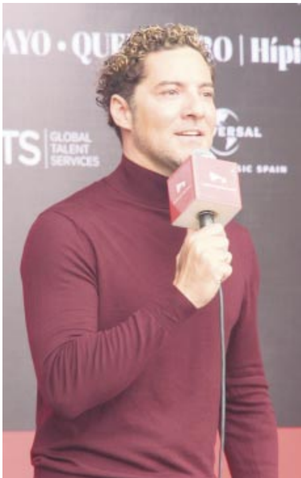
Lleno de emoción y alegría en conferencia agradeció "me da muchísima alegría compartir con ustedes mi regreso en un concierto muy especial.

Bisbal aseguró que en el concierto habrá muchas sorpresas "trabajaré para que muchas personas puedan acompañarme como invitados, es laborioso porque con 20 años no puedo dejar alguna canción fuera".