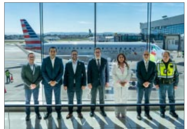
De Tijuana a Phoenix.

la nueva ruta sin escalas entre Tijuana y Estados Unidos a través de nuestro centro de conexiones en Phoenix. Al unir estas dos ciudades, no solo establecemos mejores conexiones, sino que fortalecemos nuestro compromiso de más de 80 años con México”.