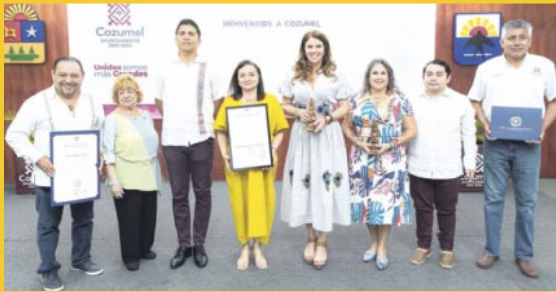
Autoridades de Cozumel y Miami Beach refrendan hermanamiento firmado hace 32 años.