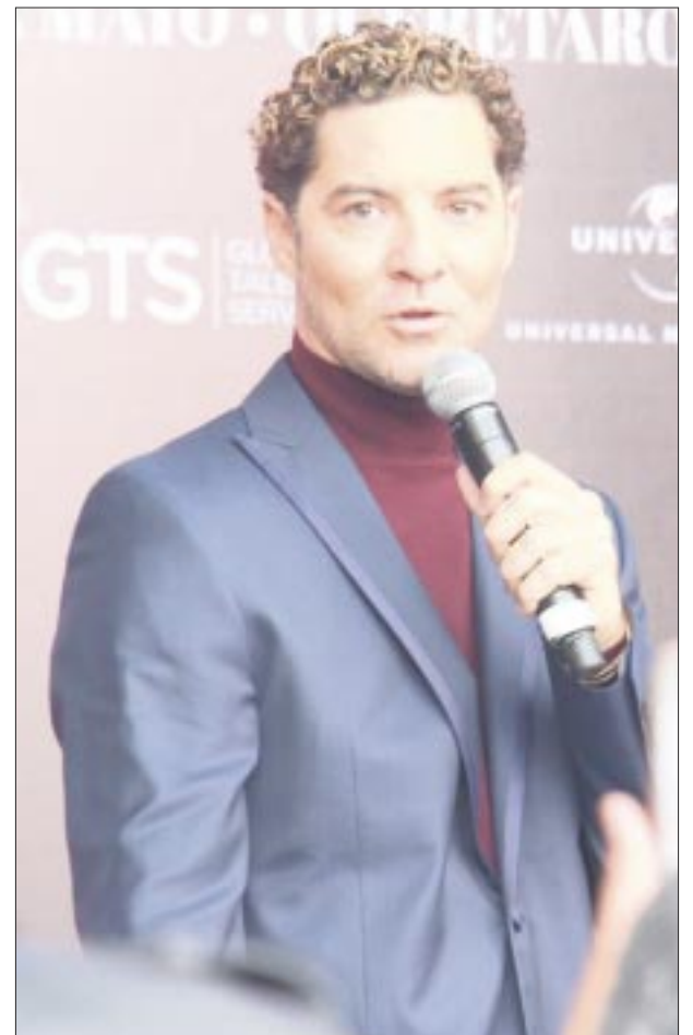
David Bisbal llega con su Tour México 2024 con el que estará festejando su 20 aniversario como cantante.

Los boletos están a la venta en taquilla del recinto o en la página www.ticketmaster.com .