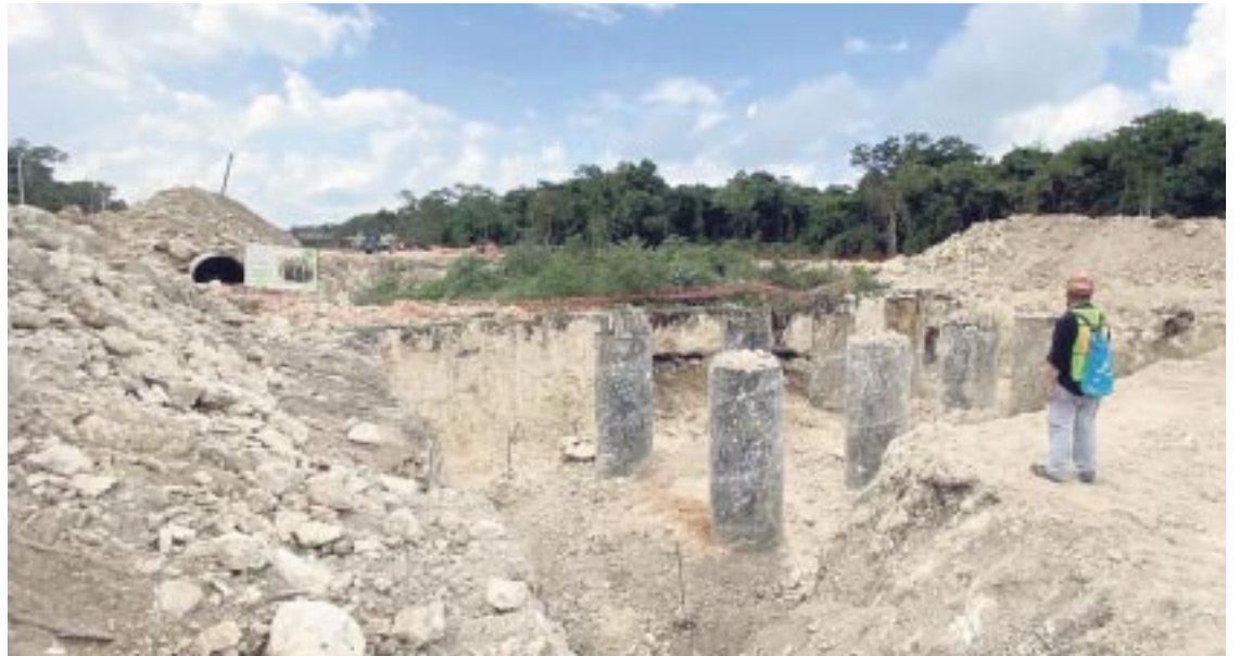
Un tribunal federal de Yucatán ordenó detener las obras del Tramo 5 Sur del Tren Maya.