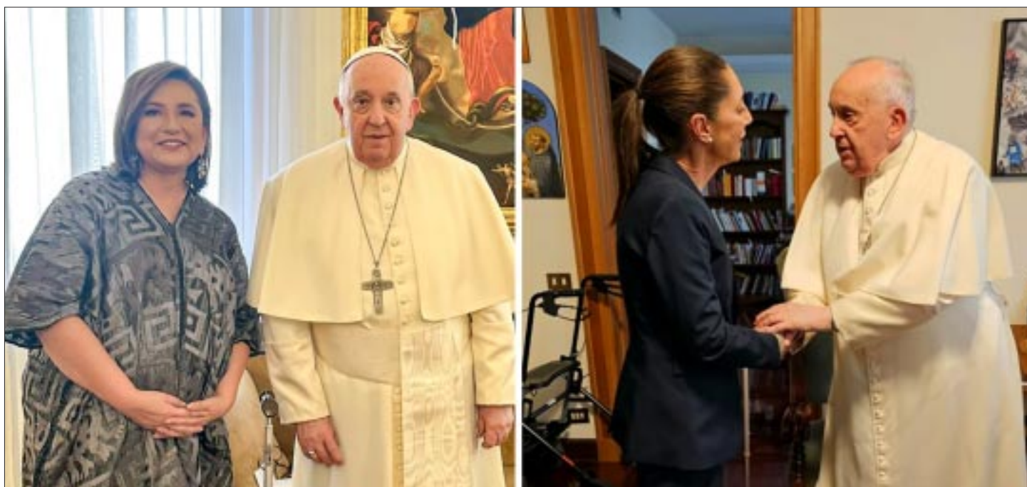
Las candidatas presidenciales Xóchitl Gálvez Ruiz y Claudia Sheinbaum Pardo visitaron al papa Francisco.

ramonzurita44@gmail.com ramonzurita44@hotmail.com