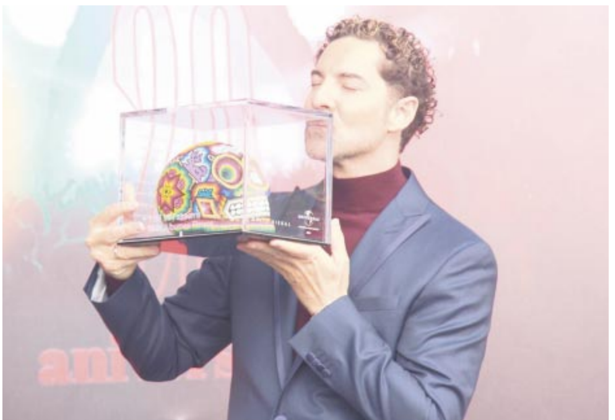
El equipo de Universal Music celebrando su trayectoria le obsequió un reconocimiento al cantante, un Cráneo Huichol.