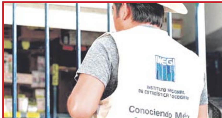
En Solidaridad ya laboran 45 personas de los 453 entrevistadores y personal de campo del Inegi.

Destacó la manera en que ese instituto identifica a sus colaboradores y puntualizó que el gobierno local capacita a un grupo de elementos de la Secretaría de Seguridad Pública en temas de extorsión, flagelo que más ha perjudicado a los negocios en todo el país y que ha propiciado que algunos opten por bajar cortinas.