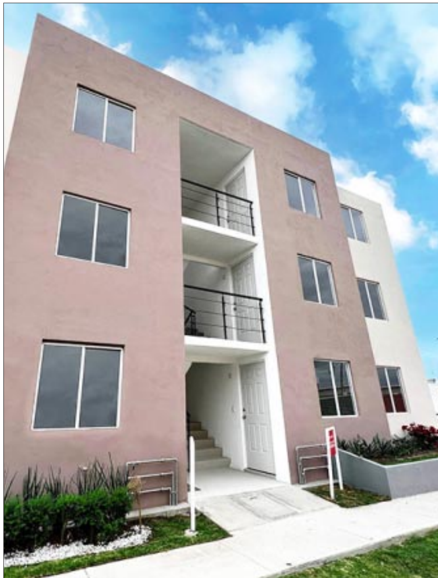
De 2020 al 31 de enero de 2024, el Instituto del Fondo Nacional para la Vivienda de los Trabajadores otorgó 15 mil 428 financiamientos en Quintana Roo.

El programa tiene entre sus requisitos que para poder unir sus créditos, los derechohabientes deben tener un empleo formal vigente y cotizar ante el Instituto, contar con los puntos necesarios para solicitar el crédito y realizar el curso en línea Saber Más Para Decidir Mejor en Mi Cuenta Infonavit.