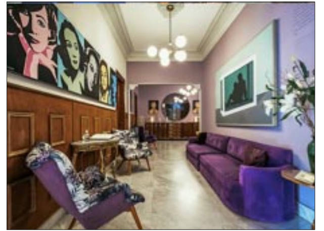
El inmueble destaca por su estilo.

☆☆☆☆ En la octava edición de los premios Food and Travel Reader Awards , España recibió el premio como “Mejor destino internacional 2023”. Las