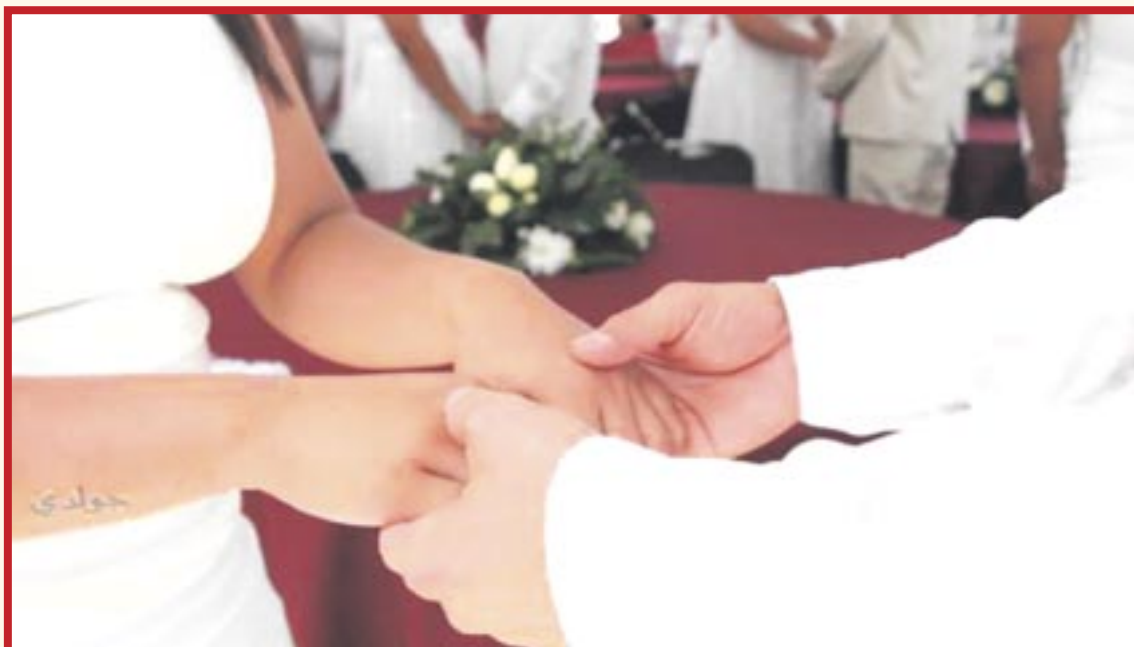
Se llevaron a cabo las Bodas Colectivas 2024 en el Centro Penitenciario de la ciudad de Cancún, en donde 38 parejas se unieron en matrimonio.

Benito Juárez.- El programa tiene como objetivo garantizar la certeza jurídica y fortalecer los derechos de los contrayentes, tales como: la seguridad social, la sucesión testamentaria y el reconocimiento de beneficios de la unión legal.