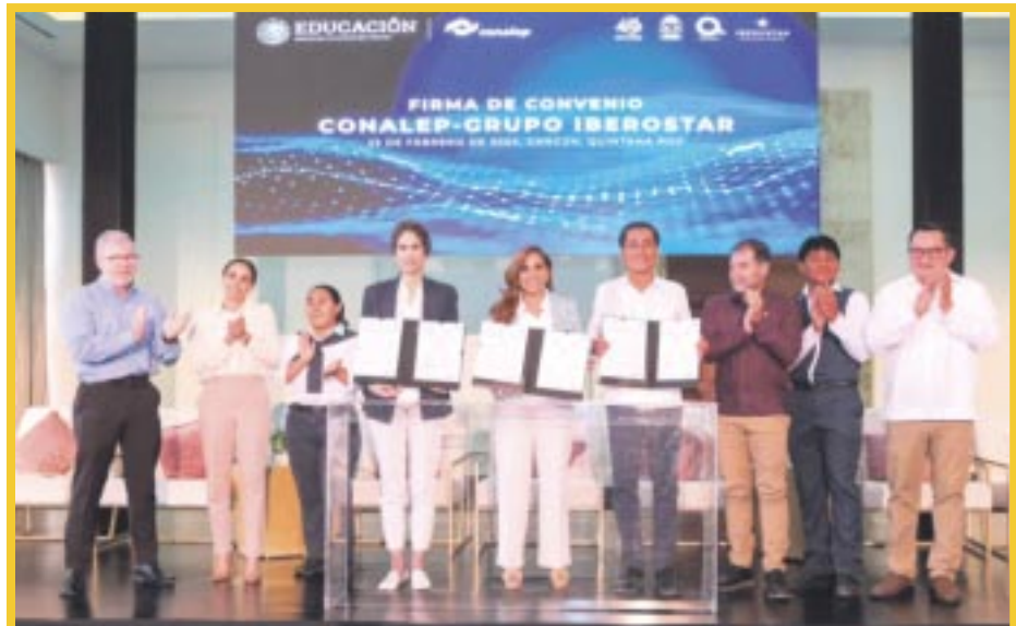
Mara Lezama Espinosa atestiguó la firma de convenio entre el Colegio Nacional de Educación Profesional Técnica (Conalep) y el Grupo Iberostar.

Acompañando al ejército de la transformación social de 21 dependencias con 80 servicios institucionales, la gobernadora Mara Lezama Espinosa recorrió las áreas de atención y entrega de apoyos de la Caravana del Bienestar que estuvo en el domo