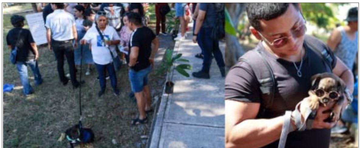
Se llevó a cabo con gran éxito la campaña “AdoptaFest” en el Parque Kabah con la participación de agrupaciones rescatistas y comercios locales.

Además, durante el evento participaron agrupaciones rescatistas y comercios locales. El gobierno municipal de Benito Juárez ha implementado diversas acciones en materia de protección animal, como la creación del Padrón Municipal de Mascotas Domésticas y la inauguración del parque canino “Sombra”.