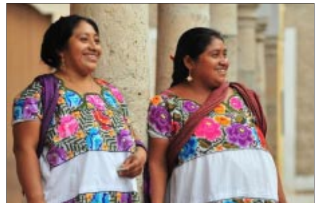
Yucatán reconocido por el Maya yucateco.

votaciones estuvieron abiertas durante cuatro meses y participaron 42 mil lectores de la revista, en versión digital e impresa.