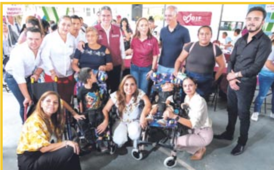
La gobernadora Mara Lezama Espinosa recorrió las áreas de atención y entrega de apoyos de la Caravana del Bienestar que estuvo en el domo deportivo de la Región 77, colonia Corales.

La firma de este convenio, el primero en su tipo a nivel nacional, con el Grupo Iberostar, empresa multinacional española, permite que el Conalep) siga consolidando la vinculación con el sector productivo en beneficio de los estudiantes de las 32 entidades federativas con 64 carreras y 314 planteles en operación.