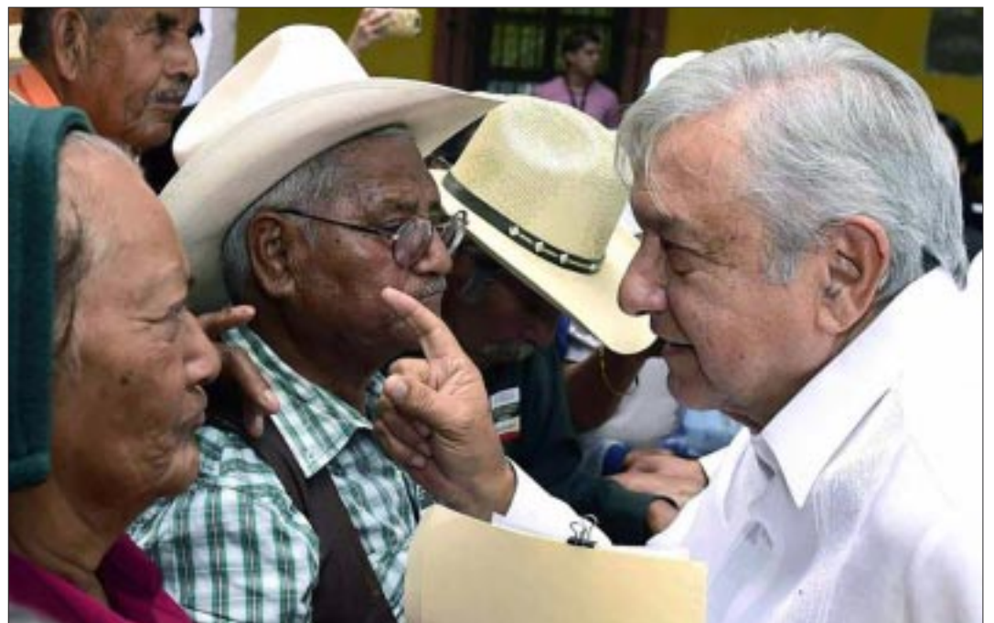
Se empieza a perfilar la forma en que habrá de ser analizado el gobierno de Andrés Manuel López Obrador.

ramonzurita44@gmail.com ramonzurita44@hotmail.com