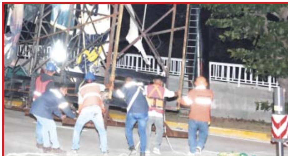
Se han retirado 10 estructuras de anuncios espectaculares que se encontraban distribuidos en diversos puntos de Cancún.

En cada uno de los casos, las autoridades realizaron un dictamen sobre las estructuras, determinando que en cada uno de los casos representaban un riesgo para la ciudadanía, y uno de ellos fue derribado el pasado 5 de febrero a causa de fuertes vientos.