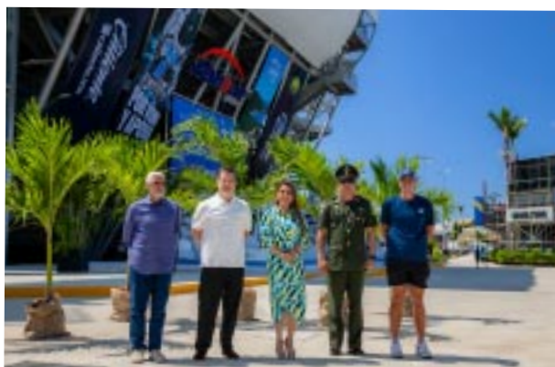
Reabre la Arena GNP en Acapulco.

victoriagprado@gmail.com X: @victoriagprado