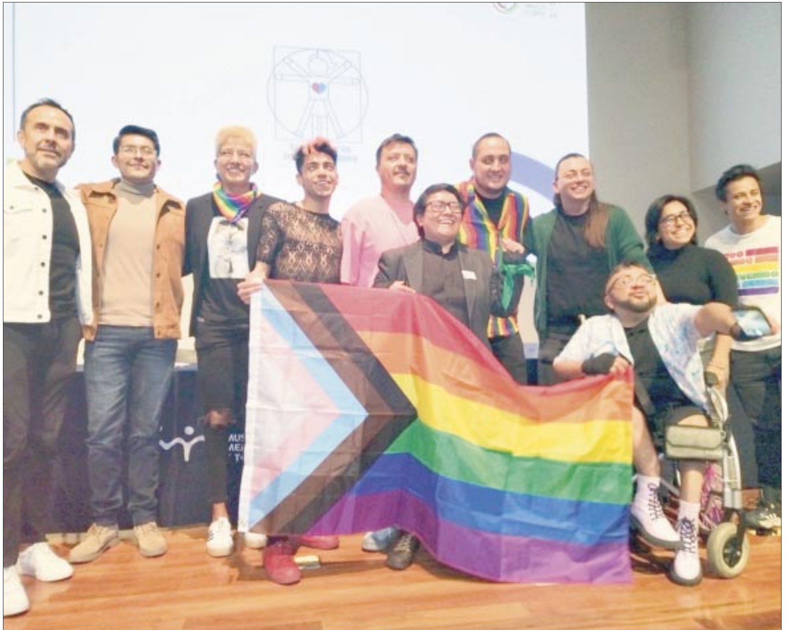
El programa de actividades de la marcha del orgullo LGBTTTI contempla eventos lúdicos y culturales.

“La intención es poder compartir la perspectiva de lo que está sucediendo alrededor de la organización de la Marcha, y cómo podemos ir siempre para mejorar la or-