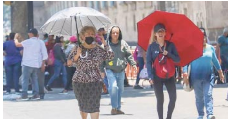
Llega la primera ola de calor y contingencia ambiental al Valle de México.

Es así que desde la primavera y hasta el verano habrá altas temperaturas, por lo que la sequía en el país podría agravarse principalmente en los estados antes menciona-