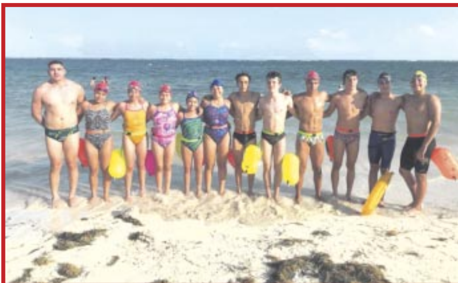
Los selectivos municipales de Cozumel de boxeo, patinaje de velocidad y aguas abiertas, tuvieron una destacada participación.

Esta etapa se realizó bajo la organización y aval de la Codeq, en conjunto con la Asociación de Boxeo Quintanarroense y se hizo con el objetivo de conformar el preselectivo que estará realizando el proceso en busca de un lugar para la fase final de los Nacionales Conade 2024.