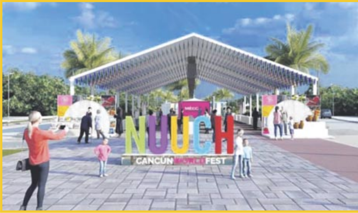
Del 1 al 3 de marzo se celebrará en el Malecón Tajamar el Cancún World Fest "Nuuch".

En el festival se contará con un túnel con toda la historia de los 11 municipios de Q. Roo, así como un pabellón con todos los patrocinadores; 10 países estarán en el pabellón cultural, también habrá de romance, el académico, de entretenimiento, uno de ecoturismo, una área deportiva y una concha acústica.