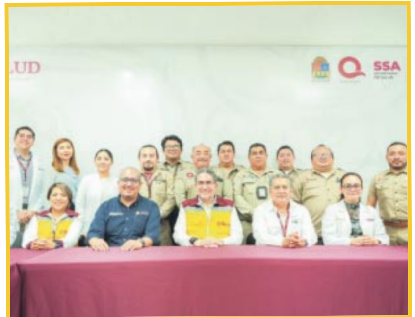
En reunión operativa, autoridades de la Secretaría Estatal de Salud y del Cenaprece destacaron la importancia de la limpieza en los hogares.

También se remarcó la importancia de la participación ciudadana para mantener sus patios y espacios limpios y libres de criaderos de mosquitos para evitar la propagación de la enfermedad, abrir las puertas al personal de vectores para realizar actividades de inspección en sus domicilios y/o lugares de trabajo.