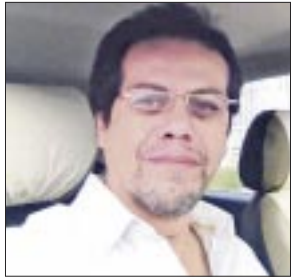
Por Mauricio Conde Olivares

Al tiempo que se espera el arribo de más de 20 mil spring breakers este año a los destinos turísticos de Quintana Roo, según las estimaciones de la Asociación de Hoteles de Cancún, Puerto Morelos e Isla Mujeres, el aeropuerto internacional de Tulum recibirá en el invierno de 2024-2025 la primera conexión sin escalas desde Europa de Discover Airlines, lo que traerá mayor derrama económica y visitantes, señaló la gobernadora Mara Lezama Espinosa.