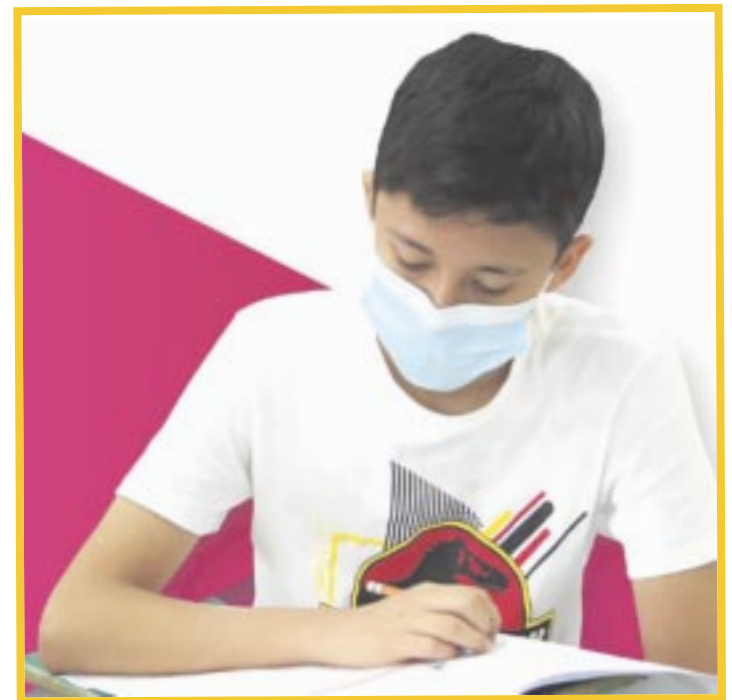
Abren convocatoria para participar en el Proceso de Asignación de Espacios a la Educación Media Superior 2024.

Según las estadísticas del inicio del ciclo escolar 2023-2024, están registrados 29 mil 652 estudiantes de tercer grado de secundaria en los 11 municipios del estado, de los cuales 14 mil 880 son hombres y 14 mil 772 mujeres, que incluye a escuelas públicas, privadas y CONAFE.