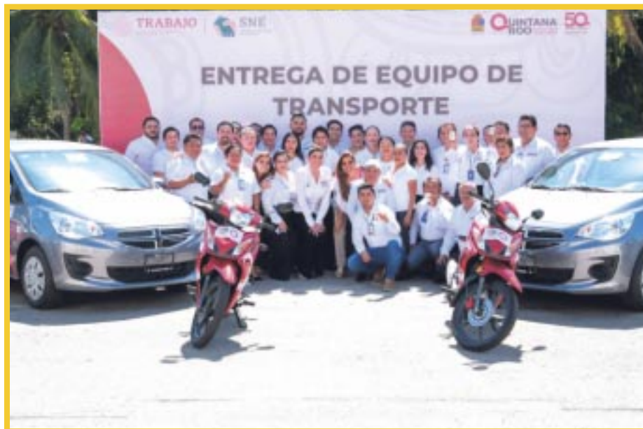
Mara Lezama Espinosa entregó vehículos para fortalecer el trabajo continuo de la Oficina del Servicio Nacional de Empleo en sus tres unidades regionales de Chetumal, Playa del Carmen y Cancún.

Lezama destacó la importancia del empleo para el desarrollo personal y familiar, así como la necesidad de impulsar políticas públicas para generar más puestos de trabajo.