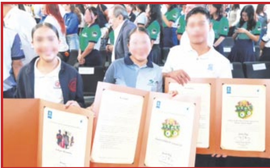
Entregaron siete distintivos del programa internacional “Eco-Schools” a escuelas en Cancún.

Los datos oficiales refieren que el 24% de los residentes extranjeros en Quintana Roo están por cuestiones familiares, 19% educativas y sólo un 36% por trabajo, cuando la realidad es que más del 60% de los visitantes están empleados en el sector turístico, al menos cuando se trata de los “irregulares”.