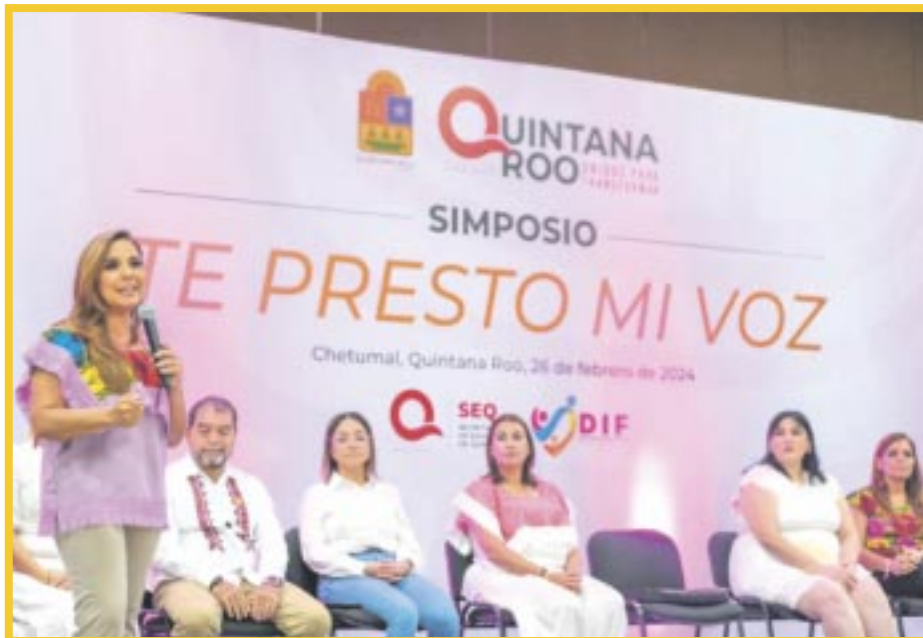
Clausura del Simposio dirigido al personal especializado en la educación de niñas, niños y adolescentes con discapacidad en los USAER, CAM, y CAED .