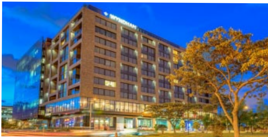
El hotel en Bogotá, Colombia.

victoriagprado@gmail.com X: @victoriagprado