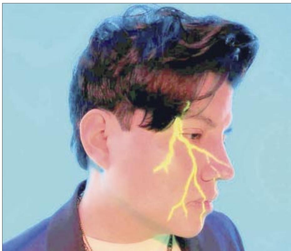
“Vivan Despiertos” nos recuerda la importancia de disfrutar cada instante de la vida y agradecer a Dios por los bellos momentos vividos.

Faith en abril estarán en Colombia con una serie de 8 conciertos, posteriormente en Estados Unidos junto a Álvaro López quien fuera baterista de Luis Miguel en los noventas. Y finalmente buscarán tocar en México.