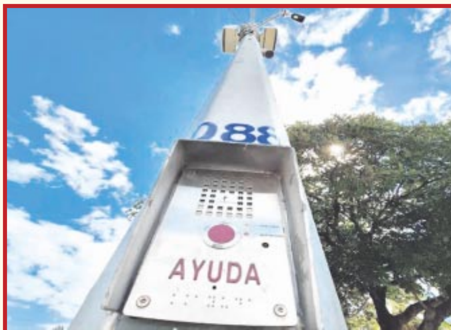
Se han instalado botones de pánico en 450 puntos estratégicos de Cancún, pero la gente no sabe para qué sirven.

Cancún.- Se han instalado botones de pánico en 450 puntos estratégicos de Cancún; sin embargo, se han usado solo 1 mil 835 veces y en ningún caso se trató de una emergencia real.