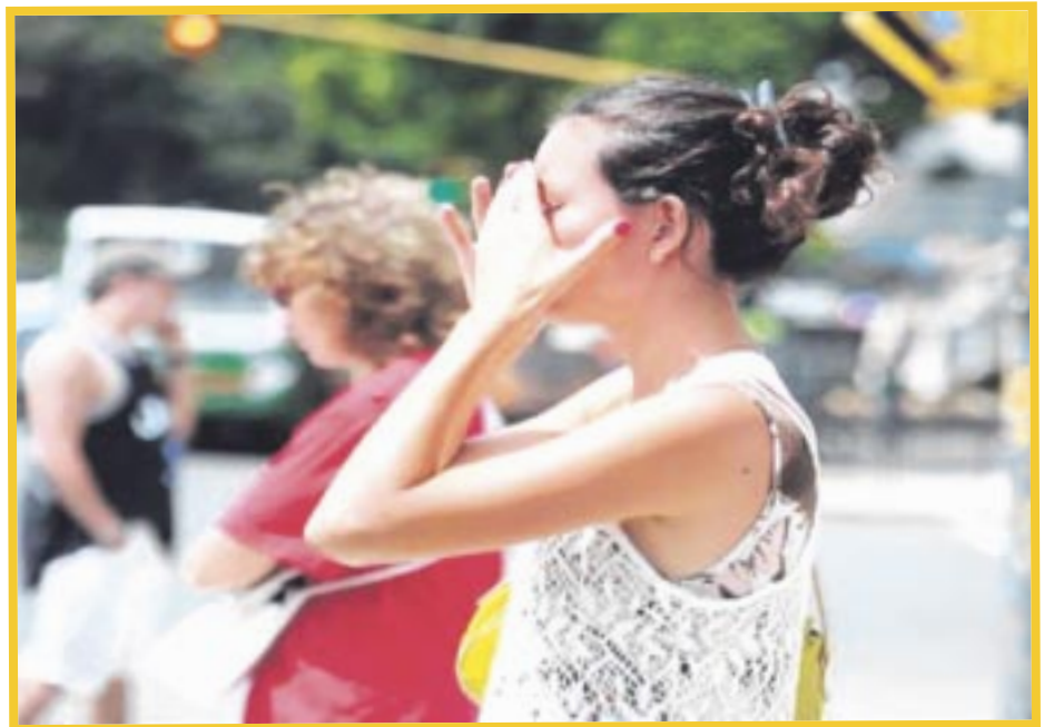
Protección Civil de Playa del Carmen advierte que en los próximos días se espera un incremento de temperaturas.

Lamentó que en Playa del Carmen, la temporada invernal y los eventos de vientos del norte ocasionaron el cierre del puerto a embarcaciones menores en diversas ocasiones; pero con el mejoramiento del estado del tiempo, se prevé que estas medidas disminuyan.