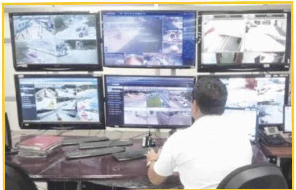
Abrieron 100 espacios para aquellos empresarios interesados en conectar sus cámaras de seguridad al C4 en Chetumal.

En el caso del C4 Municipal de Chetumal, monitorean las cámaras de seguridad en zonas específicas dentro de la ciudad. Se encargan de vigilar y coordinar la seguridad local y trabajan en conjunto con las fuerzas de seguridad locales, como la policía municipal y la protección civil.