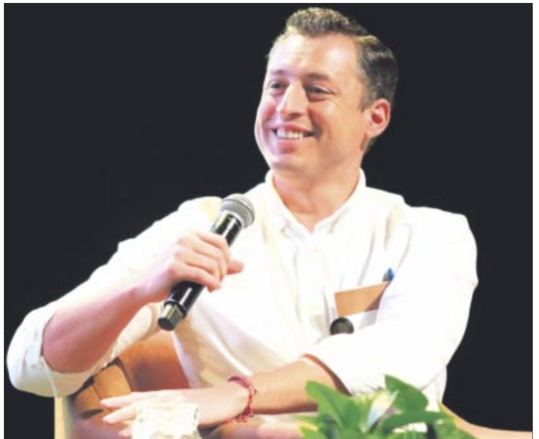
La elección del 2 de junio será importante para la consolidación de Luis Donald Colosio Riojas.