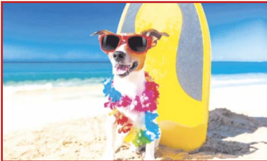
AMAS destaca la necesidad de convertir a Cancún en un destino completamente pet friendly.