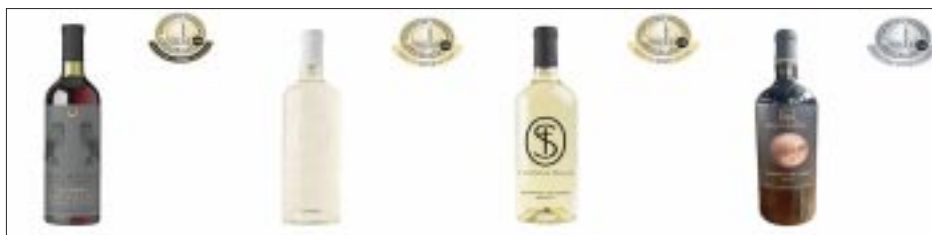
Los vinos sanmiguelenses.

victoriagprado@gmail.com X: @victoriagprado