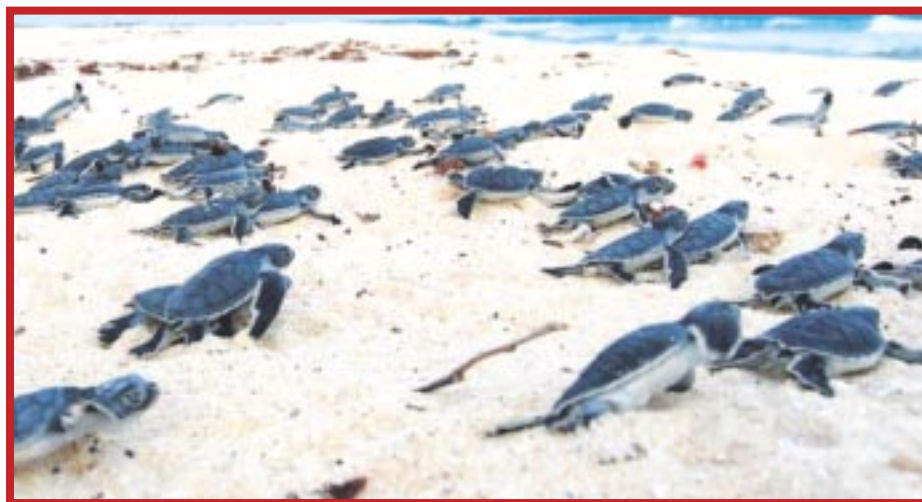
El Campamento Tortuguero “San Martín”, lleva contabilizados 216 nidos.