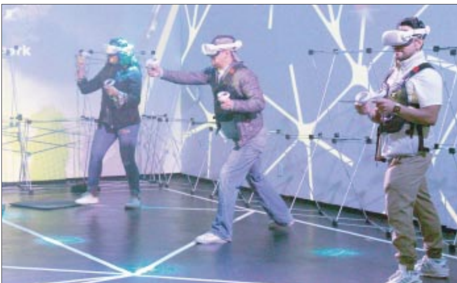
Con cada juego podrás ir sumando puntos acumulables, que después podrás cambiar por premios.

Los accesos de entrada los puedes encontrar en su página oficial o en taquilla del parque. Cuentan con entrada general en $329.00, el Ticket VIP en $479.00 y el pase anual. ¿Estas listo para convertirte en un Virtualsapiens?