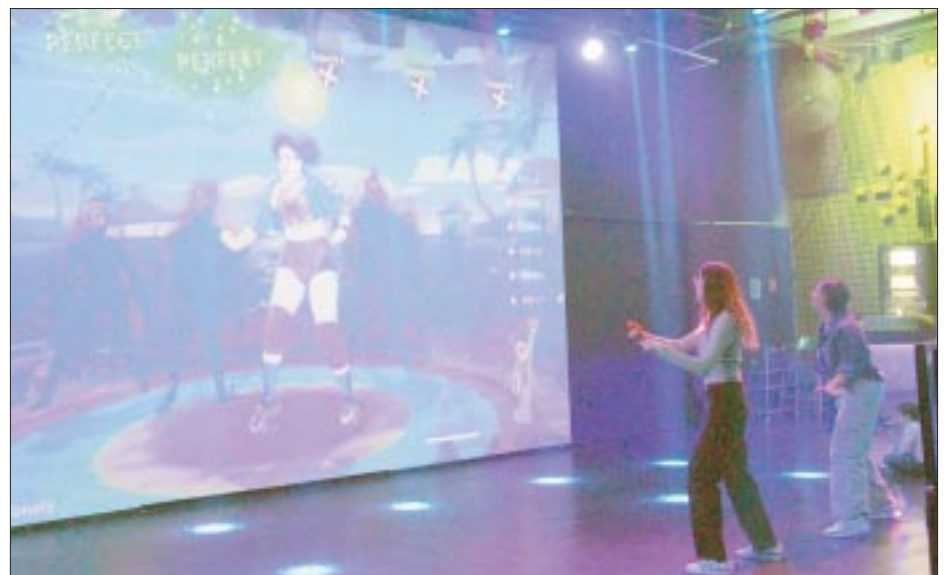
Debes estar atento a las indicaciones, y para seguridad de cada visitante en cada estación habrá expertos asistiéndote.