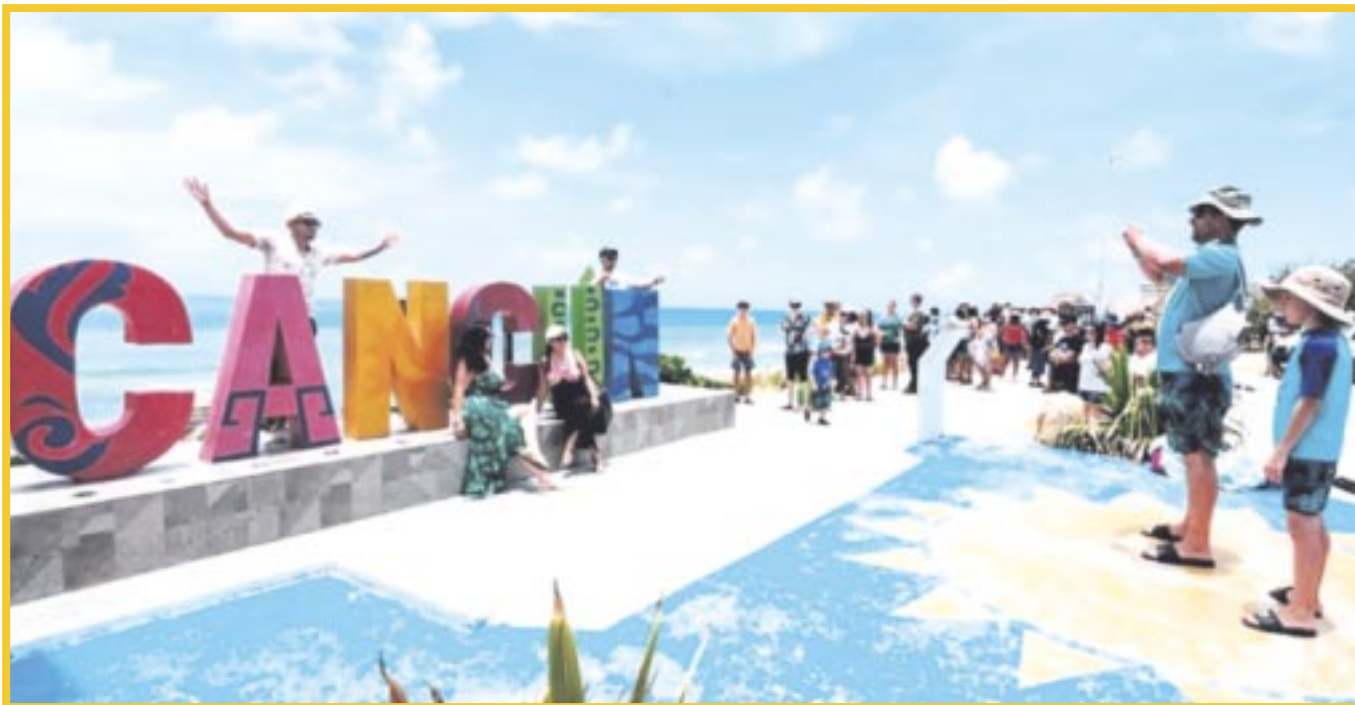
Sector hotelero trabajan en la promoción del Caribe Mexicano en destinos como Puebla.