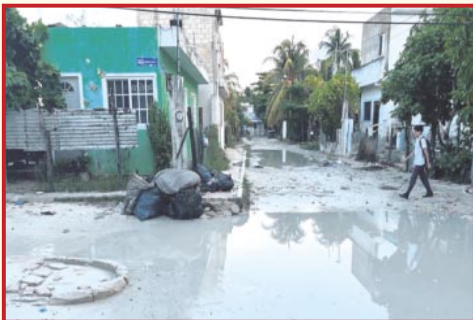
Después de las intensas lluvias, el dengue podría aumentar por acumulación de agua en Cancún.

Cancún.— Autoridades estatales de salud, advierten que en los próximos días y principalmente en zonas de Cancún donde los encharcamientos por la lluvia se mantienen, podrían presentarse nuevos casos de dengue, por lo que piden tomar precauciones.