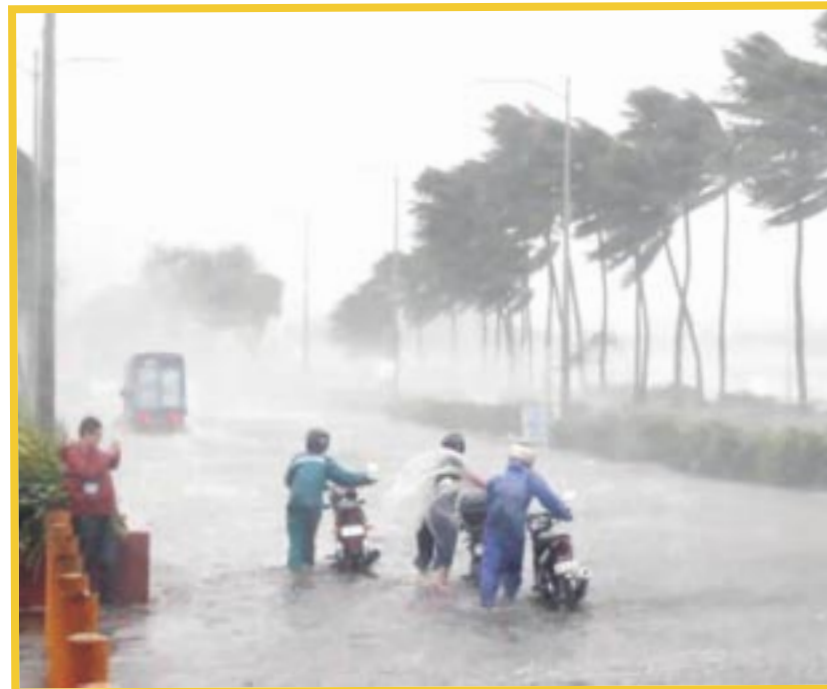
El segundo ciclón de la temporada se ha desarrollado y podría representar nueva amenaza para el Caribe mexicano.