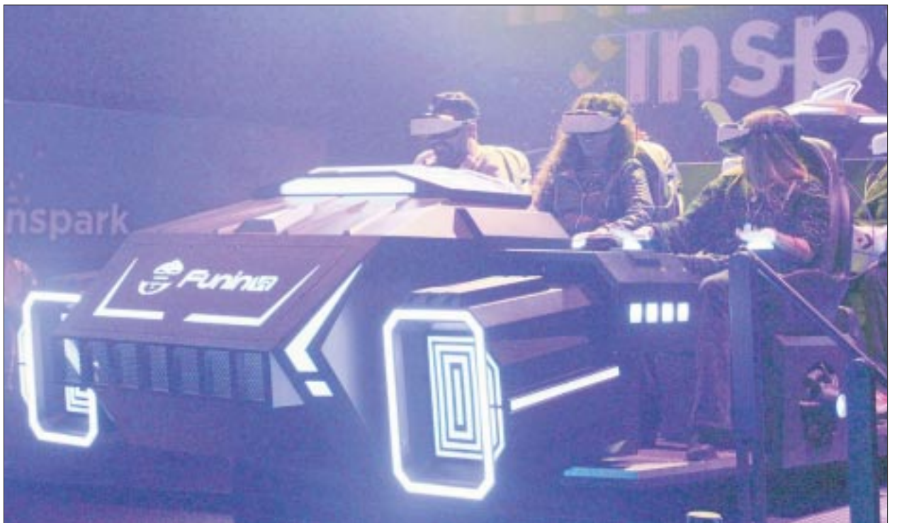
Inspark Camp es un nombre en siglas que significa Instituto de Programación de Adaptabilidad Reactiva y Kinestésic.

En la temática de Inspark desde que entras aceptas el compromiso de jugar por México, debes estar listo para este entrenamiento y ser el mejor venciendo los retos de estas actividades. Con cada juego podrás ir sumando puntos