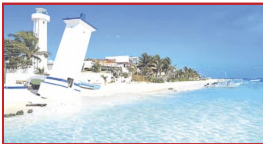
Los World Travel Awards (WTA) entregaron a Puerto Morelos el reconocimiento como destino líder en turismo de aventura de México.

Y es que, Puerto Morelos se ha convertido en referente turístico en las principales ferias de promoción a las que asiste, gracias a la vasta oferta de atractivos y a los distintivos obtenidos, entre ellos el de destino líder en turismo de aventura y las dos playas “Blue Flag” con las que cuenta: Ventana al Mar y Playa Sol.