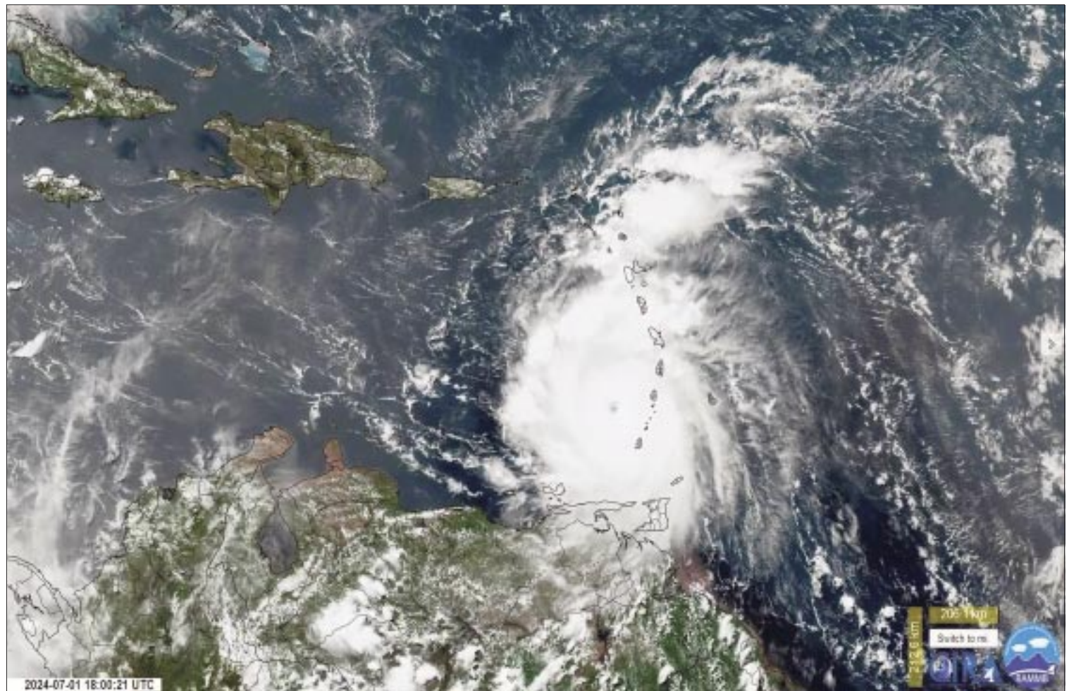
El huracán “Beryl” escaló en pocas horas para convertirse en un fenómeno de categoría 5 en la escala Saffir-Simpson.

En este caso, la gobernadora de Quintana Roo, Mara Lezama, aseguró que las dependencias estatales están en vigilancia cons-