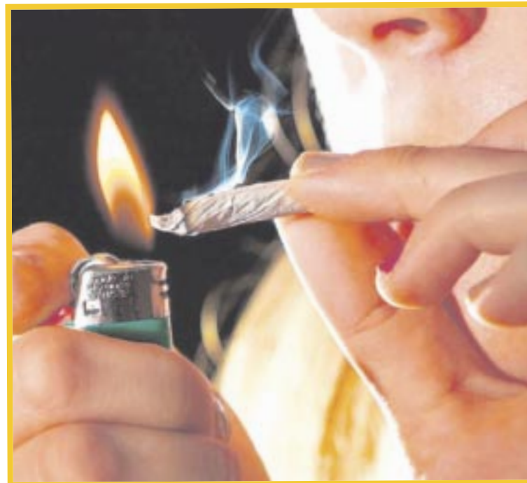
Alcohol y la marihuana se han convertido el punto de partida para que los jóvenes desarrollen adicciones más graves.

Y compartió que hay una convocatoria abierta para el concurso nacional “Tumbando Letras 2024”. Los jóvenes de 12 a 29 años de edad con talento musical están invitados a crear una canción, presentarla en video, que transmita mensajes positivos a otros jóvenes, “es para contrarrestar toda esa ola de música de corridos tumbados que invitan a una cuestión de violencia, a vivir esta situación de consumo, de normalizar todo este tipo de situaciones”, aseveró.