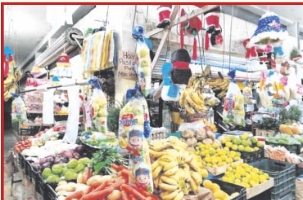
La Canaco-Servytur asegura que el abasto de insumos y mercancías está garantizado en Chetumal.

Chetumal.- La Cámara Nacional de Comercio, Servicios y Turismo (Canaco-Servytur) asegura que el abasto de insumos y mercancías está garantizado en la capital del estado, previo al impacto del huracán Beryl en la entidad, por lo que las “compras de pánico” realizadas por algunos ciudadanos, son completamente innecesarias.