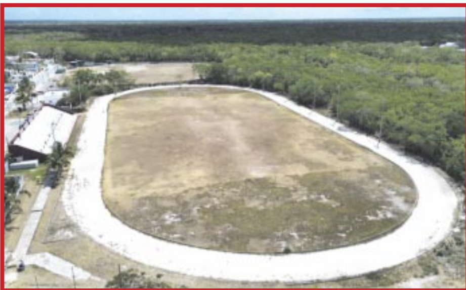
Llevar a cabo trabajos para la rehabilitación de la cancha de fútbol soccer de la Unidad Deportiva Revolución en Cozumel.