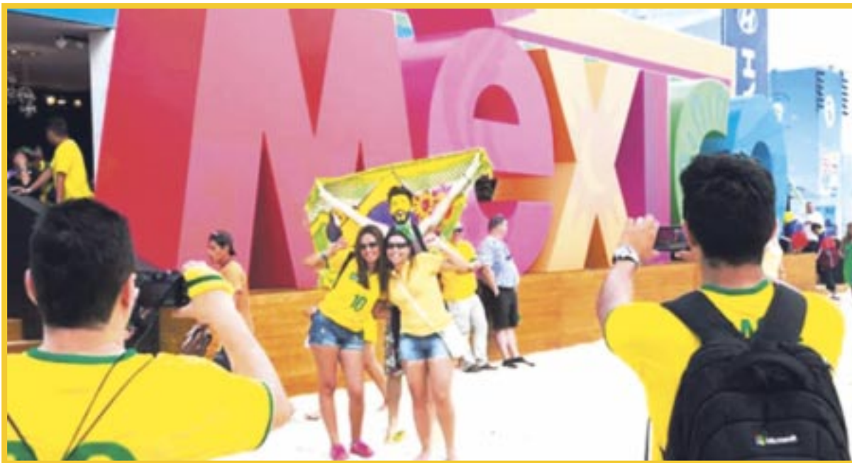
El CPTQ encabeza una comitiva que viajó a Brasil con el objetivo de recuperar el mercado de este país.