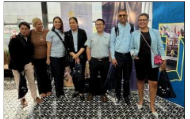
Fuerza de ventas de la aerolínea.

guntar por el CityPass en Tampa Bay y en St. Pete Clearwater que brinda importantes descuentos y con el que puedes disfrutar distintas atracciones.