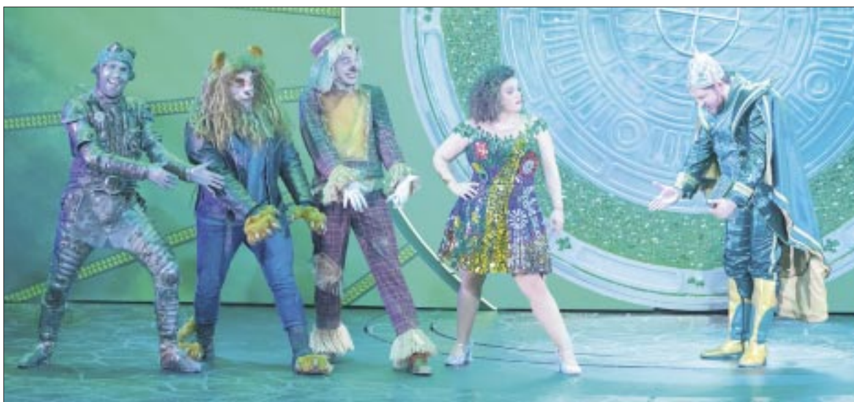
Luego de una primera exitosa temporada, la historia continuó por varios meses, gracias al compromiso y entrega de 22 actores en escena.