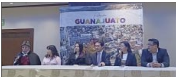
En la presentación de Soltero Fest 2024.

victoriagprado@gmail.com X: @victoriagprado