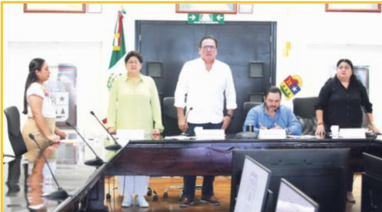
La Comisión Permanente de la XVII Legislatura turnó a comisiones para su análisis una iniciativa de reforma a la Ley de Educación del Estado en materia de salud alimentaria en las escuelas.

Con esta medida legislativa se busca transformar los entornos alimentarios de las escuelas para un futuro saludable de las niñas, niños y adolescentes, toda vez que las escuelas brindan una oportunidad única para fomentar la buena nutrición y el desarrollo adecuado entre las y los estudiantes.