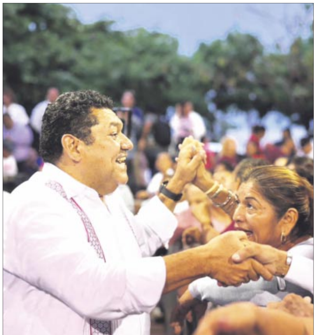
Javier May fue el gobernador más votado, de los nueve morenistas ganadores, con un porcentaje del 80 por ciento de los sufragios