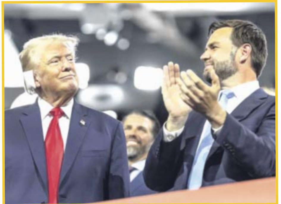
El candidato presidencial republicano Donald Trump, eligió al senador de Ohio, J.D. Vance, como su vicepresidente.

Vance fue firme opositor republicano a Donald Trump en 2016. Entonces, calificó a Trump de "peligroso" e "incapaz" para el cargo. También criticó la retórica aparentemente racista del veterano político, diciendo que podría ser "el Hitler de América". Sin embargo, cuando Vance se reunió con el magnate en 2021, había cambiado de opinión. Ambos hombres restaron importancia a las mordaces críticas de Vance en el pasado. Una vez elegido, el senador de Ohio se convirtió en un firme aliado de Trump En el Capitolio, defendiendo incesantemente las políticas y el comportamiento del expresidente.