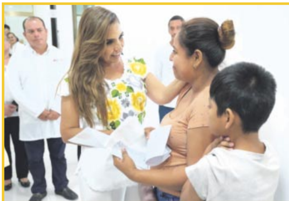
Mara Lezama Espinosa visitó las instalaciones del Hospital IMSS Bienestar Nicolás Bravo en el municipio Othón P. Blanco.

Durante el recorrido por el hospital, la gobernadora de Quintana Roo observó la dinámica en el módulo de registro al IMSS Bienestar, donde se han afiliado 420 personas desde marzo pasado; es gente que no cuenta con otro servicio de salud y ahora tiene derecho al IMSS Bienestar.