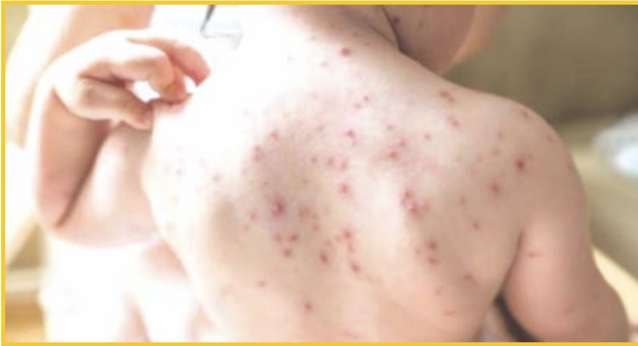
El Sistema Nacional de Vigilancia Epidemiológica revela que los casos de varicela han aumentado un 48% en Quintana Roo.

Los municipios quintanarroenses con mayor número de contagios reportados este año son Benito Juárez que reportó 330 casos; Solidaridad (Playa del Carmen) cuenta con 90; Othón P Blanco (Chetumal), 40 y Felipe Carrillo Puerto 23, el resto de las demarcaciones tiene menos de 20 casos.