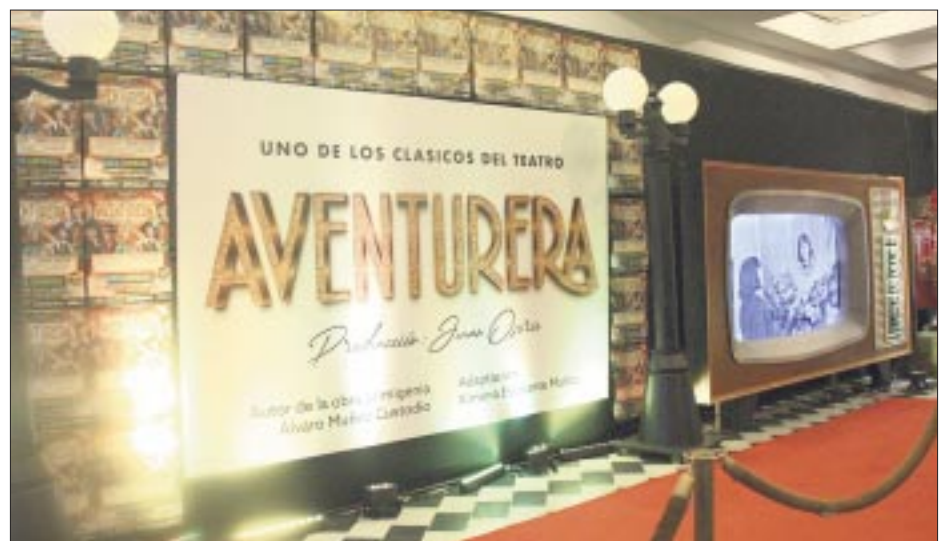
Aventurera se presenta en El Salón Los Ángeles (Lerdo 206, colonia Guerrero), con funciones los jueves y viernes.