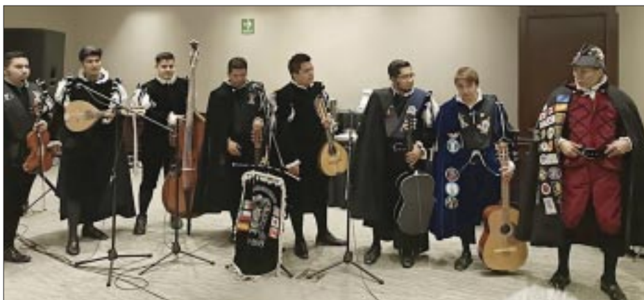
La estudiantina estuvo presente en el anuncio del festival.