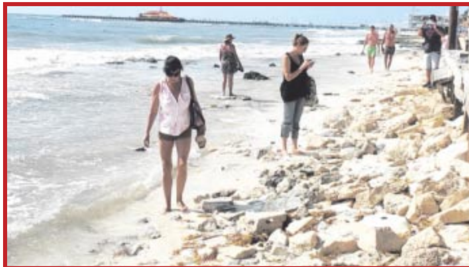
El sector hotelero solicitó la elaboración de un nuevo proyecto de recuperación y mantenimiento de playas en la zona norte del estado.

Indicaron que el proyecto permitirá conocer la situación actual y los recursos que se requieren, para recuperar el principal atractivo turístico del Caribe mexicano, que ha sido seriamente afectado “hablamos de 400 millones de pesos, aunque habría que esperar el presupuesto que presente la empresa, y la ventaja es que ellos ya cuentan con equipos y no nos costaría traer los equipos desde otras partes del mundo hasta acá”, dijo.