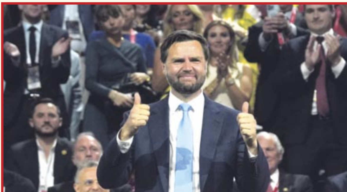
El senador J.D. Vance, candidato del Partido Republicano a la Vicepresidencia de EU, es un "clon" de Trump, dice Joe Biden.

El presidente de Estados Unidos, Joe Biden, afirmó este martes que el senador J.D. Vance, candidato del Partido Republicano a la Vicepresidencia, es un "clon" del ex mandatario y candidato republicano Donald Trump en muchos temas.