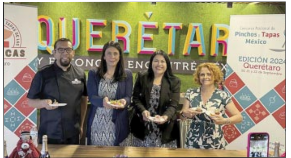
Presentan dos interesantes concursos a realizarse en la ciudad de Querétaro.

Es importante destacar que se contará con un jurado integrado por reconocidos chefs y figuras de la gastronomía nacional e internacional, como Mikel