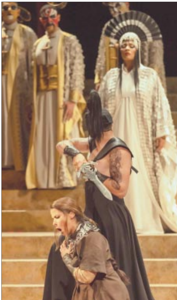
Tras este éxito, refiere “Regresaré a Europa, en la segunda parte de este año y tengo próximamente una gira de conciertos con Ramón Vargas.

cualquier tipo de voz, para las mujeres es muy competido sobre todo en soprano. Lo que si tiene que cambiar un poco es la medida de la demanda y como se maneja en el medio, por ejemplo, la edad, el aspecto físico y hasta el lugar donde vives, que tengas familia o no, esas cosas, es importante que se haga un cambio para que mujeres y hombres tengan las mismas oportunidades por habilidades y preparación y no por otros factores”.