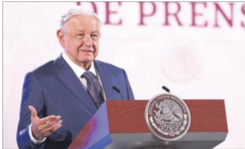
Andrés Manuel López Obrador reviró en su mañanera al coro de voces republicanas que culpan a los migrantes de todos los males que enfrenta Estados Unidos.

En caso de que los prestadores de servicios ferroviarios de pasajeros en su modalidad de regular interurbano y los permisionarios del servicio de autotransporte de pasajeros en los servicios de primera y económico no cumplan con el descuento para estudiantes y maestros, los usuarios podrán presentar sus quejas ante la Agencia Reguladora del Transporte Ferroviario (ARTF), y en caso del autotransporte ante la Dirección General de Autotransporte Federal, o para ambos casos, ante el Departamento de Autotransporte Federal del Centro SICT que corresponda al domicilio del usuario.