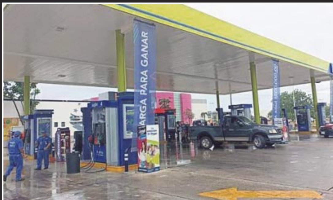
Automovilistas de Chetumal exhibieron a una gasolinera por despachar presuntamente combustible rebajado con agua.

A esto se añade que la mayoría de las ocasiones esto sucede principalmente después de lluvias intensas y aclaró que la Profeco comprueba que se cumpla con el pago a las personas, cuyos vehículos resultaron dañados por este tipo de situación.