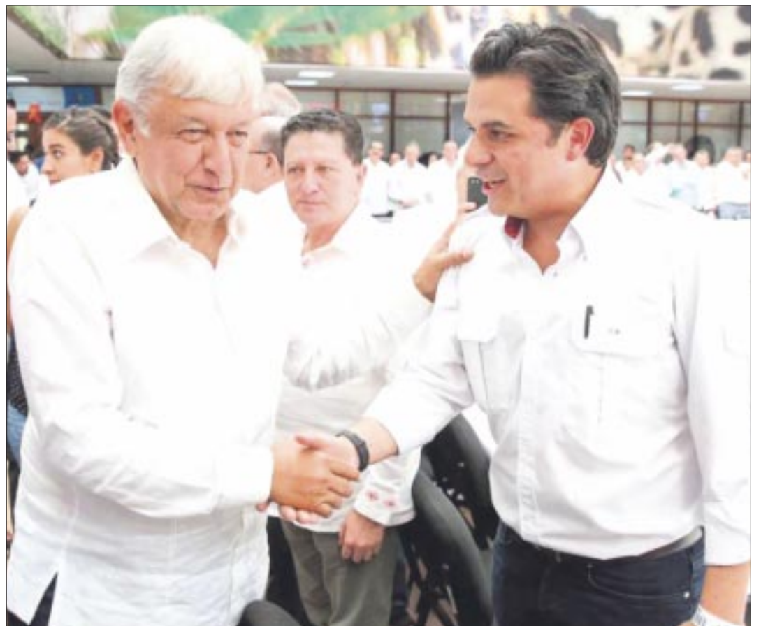
El presidente Andrés Manuel López Obrador expresó que Zoé Robledo debería seguir al frente del IMSS, lo que muchos interpretan como una orden a Claudia Sheinbaum.