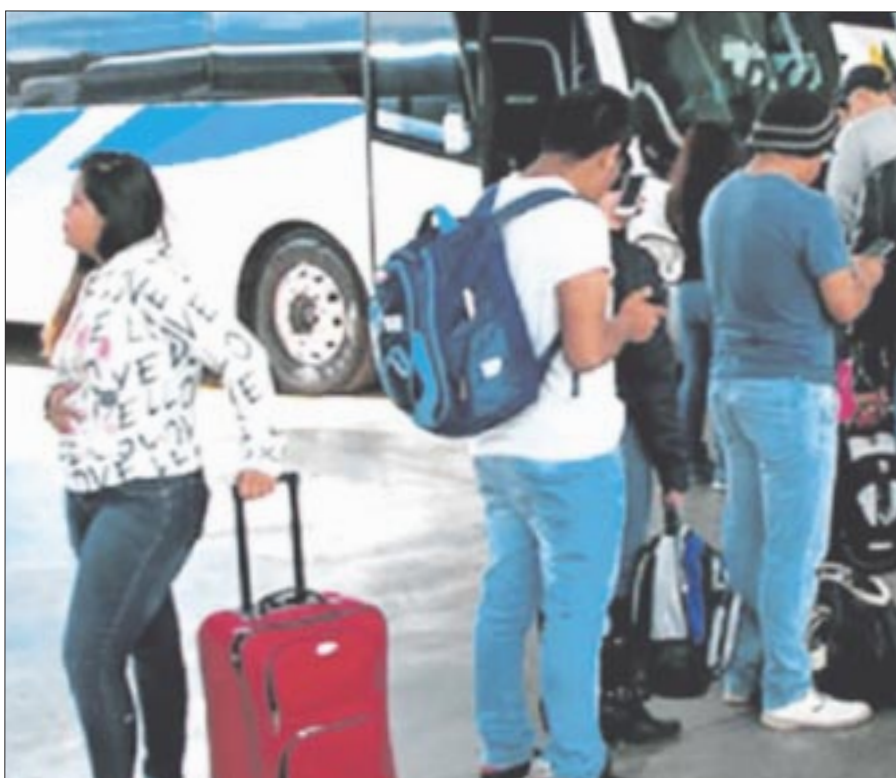
La Secretaría de Infraestructura, Comunicaciones y Transportes anunció descuentos para estudiantes y maestros que viajen en autobuses y servicio ferroviario en estas vacaciones.

El jefe del Ejecutivo federal remarcó que no puede dejar de difundir que los representantes del Poder Judicial no aceleran los procesos y se mantienen los adeudos a las finanzas públicas.