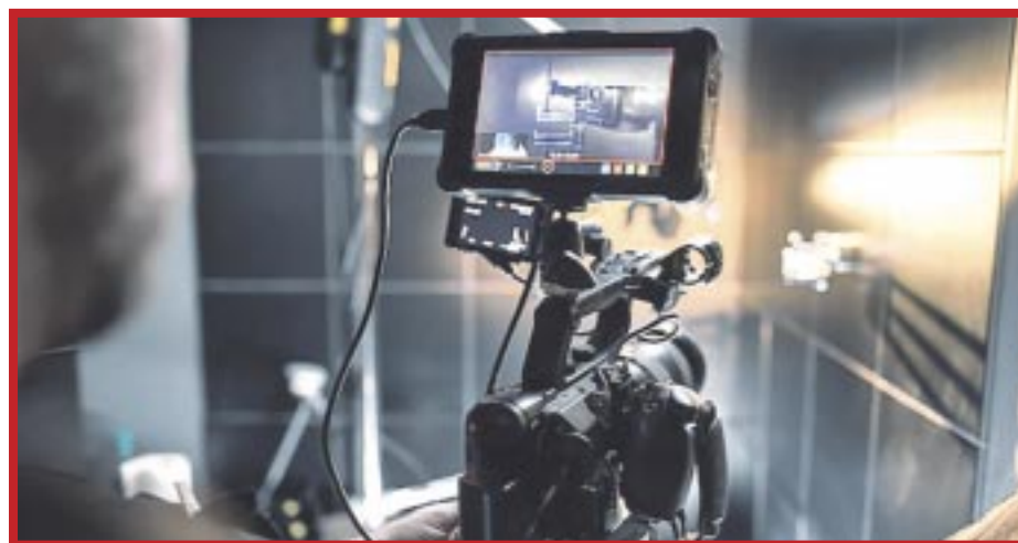
Entró en vigor el Reglamento del Comité Fílmico del municipio de Solidaridad.

Son 29 los artículos que conforman la presente reglamentación, que tienen las bases para poder actuar en cuanto a los proyectos cinematográficos que se pudieran dar en el municipio.