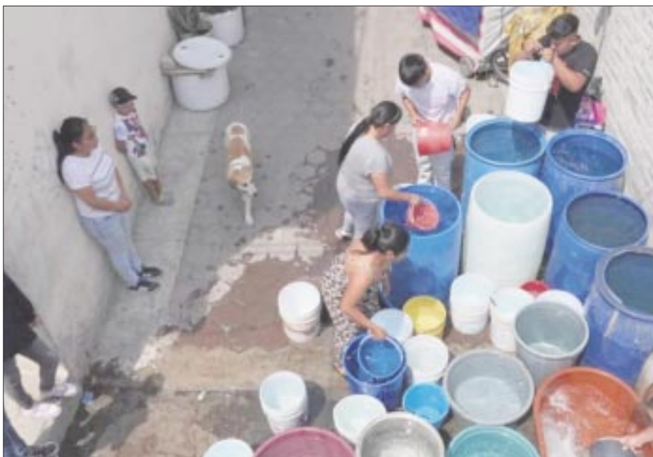
El crecimiento poblacional superó al desarrollo hídrico en CDMX, por lo que el abastecimiento disminuye en cantidad y calidad, a lo cual se suma la necesidad de incrementar la conservación de la infraestructura.

Los expertos coinciden en que para tratar el desabasto de agua en la Zona Metropolitana del Valle de México es necesaria una estrategia de largo plazo en la que se priorice la eficiencia en la gestión del agua. Y que contemple un cambio al modelo de desarrollo urbano.