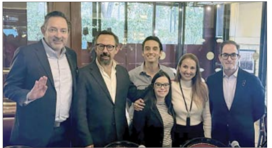
Después de la conferencia y firma de la alianza.

Together , Fundación de World Meetings Forum , realiza