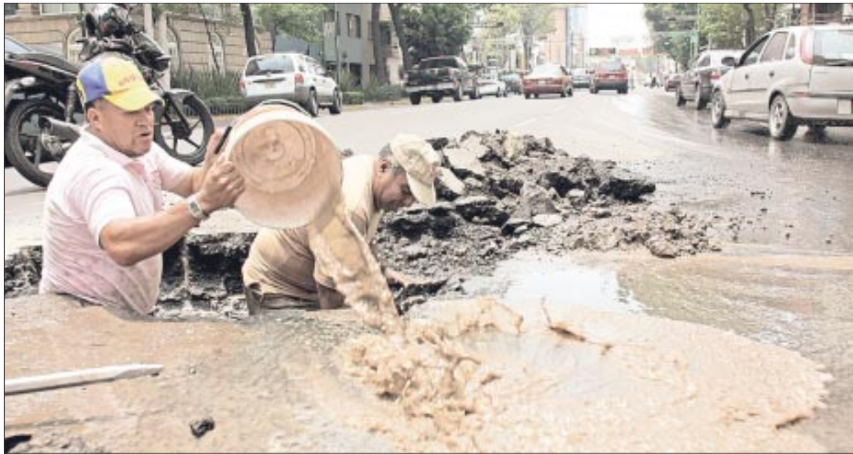
Se desperdicia casi el 50 por ciento del agua del abasto que llega del Sistema Cutzamala y del manto freático en la Ciudad de México por una red hidráulica obsoleta.

Otro factor, el crecimiento poblacional superó al desarrollo hídrico en CDMX, por lo que el abastecimiento disminuye en cantidad y calidad, a lo cual se suma la necesidad