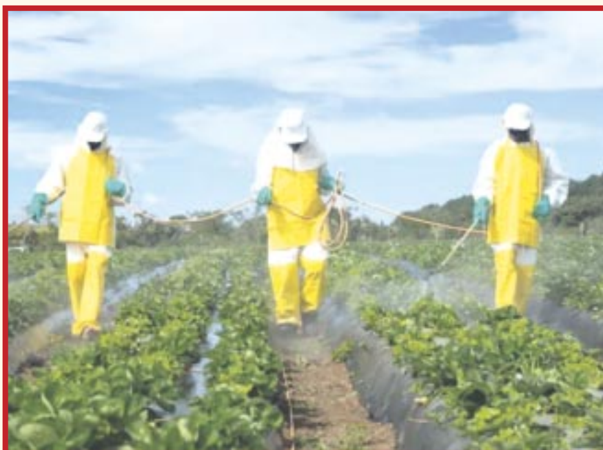
Campeños de la zona limítrofe de Quintana Roo con Campeche, exigen que se evite el uso de plaguicidas prohibidos.

Campeños de la zona limítrofe de Quintana Roo con Campeche, exigen la implementación de recorridos de verificación a fin de evitar que se usen plaguicidas prohibidos, que pueden tener efectos dañinos en la salud.