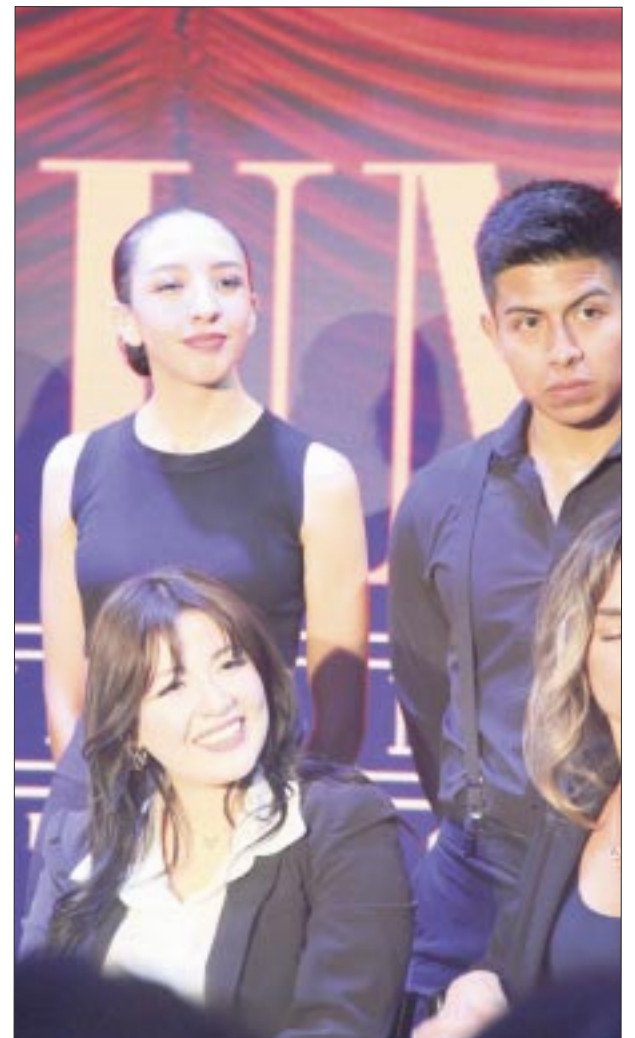
La obra estilo cabaret tendrá una compilación de música entre los años 50s y 80s. Esperan después hacer la versión original que es en Drag.