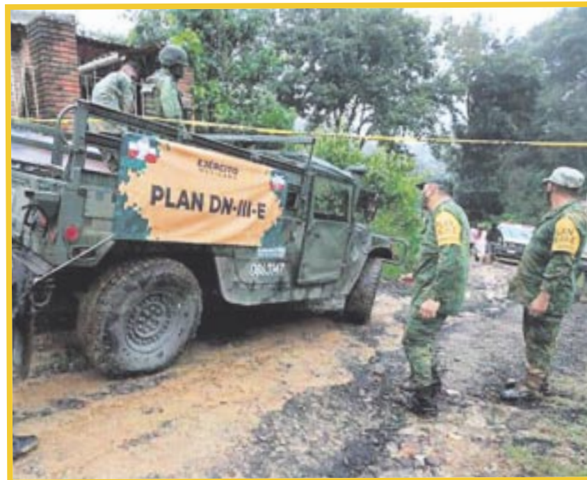
La Sedena se encarga de dar seguimiento a los ciclones tropicales, a fin de tomar acciones preventivas y evitar tragedias en nuestras costas.

Delgado Díaz explica que, con días de anticipación, los mandos territoriales están prevenidos, con personal, maquinaria e insumos para apoyar a la población civil en cada lugar donde va a afectar un sistema tropical, “Nosotros estamos preparados con mucha anticipación, es lo que nos ha dejado el paso de cada uno de los sistemas tropicales”.