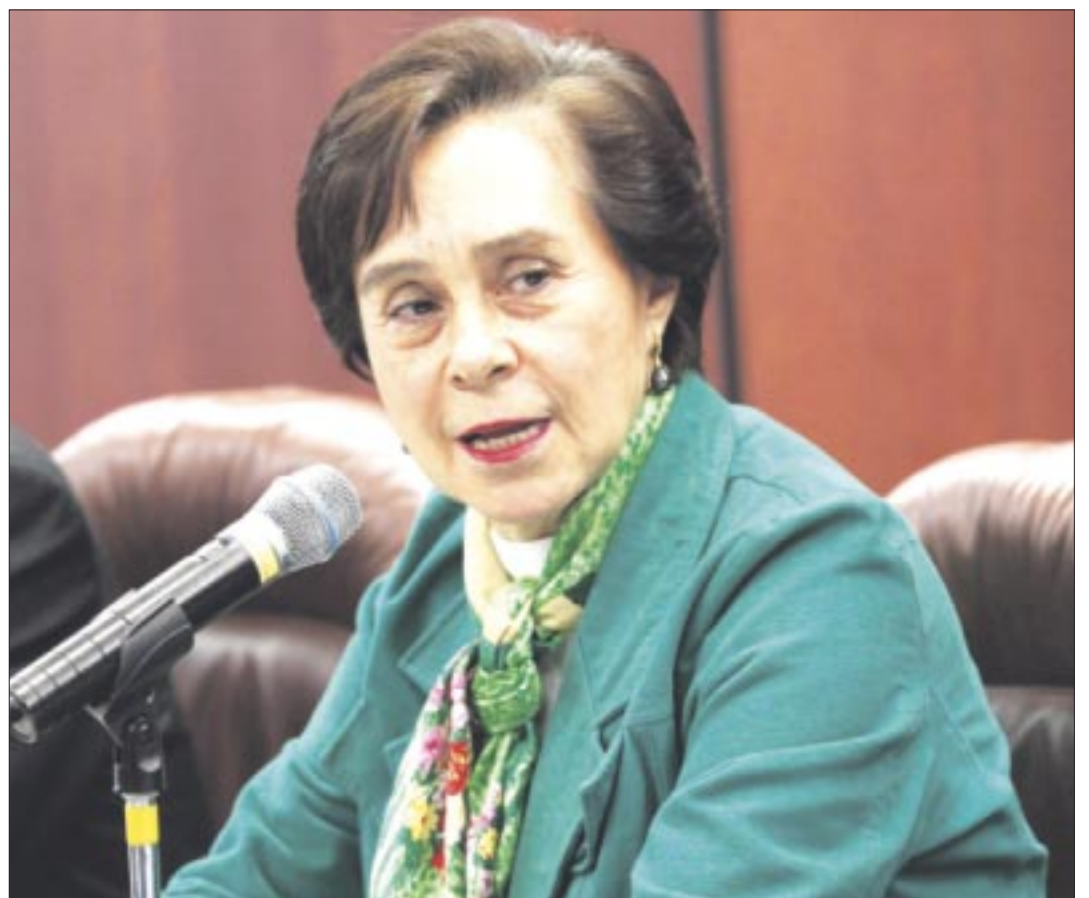
María de los Ángeles Moreno fue la primera mujer que presidió el PRI, 65 años después de ser fundado