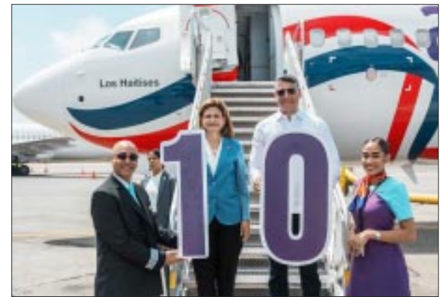
Arajet recibe décima aeronave.

☆☆☆☆☆ Tras su éxito mundial, el Foro, que organiza anualmente ONU Turismo y el Basque Culinary Center , miembro afiliado, va a estrenarse a escala regional. El anfitrión será el gobierno de Filipinas, que acogerá la edición inaugural de este primer foro a nivel regional que aspira a convertirse en un punto de encuentro entre los expertos y los estados miembros