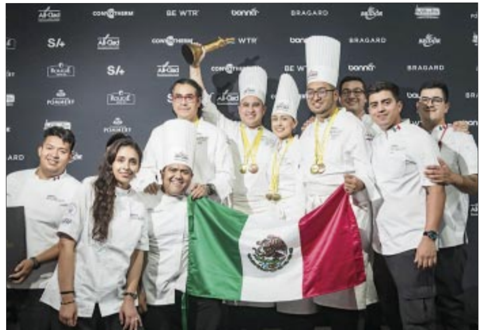
México gana el tercer lugar en el Bocuse d'Or Américas .

Agregó que “el sueño de convertir a República Dominicana en el nuevo hub del continente es una realidad de la mano de los más de 400 colaboradores directos que tenemos; trabajo que ha sido reconocido internacionalmente cuando en 2023 nos premiaron como la mejor nueva aerolínea del mundo en la cumbre mundial de aviación, y eso debe llenarnos de orgullo a todos los dominicanos.