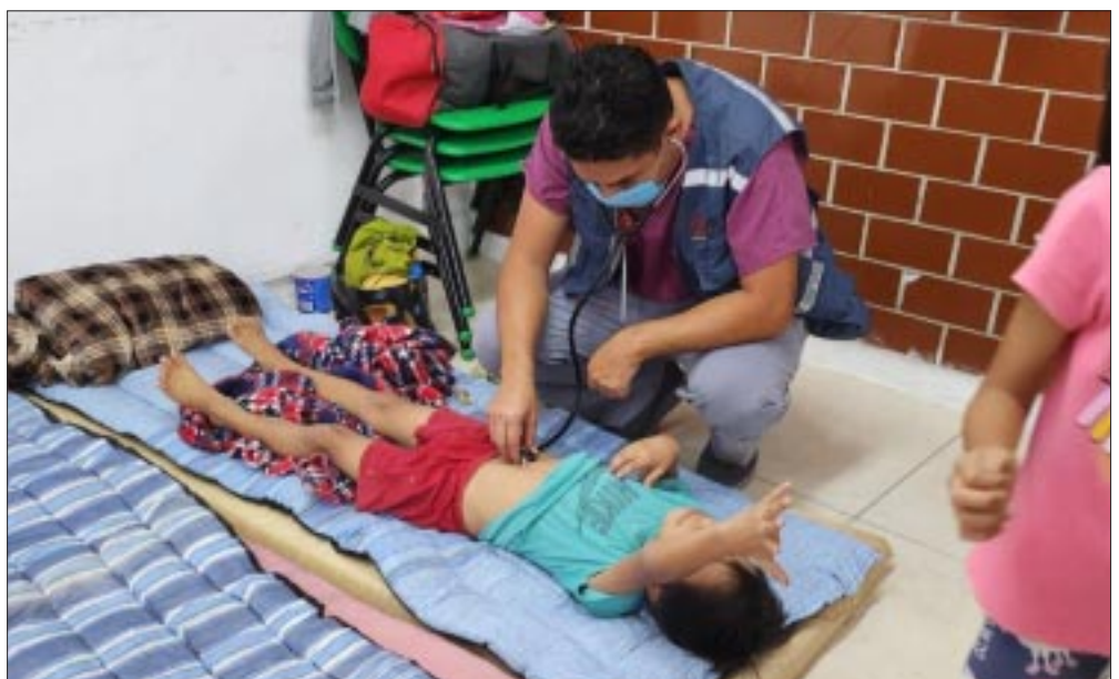
Ante la fuertes lluvias registrada en Chetumal, activaron una brigada de atención integral en el albergue temporal, que acogió a 31 personas pertenecientes a 10 familias afectadas.

El enfoque integral y sensible en la atención a personas vulnerables en contextos de crisis es muy importante en situaciones como la registrada en la capital del estado.