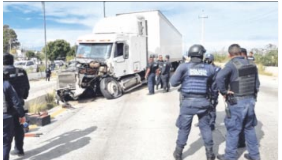
La creciente ola de violencia en las carreteras de México está llevando a muchos operadores de transporte de carga a buscar trabajo en Estados Unidos.

El presidente Andrés Manuel López Obrador ha insistido durante su sexenio en la promoción del acceso a internet de forma universal y gratuita con proyectos como ‘Internet para Todos’, compromiso que no acaba de cristalizar a unos meses de acabar su mandato.