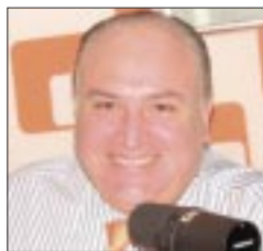
Por Víctor Sánchez Baños