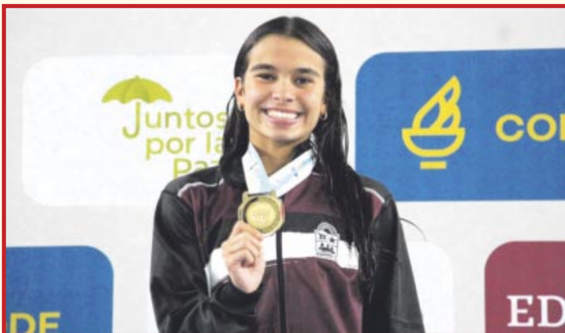
Nadadores de Quintana Roo conquistaron un total de nueve preseas (dosoros, dos platas y cinco bronce), en la cuarta jornada de o que representó que la entidad llegue a la cifra de 227 metales en el medallero general de la justa.

Guadalajara.- El cuarto día de actividades en la natación de los Nacionales Conade 2024 fue muy productiva para la delegación de Quintana Roo, que conquistó un total de nueve preseas (dosoros, dos platas y cinco bronce), lo que representó que la entidad llegue a la cifra de 227 metales en el medallero general de la justa, donde aparece como el cuarto mejor estado de la justa.