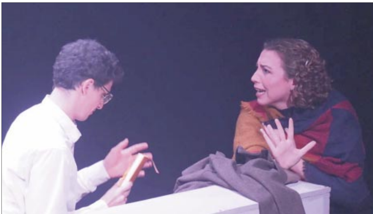
“Incógnito” se presenta en el Foro Shakespeare, con funciones todos los viernes hasta el 5 de julio.

La obra Incógnito se presenta los viernes a las 19:30 horas, con una duración aproximada 120 minutos, clasificada para mayores de 12 años. Los boletos están a la venta en la taquilla del teatro o en la pagina www.boletos.shakespeareycia.com .