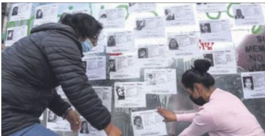
La Oficina en México del Alto Comisionado de las Naciones Unidas para los Derechos Humanos señaló que cada desaparición impacta profundamente a las familias.

“Identificamos una necesidad de hacer una necesidad de divulgación permanente de las características que deben observar los pacientes”. Ante esta situación, recomendó a la población adquirir los medicamentos en los lugares legalmente establecidos que son las farmacias, ya que si se adquieren en otros lugares como tanguis (mercados), son medicamentos que lo único que pueden provocar son daños