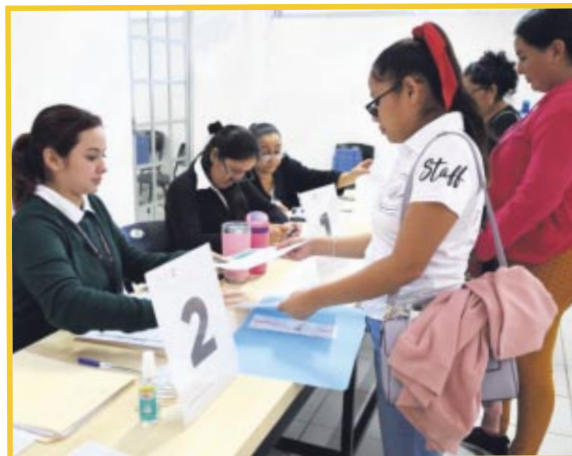
Anuncian el pago de becas del segundo periodo del Ciclo Escolar 2023-2024 de los niveles Especial, Preescolar, Primaria, Secundaria, Medio Superior y Superior.

Sin excepción, el cobro de la beca solo podrá ser otorgado mediante la orden de pago entregada en la fecha, lugar y horario establecido por el Comité; así como el pago que efectúe el banco, ya que es la única institución acreditada para hacerlo y sin opción para hacerlo por otro medio.