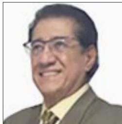
Por Salvador Martínez García*

asorianocarrasco@yahoo.com www.revistabrecha.com @BrechaRevista