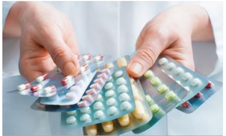
La Asociación Mexicana de Industrias de Investigación Farmacéutica advirtió sobre el creciente peligro que representan los medicamentos “chatarra” en México

Ahí, el representante del Alto Comisionado dijo que es un día muy significativo en México, “pero también es un llamado al conjunto de la sociedad a tener presentes también a aquellos padres que han desaparecido, aquellos padres que buscan a sus hijo e hijas. Es un llamado sin lugar a duda a la sociedad a resignificación este día mostrando empatía por este llamado al que nos unimos por la búsqueda, la justicia, por las garantías de no repetición”.