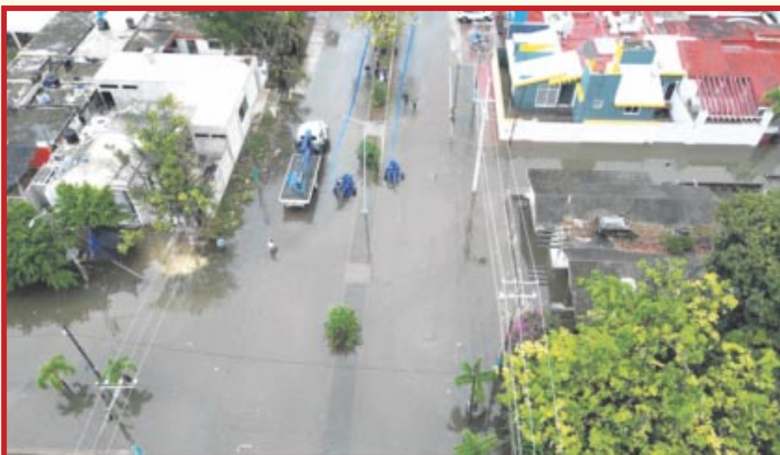
Ponen en marcha un operativo de vuelos con dron para realizar una evaluación precisa de las zonas afectadas por las lluvias.

Chetumal.- La Secretaría de Finanzas y Planeación (Sefiplan) de Quintana Roo, a través del Instituto Geográfico y Catastral del Estado (IGECE), realiza vuelos con dron para actualizar los reportes de afectaciones por las pasadas lluvias atípicas en las colonias de Chetumal y facilitar la toma de decisiones para su atención.