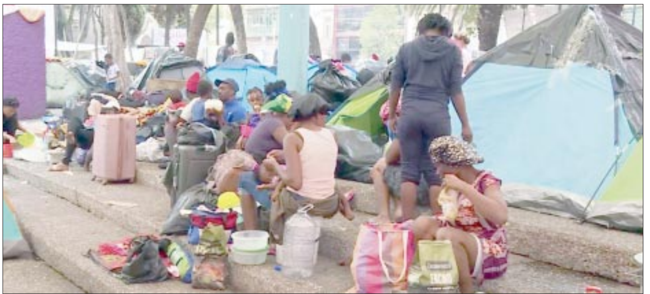
El Instituto Nacional de Migración (INM) ubicó entre enero y mayo de 2024 a 1 millón 393 mil 683 personas extranjeras que viajaban por el país en condición irregular provenientes de 177 países de los cinco continentes.

El INM trabaja y se conduce con apego a las le-