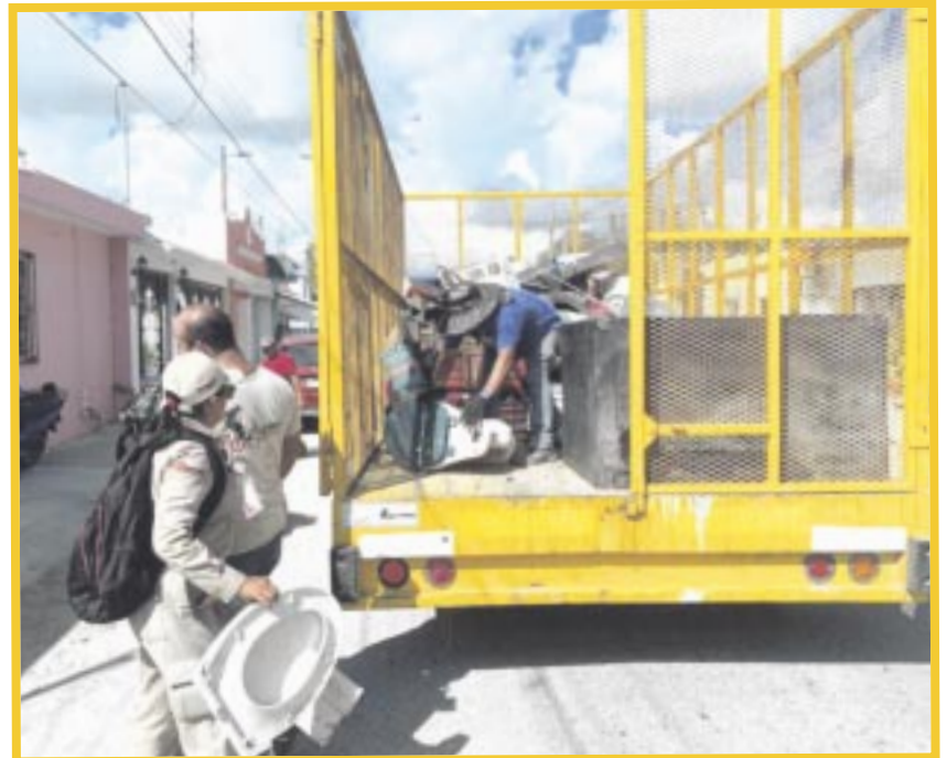
La estrategia contra el dengue se extiende a las ciudades y comunidades que presentan condiciones para la presencia de moscos o casos probables.

Tapar recipientes que almacenan agua, voltear objetos como cubetas que no se utilicen, lavar y cambiar el agua de floreros y bebederos de las mascotas y recolectar los recipientes inservibles como botellas y latas para depositarlos en bolsas y que se los lleve el servicio de recoja de basura, son medidas preventivas relevantes en el combate a la presencia de moscos.