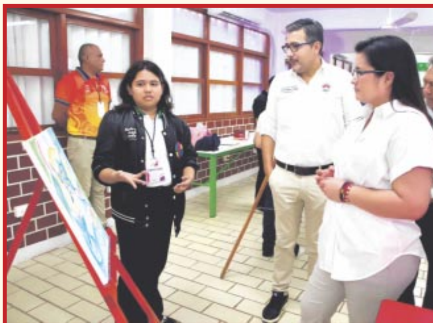
Realizó el Cecyte Quintana Roo el XII Festival Estatal de Arte y Cultura y el XI Concurso de Escoltas de Bandera Nacional 2024.

Cancún.- Con el objetivo de fortalecer la formación de valores, costumbres y tradiciones orientadas a mejorar la calidad de vida de los alumnos, el Colegio de Estudios Científicos y Tecnológicos del Estado de Quintana Roo (Cecyteqroo), realizó el XII Festival Estatal de Arte y Cultura y el XI Concurso de Escoltas de Bandera Nacional 2024 con la participación de cerca de 400 estudiantes de los nueve planteles.