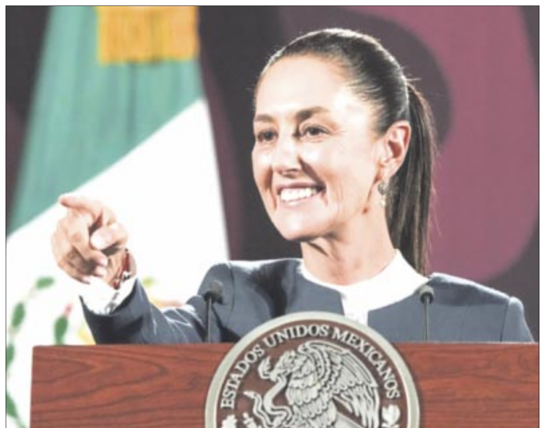
Los ataques en contra de Claudia Sheinbaum fueron múltiples, ninguno de ellos logró la pe-

ramonzurita44@gmail.com ramonzurita44@hotmail.com