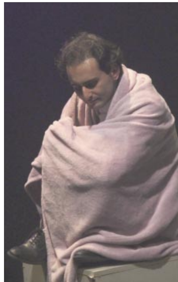
Una obra que te hará pensar, mientras te cuentan las historias y casi coreográficamente van cambiando de pequeños escenarios y personajes.