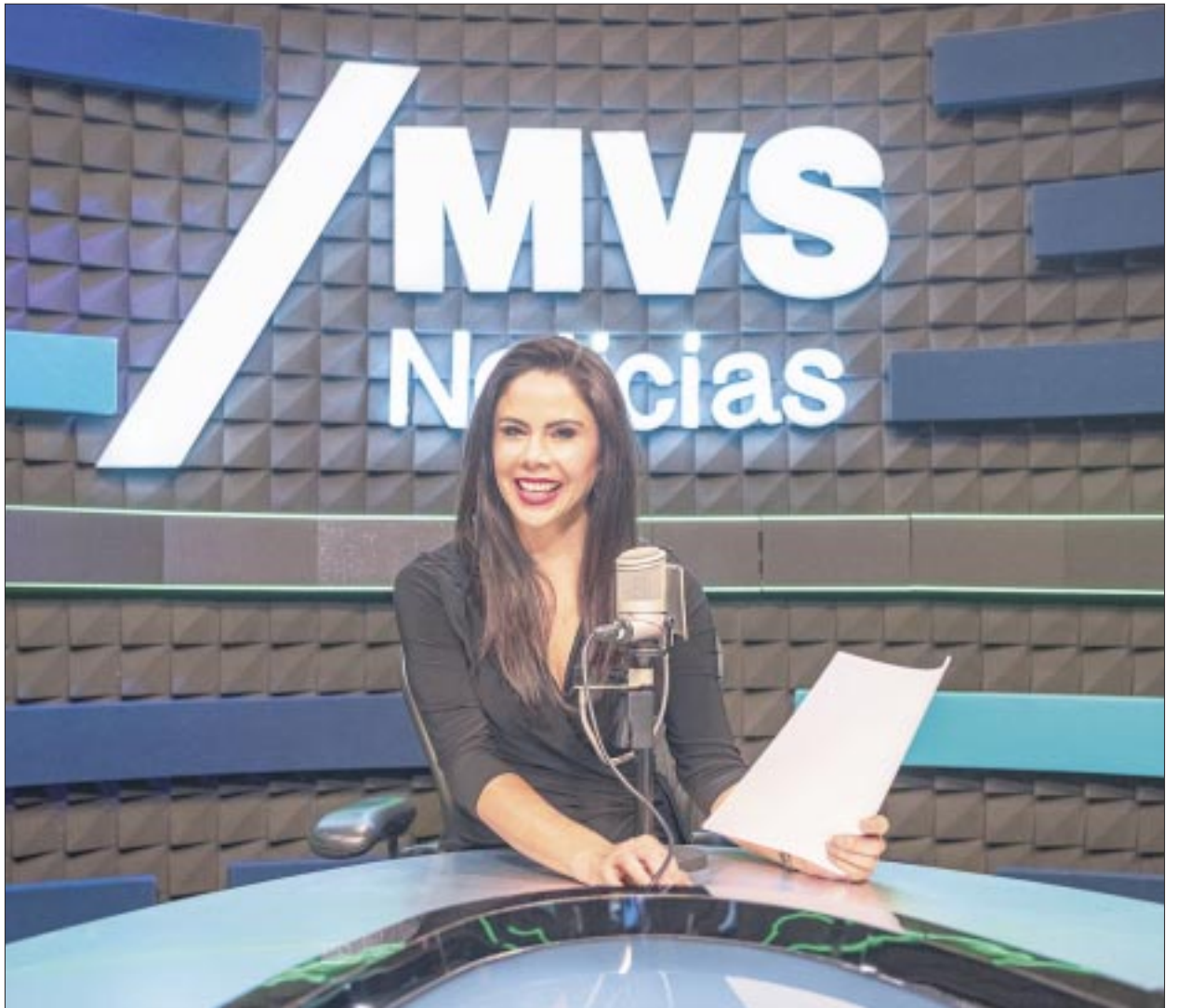
Con este espacio se marca el regreso de Paola Rojas a la radio.

Paola Rojas es una periodista mexicana con más de 25 años de carrera en los medios de comunicación. En su paso por empresas de la talla de Radio 13,