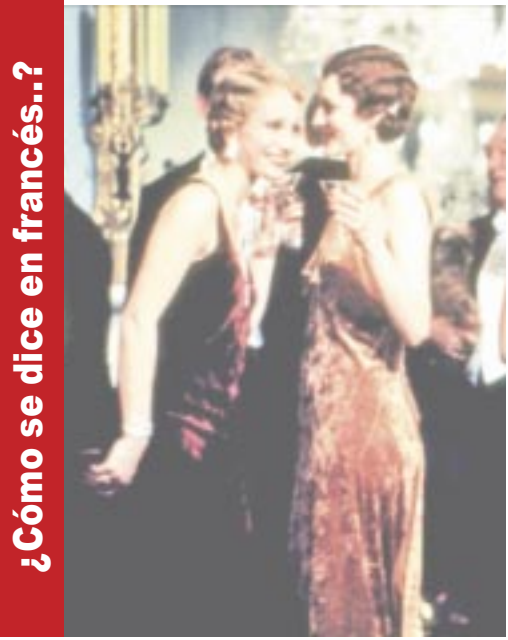
¿Cómo se dice en francés...?