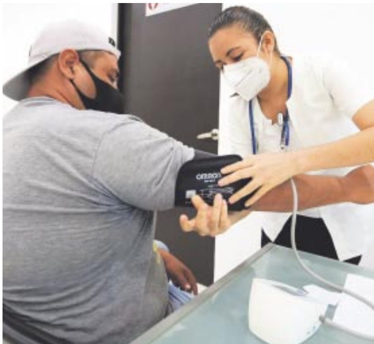
Sesa reportó el registro de los primeros casos de probable dengue en Playa del Carmen.

aumento significativo de los casos”, aseveró.