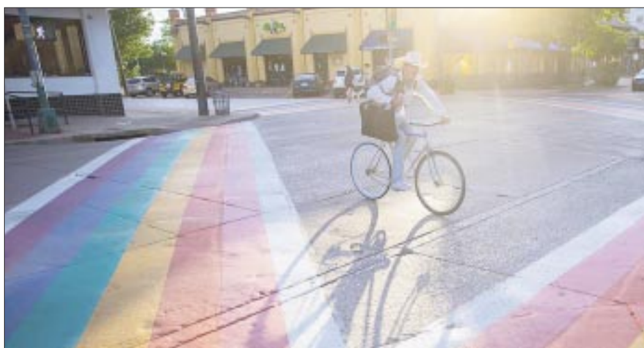
La comunidad LGBTTTIQ+ en Dallas una de las más grandes de Estados Unidos.

victoriagprado@gmail.com X: @victoriagprado