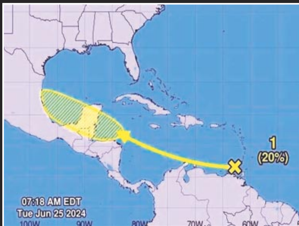
El Centro Nacional de Huracanes de Miami, Florida, adelantó que una nueva onda tropical se mueve hacia el Caribe mexicano.

En este marco, la recomendación sigue siendo que la población se mantenga atenta a los avisos de Protección Civil y tomar las precauciones necesarias. Si necesitas más detalles, no dudes en preguntar a las autoridades correspondientes.