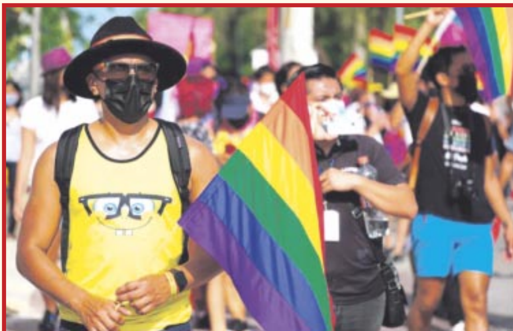
La nueva fecha para la celebración será el 6 de julio del 2024, con el objetivo de salvaguardar la integridad física de los asistentes.

Cancún.- Los organizadores de la Marcha Cancún Pride 2024 han decidido posponer el evento que estaba programado para el 22 de junio, y es que, consideran que debido a la situación meteorológica adversa que se presenta actualmente, no es posible tener una celebración de manera segura para todos los asistentes.