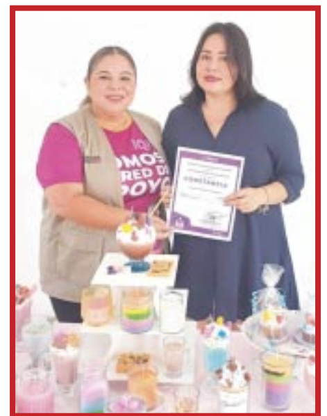
El Instituto Quintanarroense de la Mujer (IQM), realizó la clausura del curso de capacitación en “Elaboración de Velas Aromáticas”, en el que participaron mujeres de la colonia Payo Obispo.

este curso, en donde destacó que el IQM continúa avanzando con el Programa de Capacitación para Mujeres en Colonias, con esta capacitación las participantes aprenden a crear sus propias velas decorativas y técnicas artesanales que transforman su ambiente y decoración.