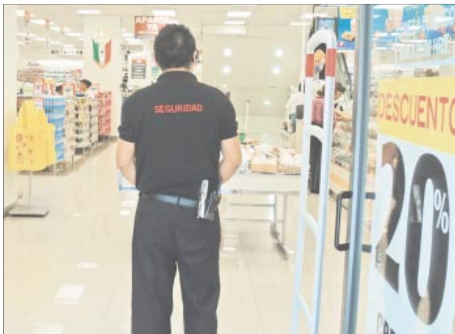
Una empresa mediana gasta, en promedio, 360 mil pesos al mes en contratación de seguridad privada, custodia de traslado de mercancías y sistema de circuito cerrado.

Las entidades con mayor número de reportes fueron: Baja California con 365, en segundo lugar está Quintana Roo, con 348 y después Aguascalientes, con 324.