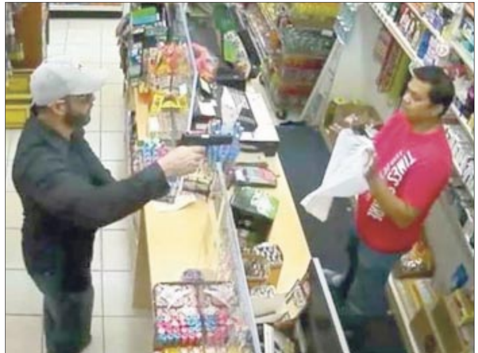
La inseguridad en México ha provocado que el costo por robo o asalto de algún negocio vaya en incremento, por lo que puede llegar hasta los 95 mil pesos por evento, como en la CDMX.

Usar las tecnologías es una inversión de bajo costo para las empresas si se considera que pueden perder cargas con valores