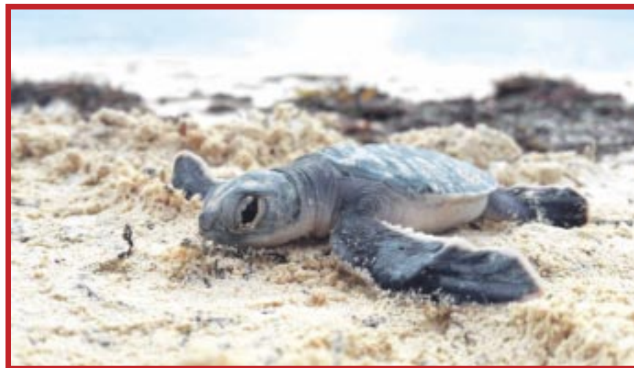
El 90 por ciento de los hoteles en la costa de Quintana Roo afectan la anidación de tortugas.

Concluye que México es afortunado de poder recibir en sus playas 6 de las 7 especies que existen en el mundo, por lo que cada pequeña acción, puede marcar una diferencia significativa en la protección de esta especie.