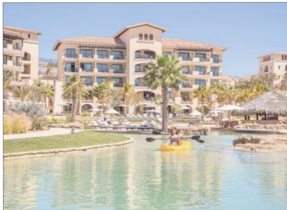
Grand Solmar Pacific Dunes.

Con tantas ventajas para los ciudadanos y visitantes LGBTTTIQ+, no es de extrañar que la comunidad siga prosperando y siendo ejemplo para las ciudades de todo el mundo.