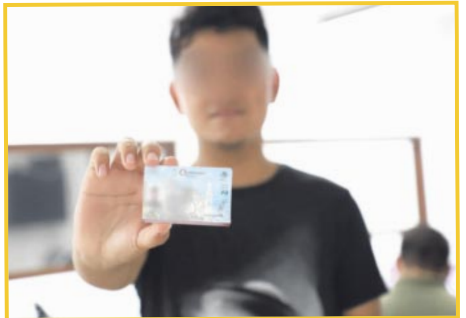
Menores de edad que deseen conducir un vehículo en Quintana Roo podrán realizar el trámite de su permiso ante módulos del Imoveqroo.

Mencionó que, además de la solicitud, figuran los siguientes requisitos para realizar el trámite: Acta de nacimiento del menor; Identificación del menor, puede ser credencial escolar, que cuente con fotografía; CURP del menor; INE del padre, madre o tutor; Certificado de manejo del menor; Examen de la vista del menor; Comprobante de domicilio menor a 3 meses y hacer el pago correspondiente con cualquier tarjeta, de manera directa en los módulos, o en línea en la página web del instituto.