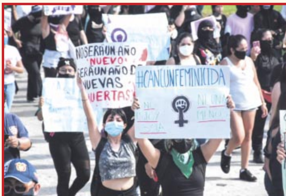
La colectiva “Marea Verde de Quintana Roo” difundió su convocatoria separatista en Chetumal.

Chetumal.- La colectiva “Marea Verde de Quintana Roo” difundió su convocatoria separatista en Chetumal, la cita es a las 17:30 horas del próximo viernes 8 de marzo, el punto de reunión es el Museo de la Cultura Maya, asimismo piden llevar carteles y pancartas.