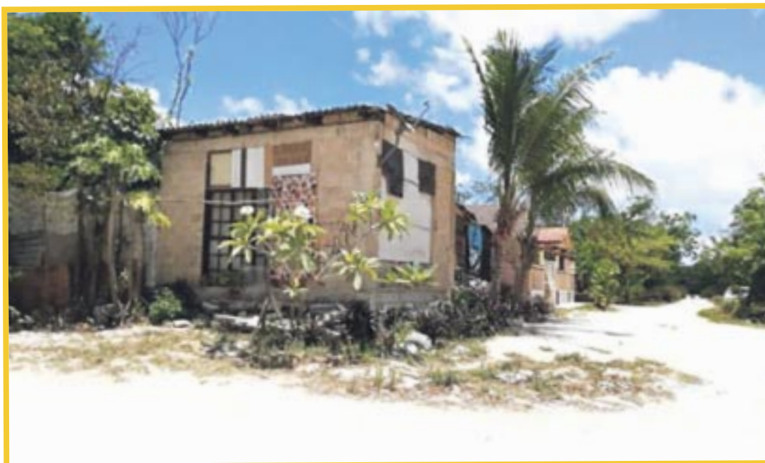
Centinelas del Agua A.C., confirmó que por lo menos 4 mil familias en Playa del Carmen no están conectadas al drenaje.

Además de revisar los asentamientos ya existentes, dijo necesario que los nuevos desarrollos cumplan con las especificaciones ambientales “sobre todo en ciudades como Tulum, donde se está dando un crecimiento acelerado” añadió.