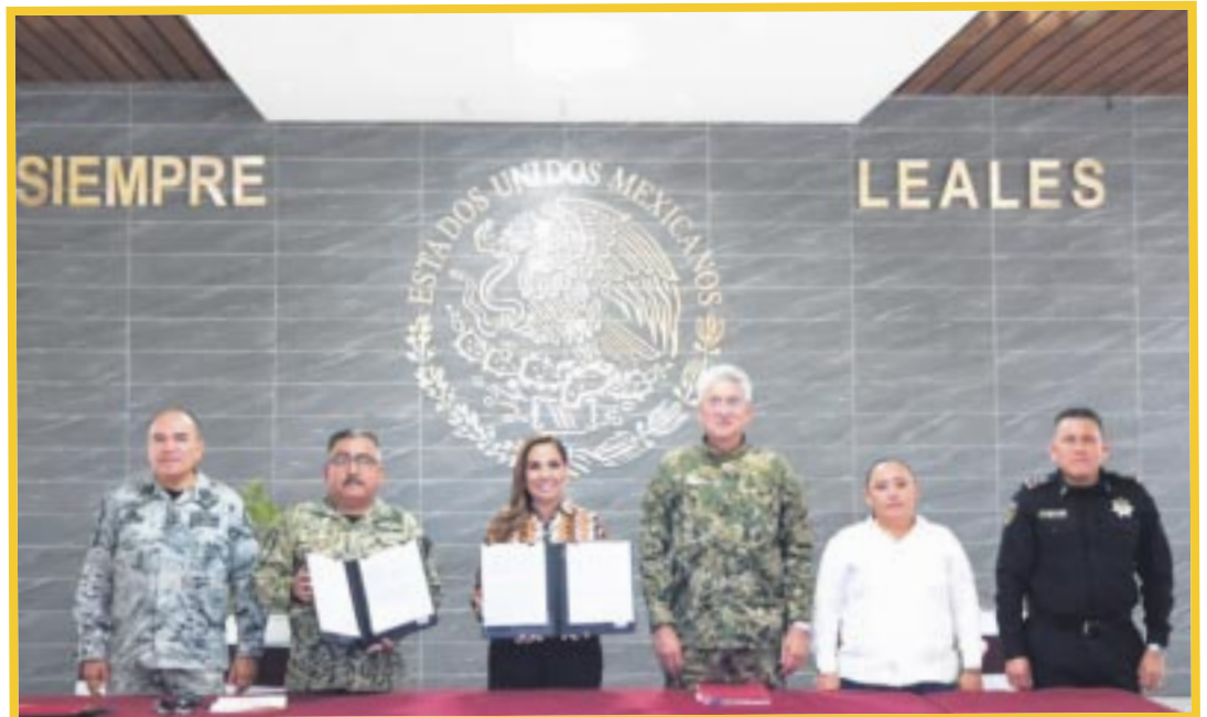
La gobernadora Mara Lezama Espinosa firmó un convenio de colaboración con la Sedena, en reconocimiento a sus servicios.