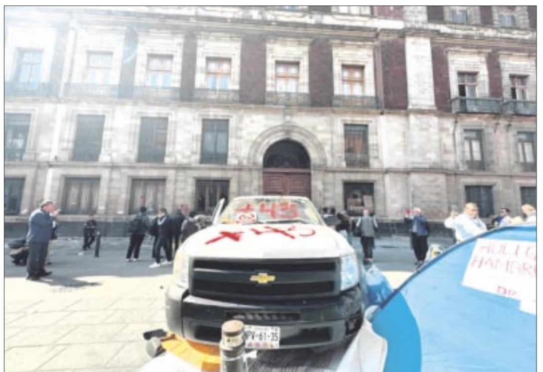
El intento de portazo en Palacio Nacional puede ser presagio de algo más grave.

ramonzurita44@gmail.com ramonzurita44@hotmail.com