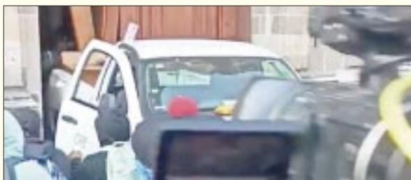
Encapuchados, que acompañan a los familiares de los 43 desaparecidos de Ayotzinapa en sus manifestaciones en la CDMX, derribaron una puerta de Palacio Nacional.

Además, enunció barreras como la falta de recursos para conseguir un tratamiento más completo, la escasez de alimentos más sanos y el insuficiente conocimiento sobre la obesidad como una enfermedad.