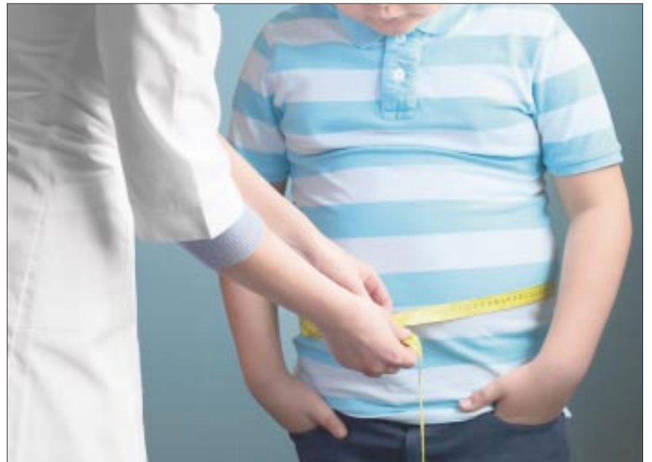
México ocupa el quinto lugar a nivel mundial en cuanto a casos de obesidad, la cual afecta a más de 50 millones de personas, según datos de la Encuesta Nacional de Salud y Nutrición 2022.

Ricardo Luna señaló que entre los factores que contribu-