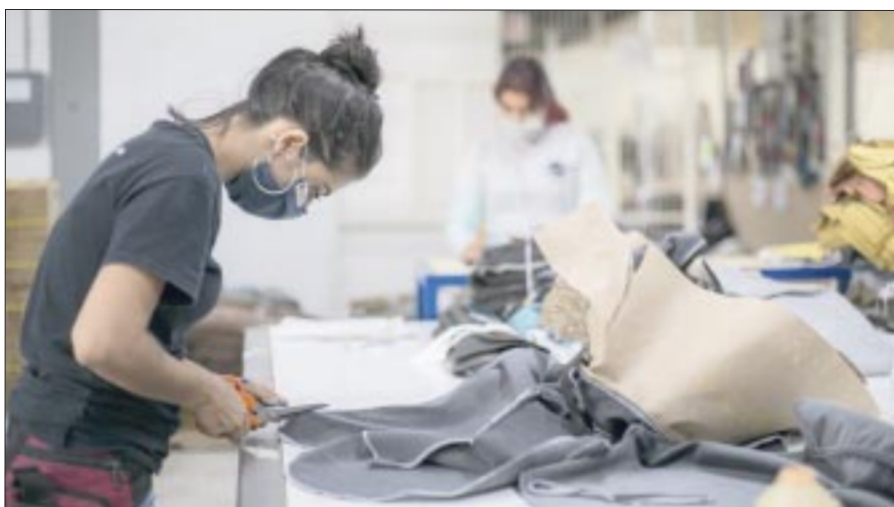
El empleo formal del país reportó en el mes de febrero 11% menos generación de puestos de trabajo que el año pasado, al sumar 156,403 plazas laborales, informó el IMSS.

“En Estados Unidos se creó una burbuja de demanda