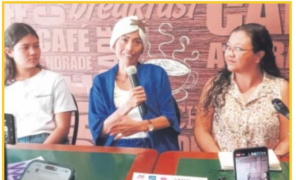
Se lleva a cabo el evento “Unidos por la Vida” en Playa del Carmen.

Tamizaje mamográfico: Para mujeres en riesgo, se recomienda realizar mamografías regulares.