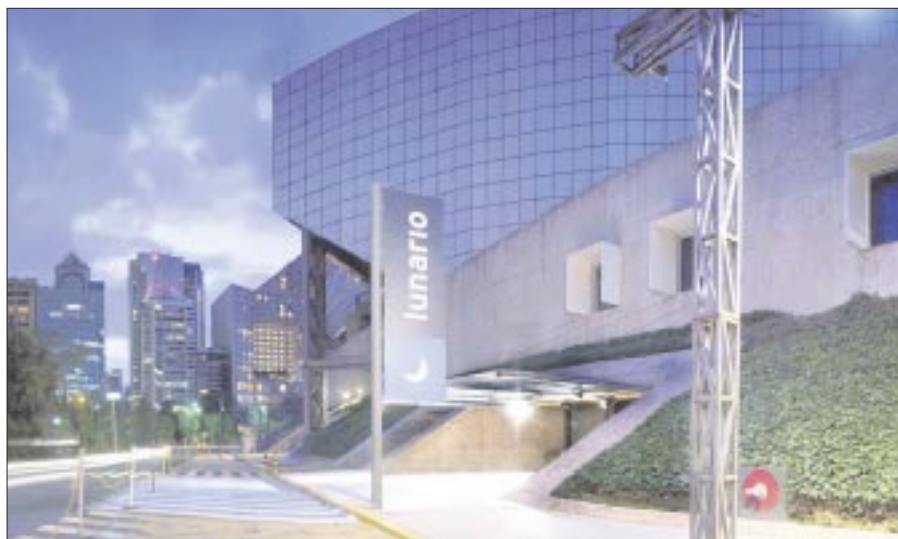
Se consolidó como un escenario alternativo para artistas consagrados y plataforma para nuevos creadores y vertientes

Desde el inicio fue un espacio pensado para ofrecer espectáculos con tecnología vanguardista en audio y video, excelente isóptica para un máximo de mil 200 personas de pie y 500 sentadas, y la opción de consumir bebidas y alimentos cómodamente mientras se disfruta de la función. Su versatilidad le permite convertirse en escenario teatral, recinto para conciertos, sala de proyecciones, espacio para conferencias y eventos corporativos, presentaciones de libros, pista de baile y pasarela para desfile de modas.