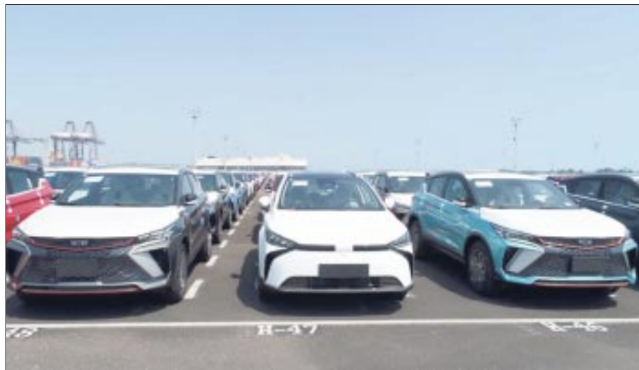
La oferta de vehículos chinos nuevos a precios accesibles en México hace que disminuya el mercado de autos seminuevos.

De acuerdo con un seguimiento de la firma ManpowerGroup, los datos del Instituto Mexicano del Seguro Social, por tercer año consecutivo tanto enero y febrero presentan una generación de empleo sobre 100,000 puestos de trabajo; por lo que esperan que para el primer trimestre del año la creación de plazas de trabajo sea de 350,000 empleos formales, sobre todo por las contrataciones que se registran en Semana Santa.