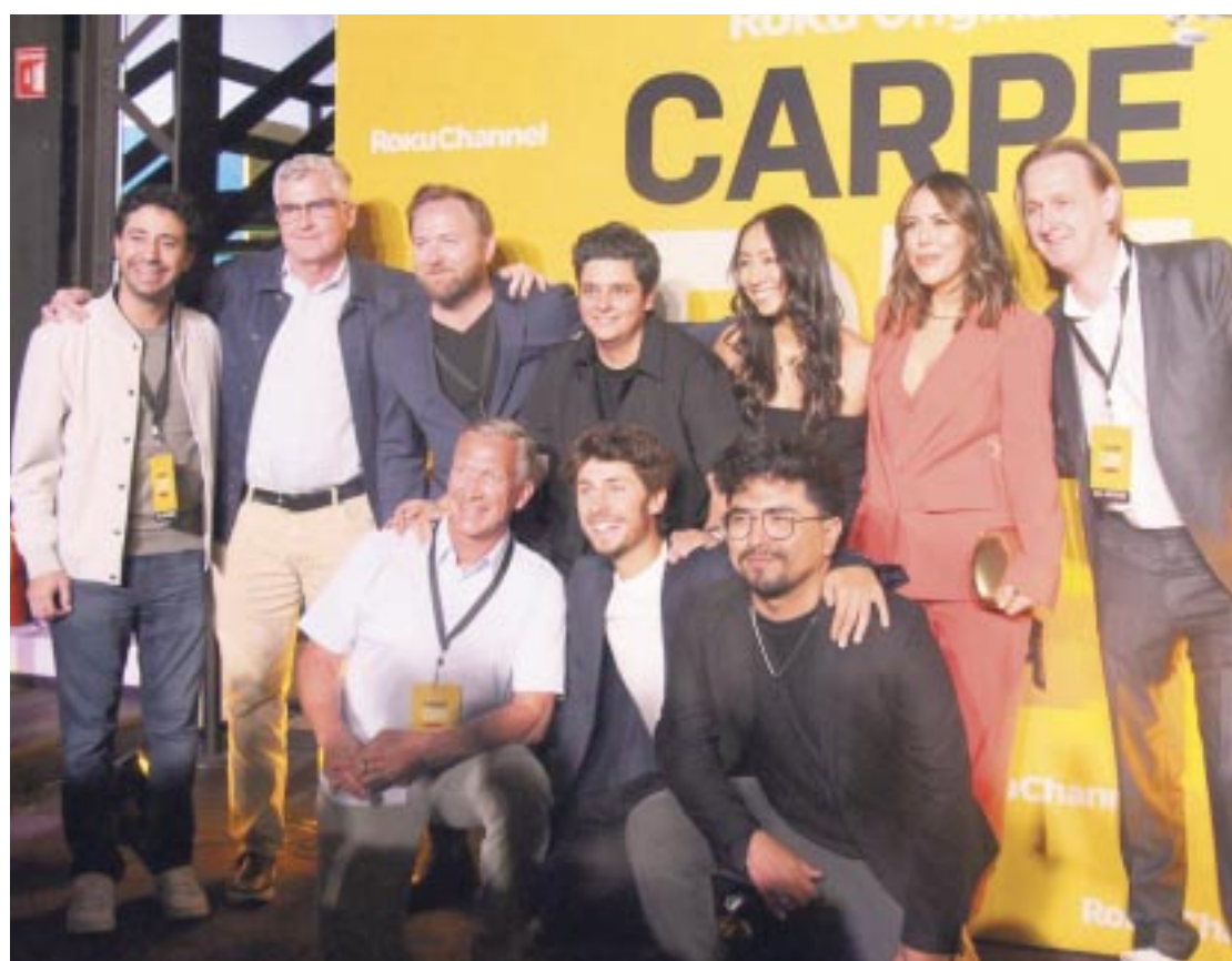
Adelantaron que cada capítulo es una aventura y desafío nuevo, con algún invitado distinto.