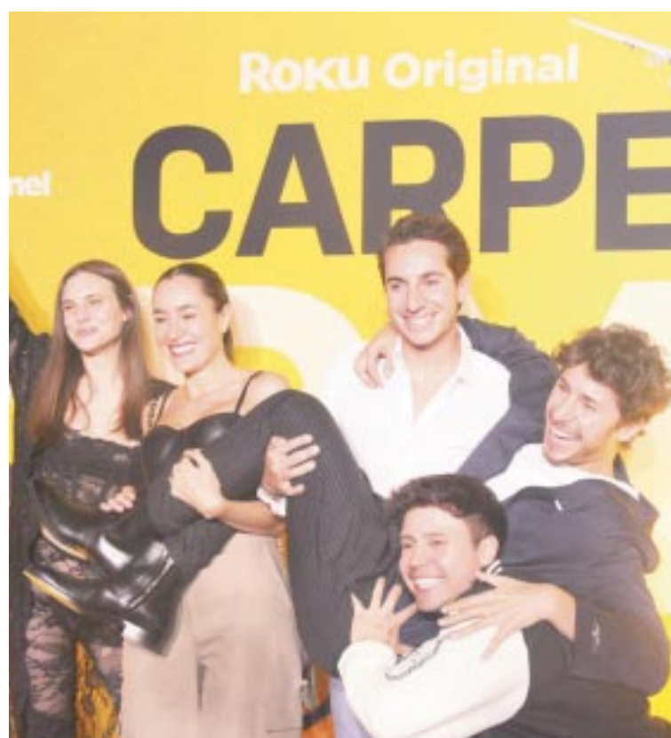
Se presentó el primer capítulo de la serie, que por primera vez disfrutaron amigos y asistentes.