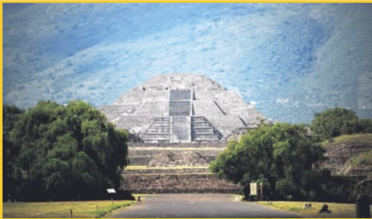
INAH pondrá en marcha el Operativo Equinoccio de Primavera 2024, en los sitios de mayor afluencia turística del país.

El Operativo Equinoccio de Primavera consiste en aplicar medidas de contención en las fechas de gran concurrencia, para evitar daño a los basamentos precolombinos y prevenir accidentes. Por ello, estará prohibida la entrada con mascotas, alimentos, bebidas alcohólicas, estupefacientes, armas y bultos.