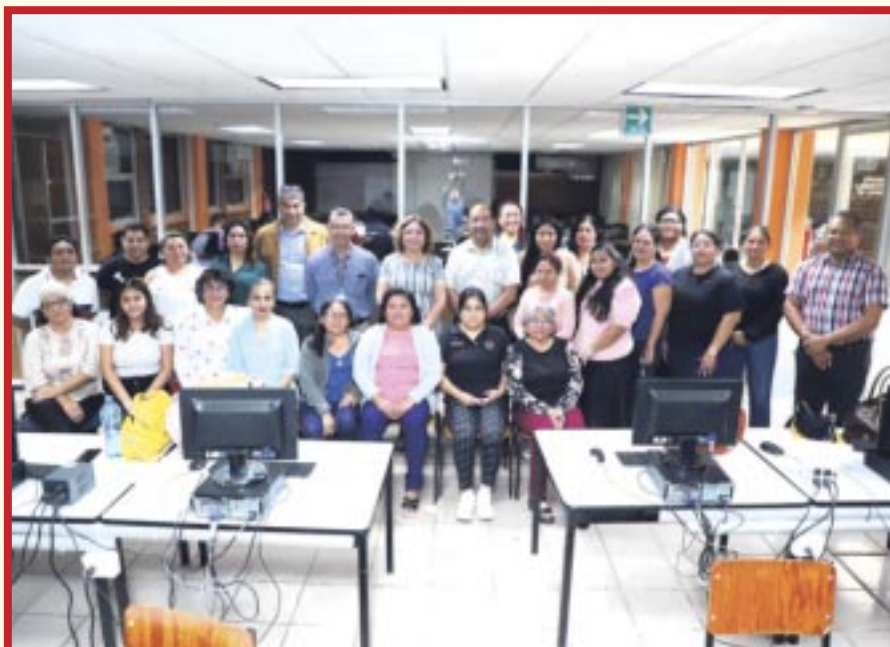
Titulares y personal que labora en las Oficialías Municipales del Registro Civil, recibió la capacitación denominada "Interpretación de Documentos Probatorios y e-CURP".

Chetumal.- La Dirección General y Oficialía Central del Registro Civil realizó en esta ciudad, entre titulares y personal que labora en las Oficialías Municipales del Registro Civil, la capacitación denominada "Interpretación de Documentos Probatorios y e-CURP".