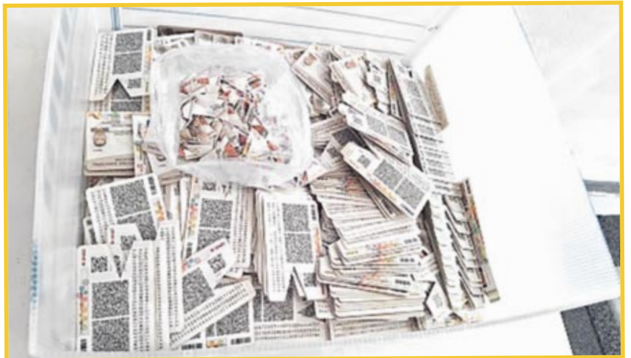
El INE en Quintana Roo llevó a cabo la destrucción de 772 formatos de credencial.

Asimismo, por aprobación de las y los integrantes de la Comisión Local de Vigilancia, se determinó la verificación y lectura del 20% del universo de credenciales como verificativo, por lo se revisaron los 155 formatos de credencial mediante el Sistema Integral de Información del Registro Federal de Electores (SIIRFE).