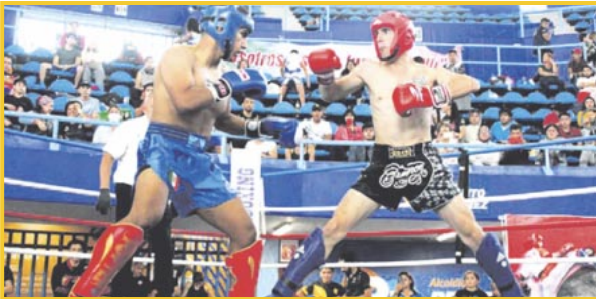
El Abierto Mexicano de Kickboxing en su tercera edición se llevará a cabo en la ciudad de Cancún.