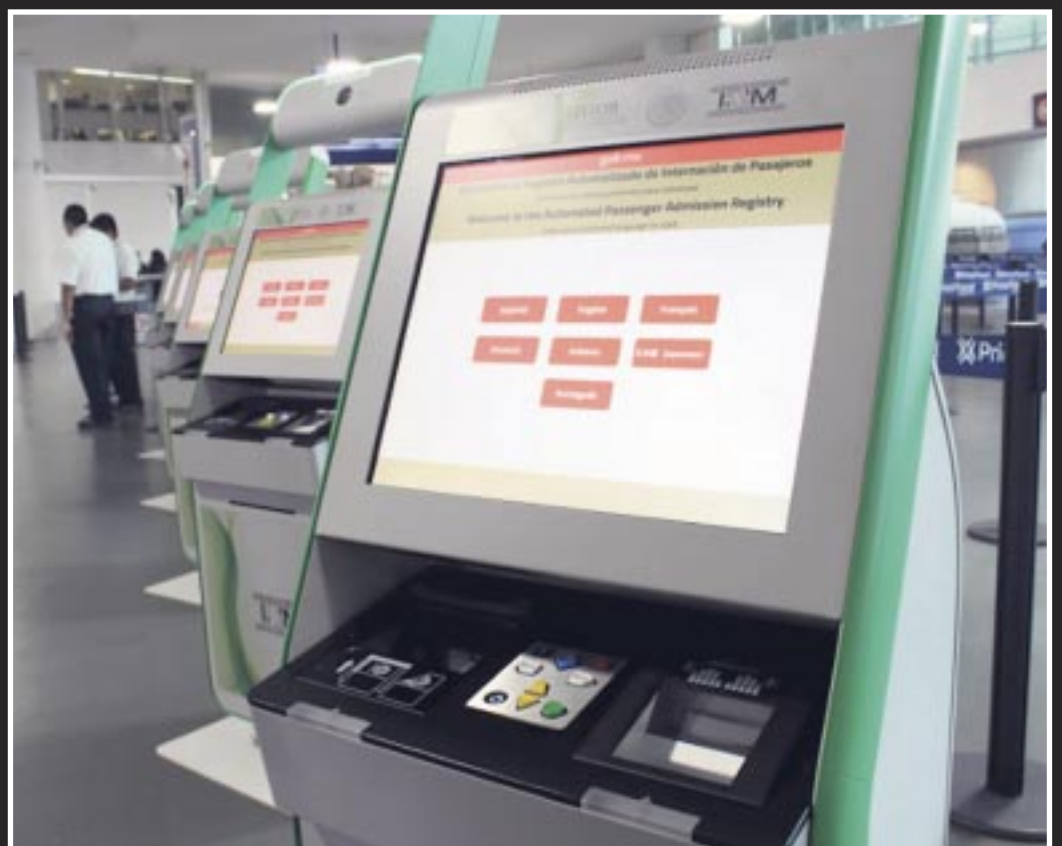
Para facilitar documentación en los vuelos, siguen activos más de 70 kioscos automáticos en la Terminal 3 del Aeropuerto Internacional de Cancún.

Los kioscos digitales empezaron a ser colocados en 2018 con una inversión principal de 7.6 millones de dólares y fue en distintas terminales del Aeropuerto Internacional de la Ciudad de México, en Los Cabos y en Cancún, que concentran alrededor del 75% de los arribos internacionales del país.