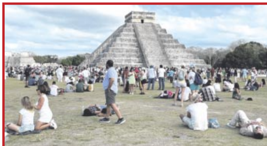
En la Zona Arqueológica de Chichén Itzá, los visitantes se dan cita para admirar el juego de luz y sombra sobre El Castillo, o Templo de Kukulcán.

En la Zona Arqueológica de Chichén Itzá, en Yucatán, donde los visitantes se dan cita para admirar el juego de luz y sombra sobre El Castillo, o Templo de Kukulcán, se aplicará del 19 al 21 de marzo.