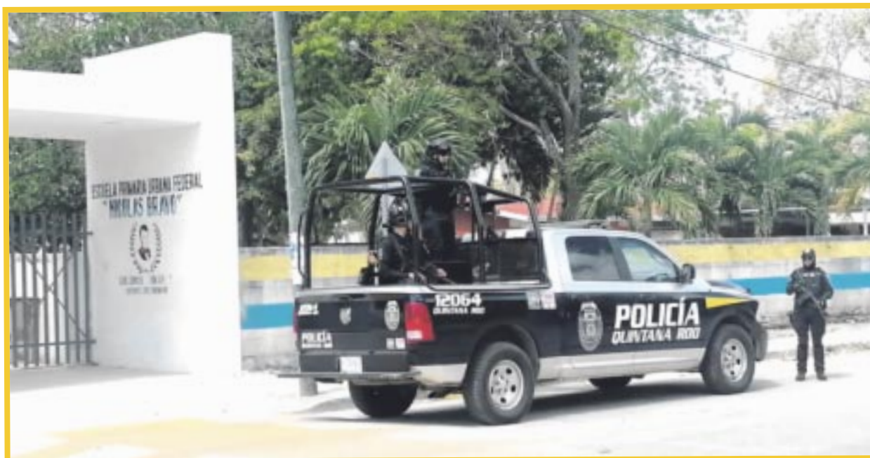
La SSC implementará el operativo Semana Santa 2024 con la colaboración de los tres niveles de gobierno para garantizar seguridad en las próximas vacaciones.

Además, se invitó a la ciudadanía a sumarse al proyecto de videovigilancia, ya que una mayor participación ciudadana contribuirá a la prevención del delito en el estado.