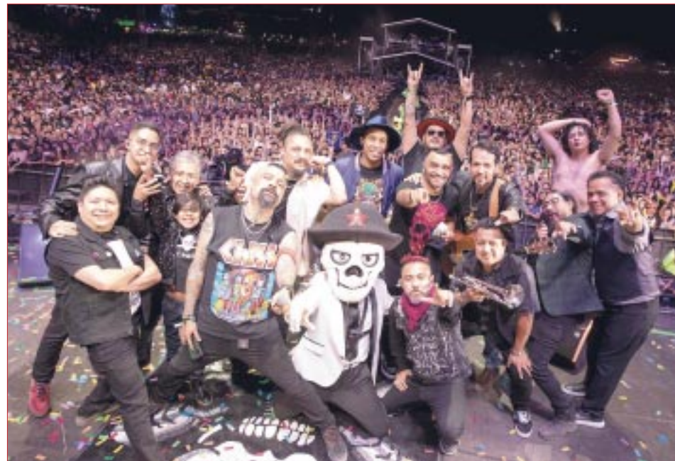
Panteón Rococó la rompe en el Vive Latino 2024. La primera vez que la agrupación se presentó en el festival fue en el 2000.