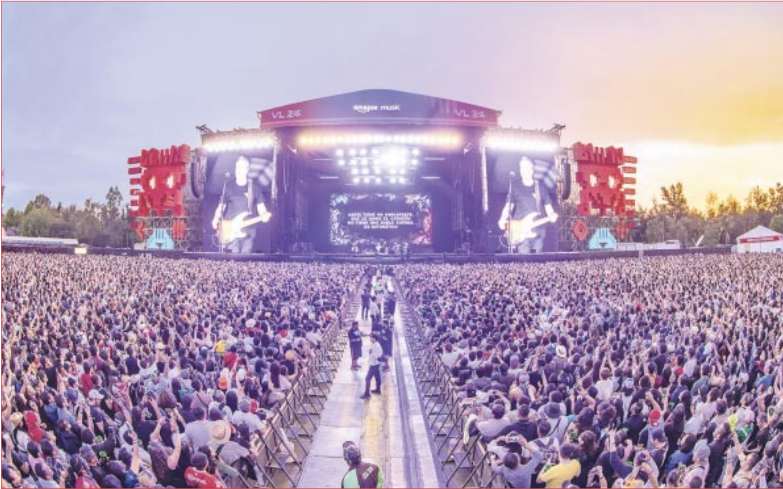
El Vive Latino 2024 sumó 160 mil asistentes y múltiples exponentes en dos días.

160 mil asistentes en total, 80 mil cada día