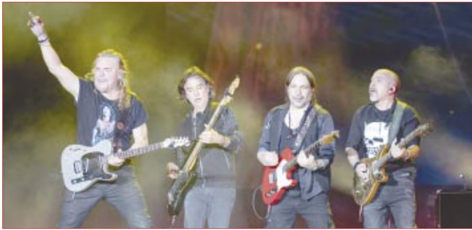
Con más de 40 años de trayectoria, Maná se presentó por primera vez en el Vive Latino.