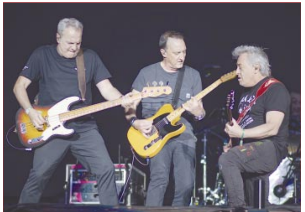
Hombres G hizo un viaje musical a los 80 en el Vive Latino..