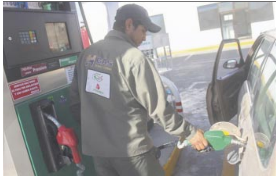
Las seis refinerías que conforman el Sistema Nacional de Refinación de Pemex, en 2023, procesaron en números redondos 792,303 barriles diarios, lo que significó un uso de capacidad de 48.3 por ciento.

Esta cifra es 11 puntos porcentuales superior a la del 2018, al inicio del sexenio, pero muy inferior a la de 90% que todavía a finales del 2021