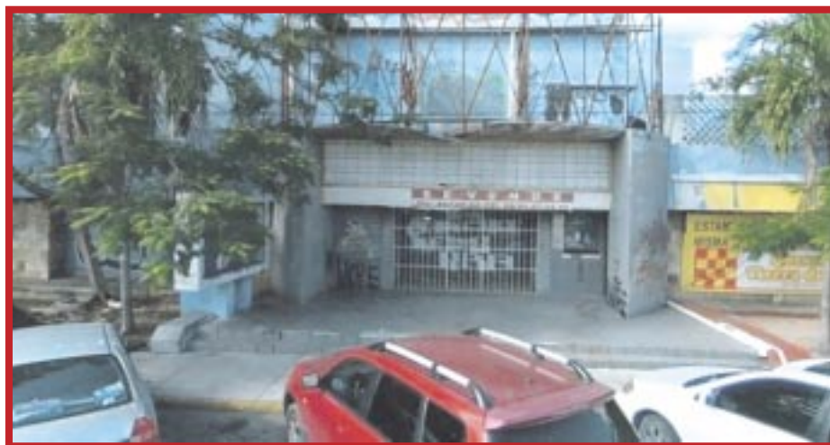
Ciudadanos de Cancún han hecho un llamado para que se creen espacios para la exhibición de cine no comercial en una cineteca.