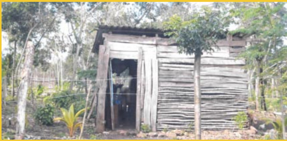
Al menos ocho nuevos asentamientos irregulares comienzan a comercializarse en Chetumal y zonas cercanas a las estaciones del Tren Maya.