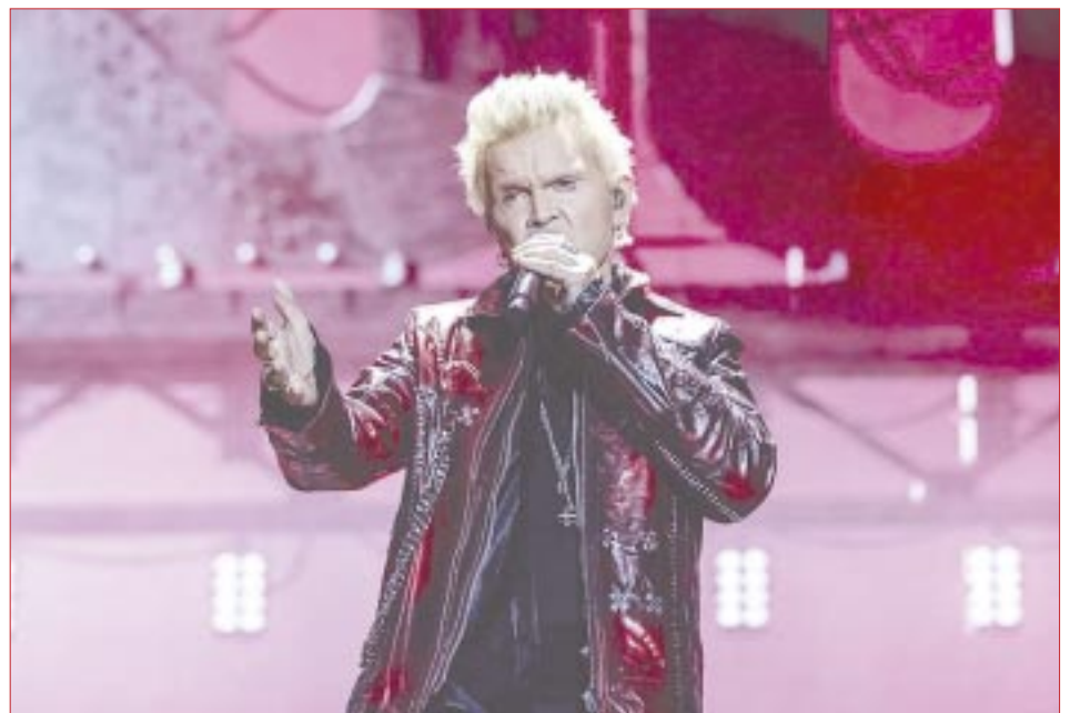
El legendario Billy Idol (68 años de edad), hizo lo propio en el escenario Amazon Music, en donde tocó sus más grandes éxitos.