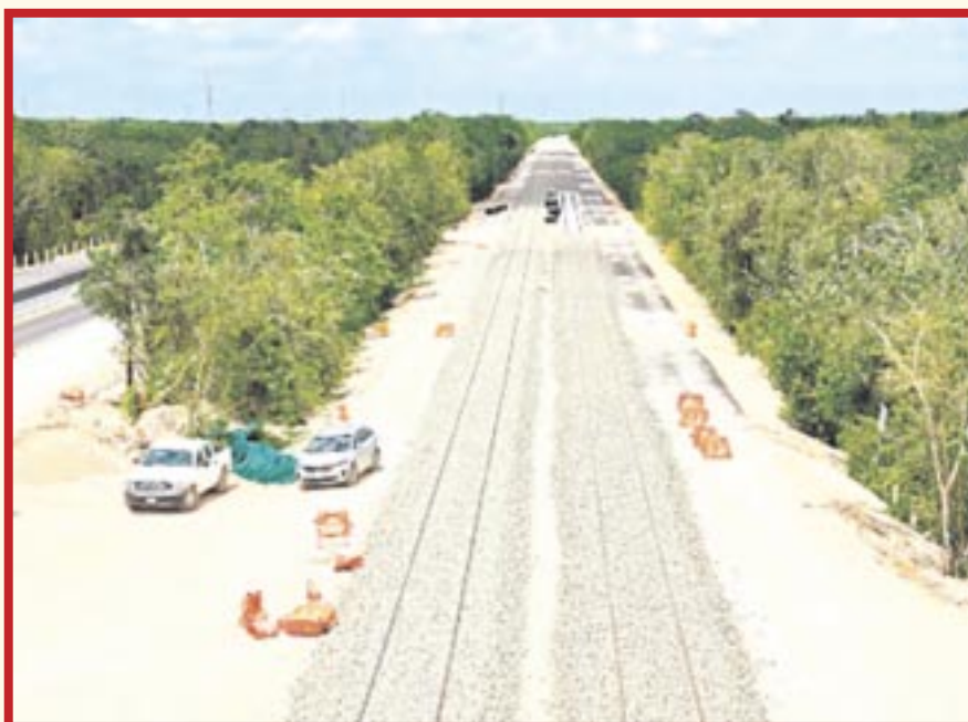
El turismo podría ser impactado por los daños carreteros provocados por las obras del Tren Maya.

La temporada vacacional de Semana Santa ya se encuentra a la vuelta de la esquina y los representantes de agencias de viajes han reconocido que existe una gran preocupación por la afectación que pudieran ocasionar los daños de la carretera por la construcción del Tren Maya y el tema de la seguridad; pues por un lado los traslados se vuelven tediosos para los viajeros en carreteras que no son óptimas, y por el otro, la inseguridad siempre merma el deseo de visitar algún destino.