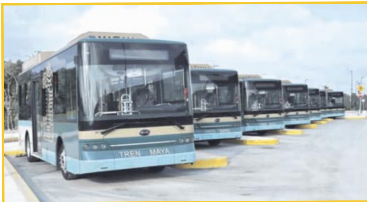
Operarán autobuses eléctricos para conectar a los usuarios del Aeropuerto de Cancún con el Tren Maya, una vez que desciendan de sus vuelos.

Cabe recalcar que ya se encuentra completa la carpeta asfáltica y se trabaja en la instalación electromecánica de las esclusas de acceso.