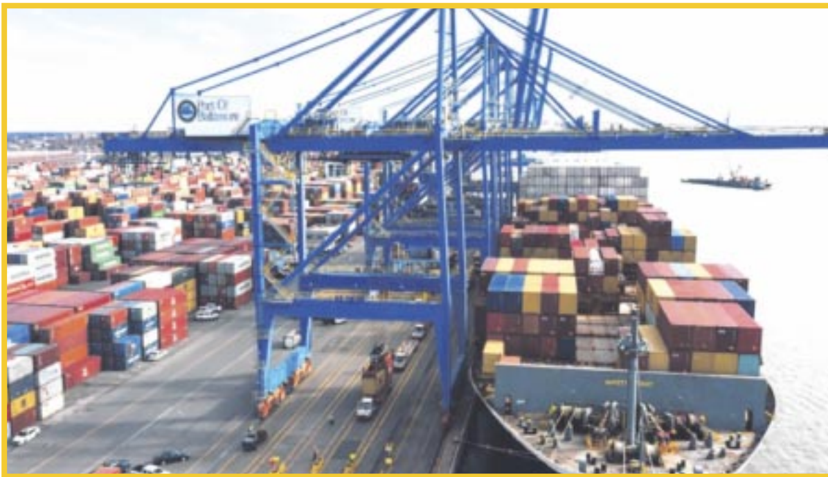
Empresarios por Q. Roo , confirman que se busca la importación de diversos productos de Brasil.

Durante el evento Intermoda, donde se dieron cita más de 500 expositores, inversionistas quintanarroenses explicaron que para el próximo año se espera la participación de 85 mil empresarios, con reuniones uno a uno y seguirán invitando a los quintanarroenses y mexicanos en general.