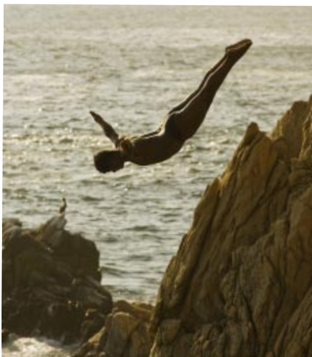
La Quebrada, espectáculo único.

victoriagprado@gmail.com X: @victoriagprado