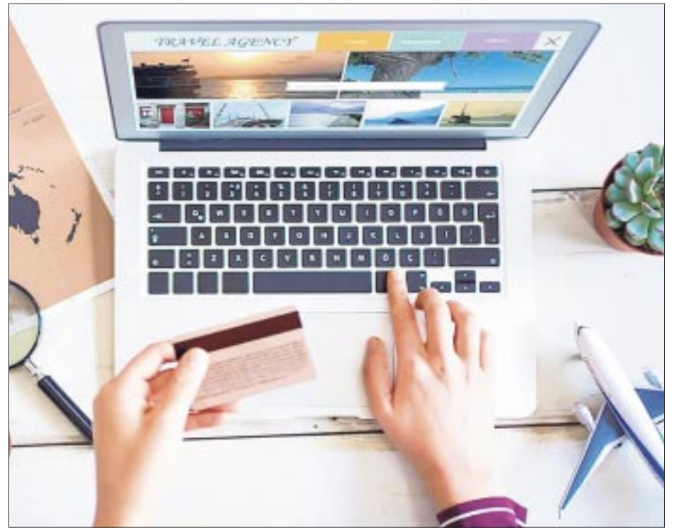
Cada año, previo a las temporadas de vacaciones, aumenta el riesgo de caer en estafas perpetradas por los conocidos “montaviajes”.

que en 2022, año donde hubo un mayor número de reportes, se presentaba una situación diferente, pues sí había una empresa, pero incumplía con lo que ofertaba y era difícil que las personas pudieran recuperar su dinero. Pero en 2023 hubo más “clonación” de empresas dedicadas a viajes turísticos, precisó.