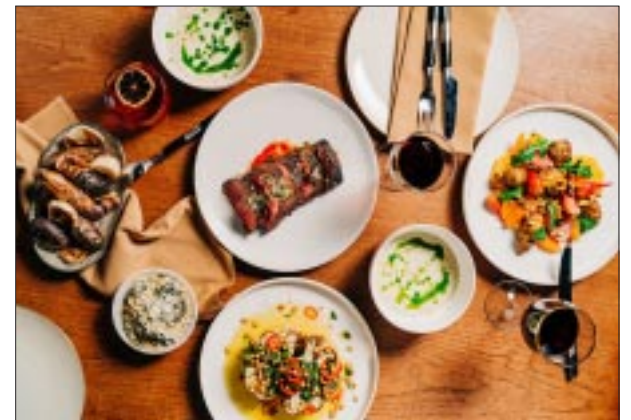
Vive BOGO Weekends Plus.

La valentía y pasión se encuentran en lo alto de imponen-