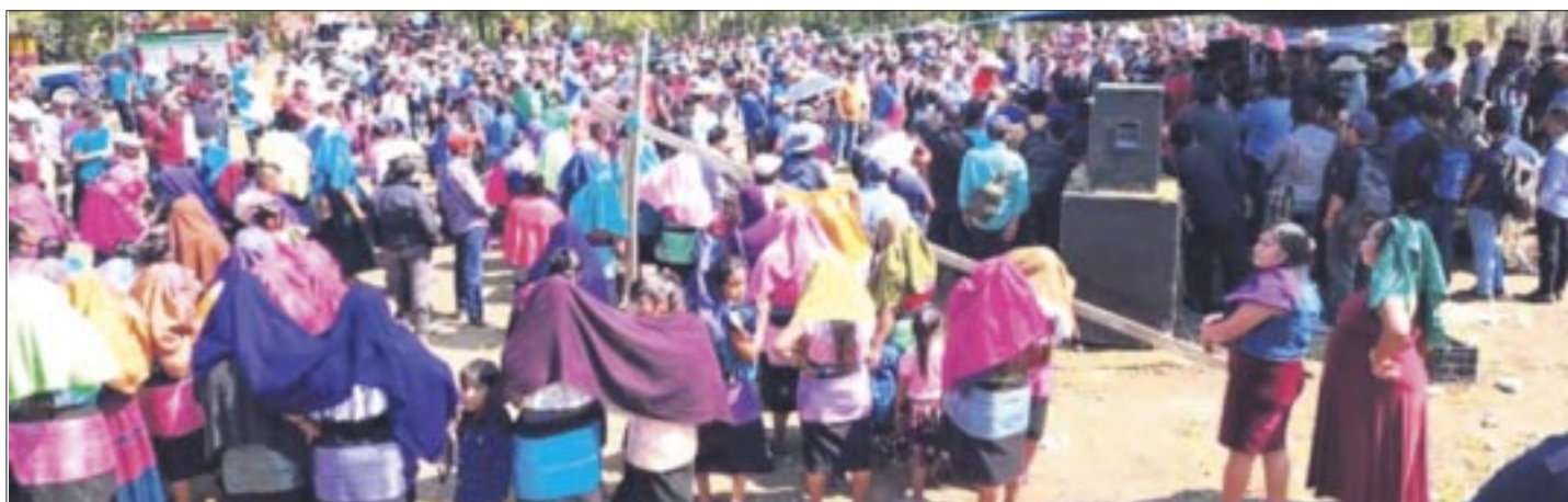
Pantelhó, en Chiapas, ya anunció que no habrá comicios este 2 de junio en su localidad y que ya cuentan con autoridades elegidas por ellos mismos.

ramonzurita44@gmail.com ramonzurita44@hotmail.com