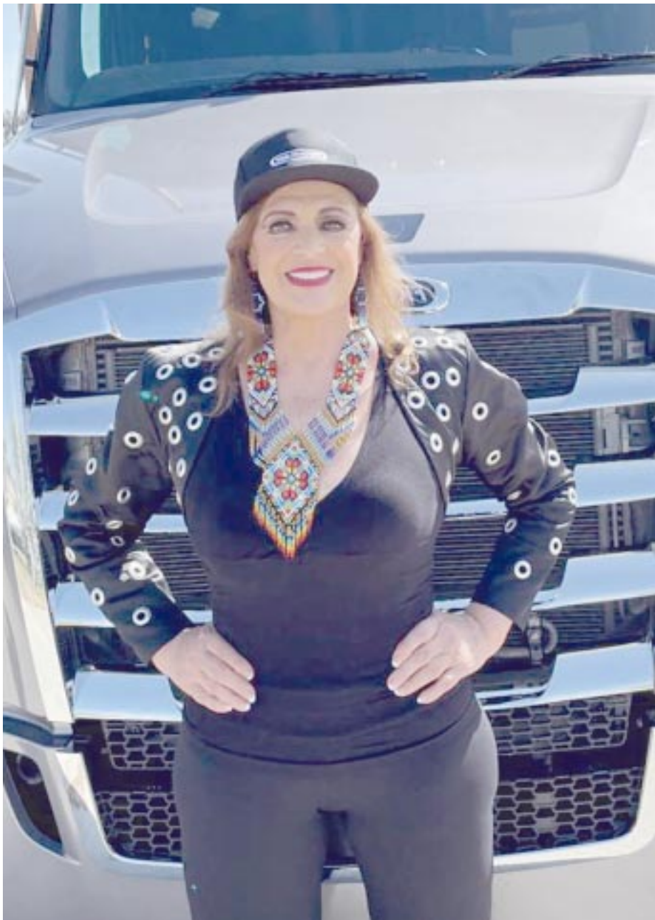
La actriz y cantante señaló que el 5 de mayo será la madrina de las carreras de tráileres que se organizan en Toluca.

madrina de las carreras de tráileres que se organizan en Toluca, el año pasado encabezé el desfile. Invito a todos los amigos porque se pone muy bien, es como una feria. El verano estaré de gira por ciudades de Estados Unidos, para el deleite de mis paisanos, les voy a cantar y a consentir”, anunció.