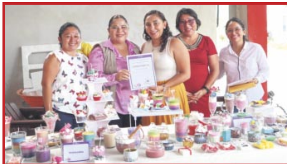
El IQM avanza con cursos, talleres, conferencias, jornadas de salud entre otros eventos por el mes de marzo, mes de las mujeres.

En estos cursos de capacitación se trabaja muy de cerca con las mujeres a fin de desarrollar sus capacidades, fortalecer sus habilidades y conocimientos, permitiéndoles desarrollarse profesional y personalmente en un entorno laboral, así como mejorar su calidad de vida y favorecer su empoderamiento de las mujeres y erradicar la violencia de género.