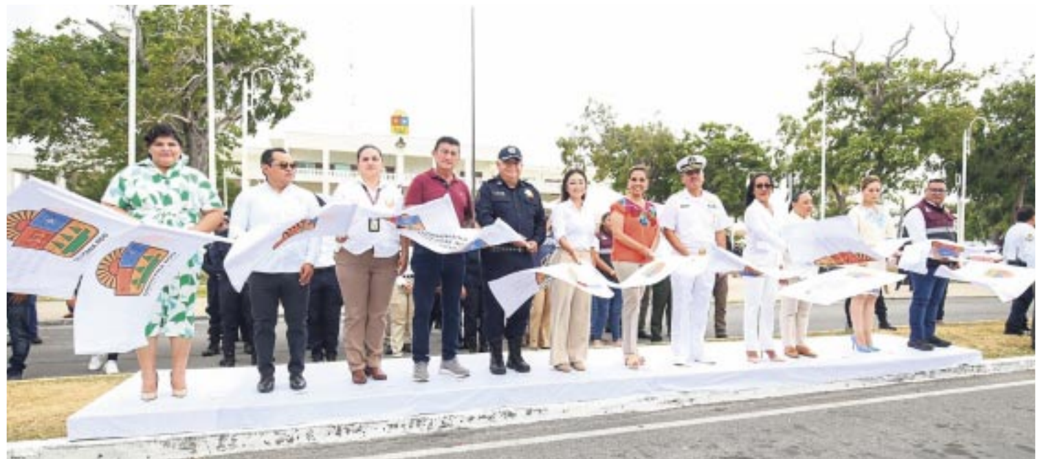
La gobernadora Mara Lezama dio el banderazo de inicio del Operativo de Seguridad Vacacional 2024 en Chetumal y la zona sur de la entidad.