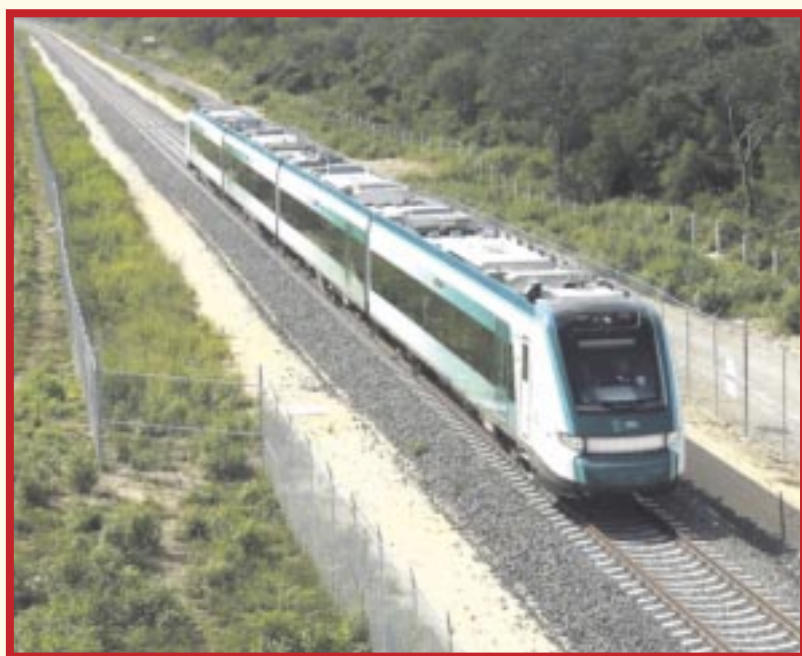
La Canaco Chetumal estimó que la conclusión de la construcción del Tren Maya tardaría hasta diciembre.