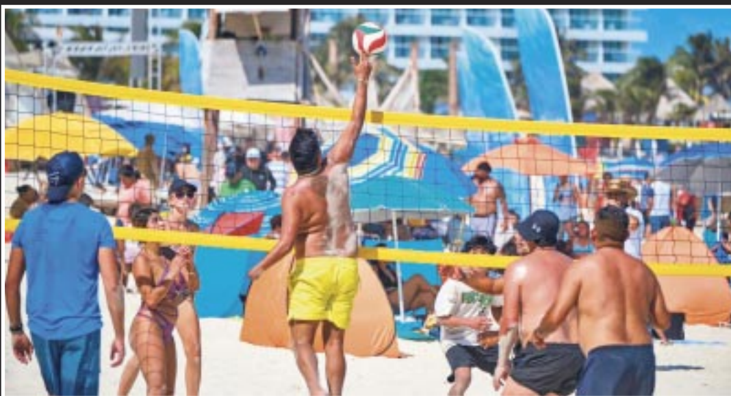
En el lapso del 16 al 22 de marzo llegaron más de 521 mil turistas, previo a las vacaciones de Semana Santa.

– Q. Roo sigue fortaleciendo su liderazgo turístico mundial