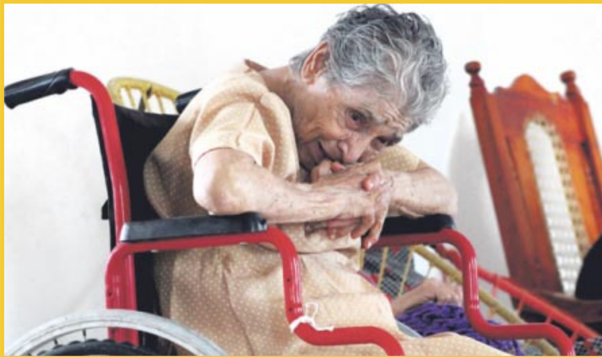
En Cancún, muchos adultos mayores pasan la mayor parte del tiempo solos y sin comida.