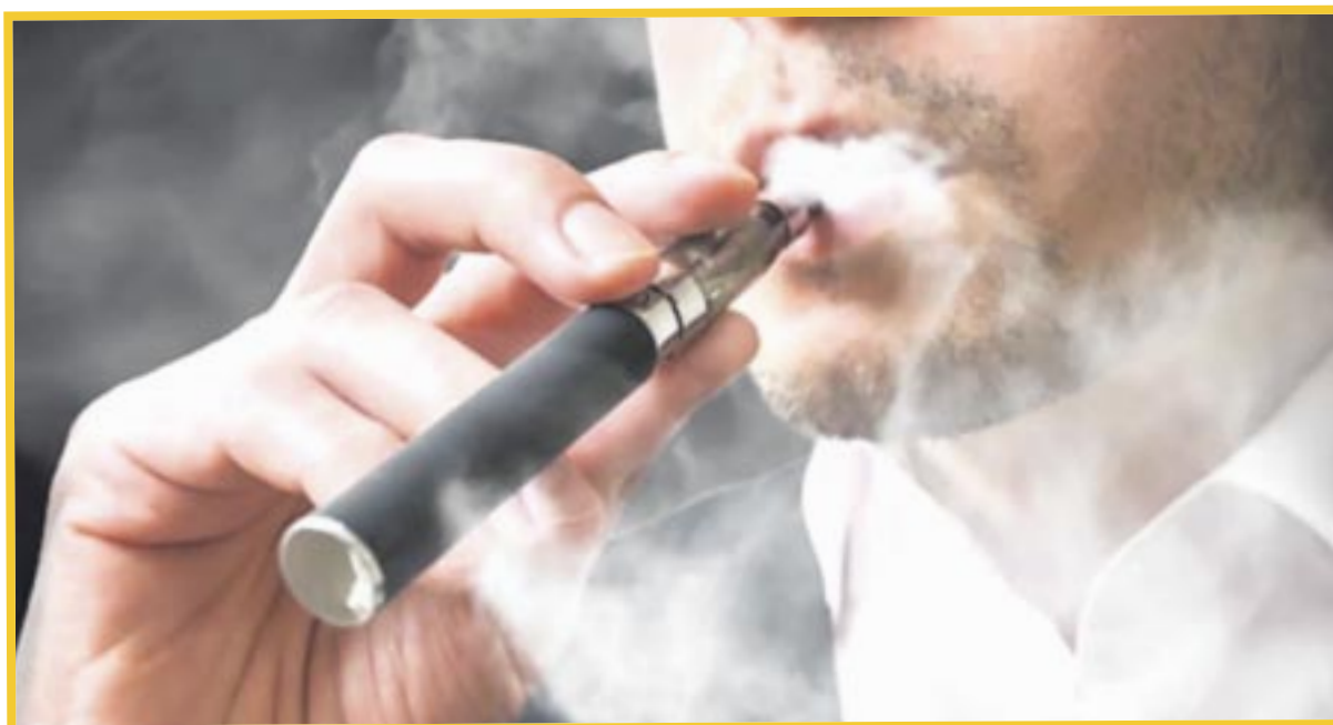
La Cofepris advierte de los peligros de la inhalación del acetato de vitamina E en los vapeadores, que puede causar enfermedades respiratorias agudas e incluso provocar que pierdan la vida.

Dicho riesgo, se ve respaldado por un estudio del CDC que encontró acetato de vitamina E en muestras de personas fallecidas que consumían vapeadores.