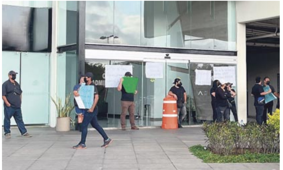
Al menos 50 operadores de Uber se manifestaron frente a las oficinas de esta plataforma en Cancún para exigir que se terminen las agresiones por parte de taxistas.

Los conductores de Uber lanzaron consignas como “¡No más agresiones!” y “¡Déjenos trabajar; basta de agresiones!”. Hasta el cierre de esta edición, no habían sido recibidos por los directivos de Uber para abordar sus demandas.