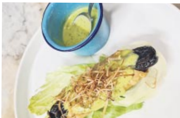
Taco dorado de chile pasilla relleno de camarones al ajillo.