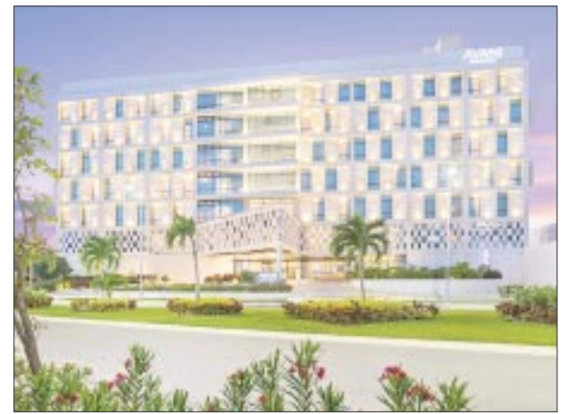
Nuevo hotel en Cancún.