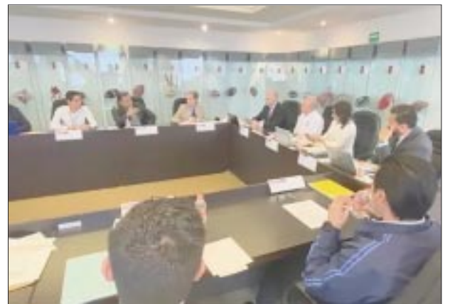
Todo está listo para el Tianguis Turístico en Acapulco.