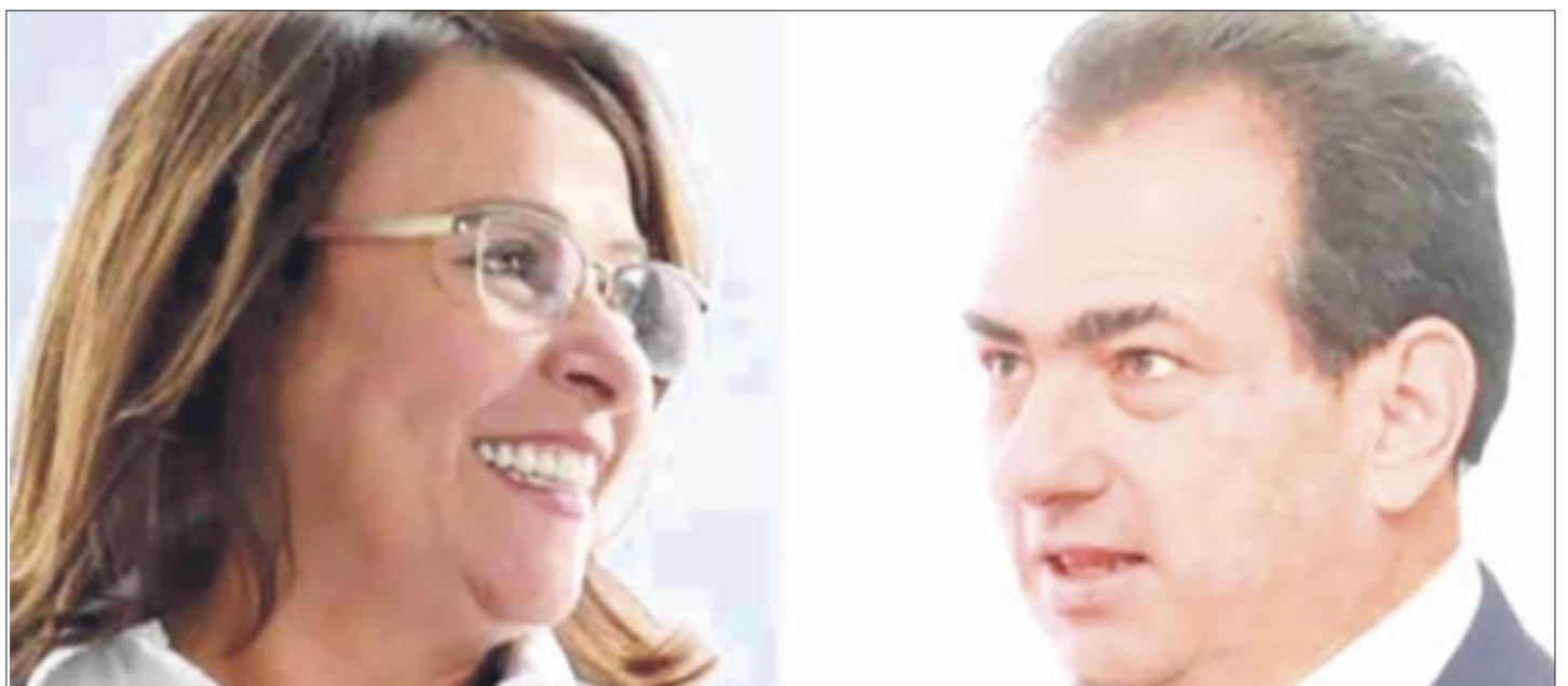
La tarea para Rocío Nahle no es sencilla, compite con José Francisco Yunes.

ramonzurita44@gmail.com ramonzurita44@hotmail.com