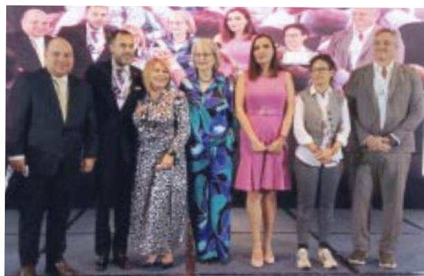
Después del corte de listón que abrió EPTUR.

victoriagprado@gmail.com X: @victoriagprado