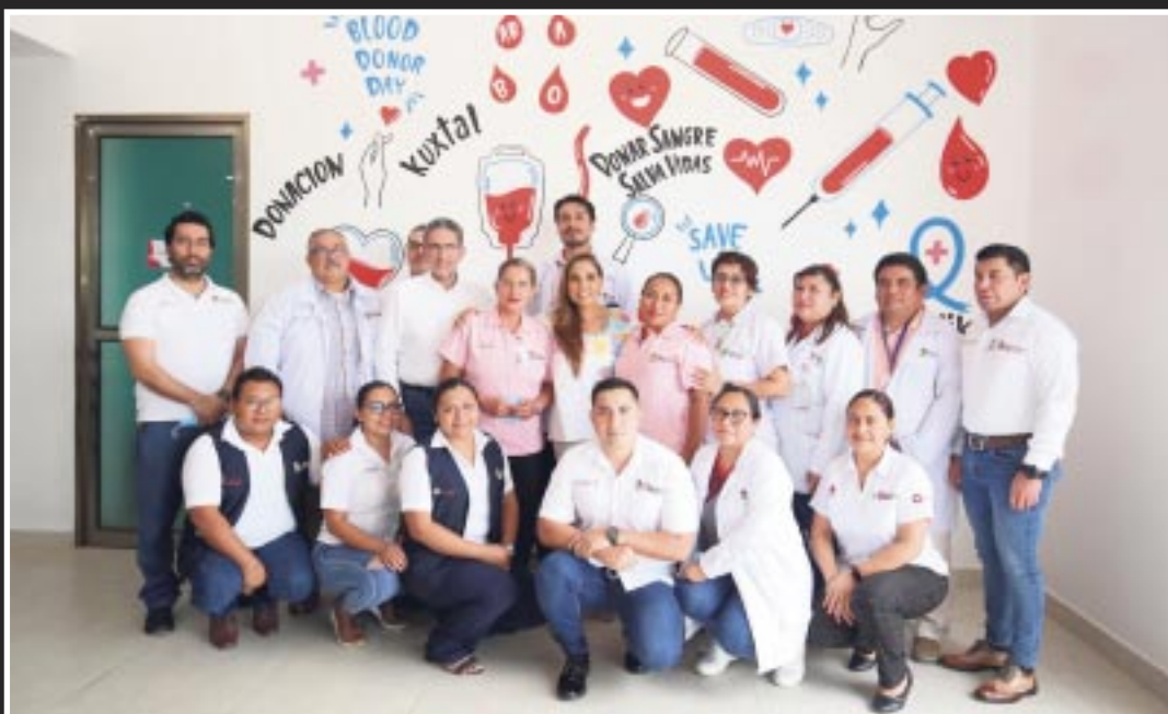
Mara Lezama Espinosa recorrió las nuevas instalaciones del Centro de Transfusión Sanguínea, en Chetumal.