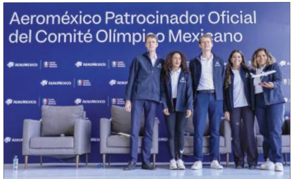
Durante la presentación de la alianza.

Recordó que The Fives Hotels & Residences inició opera-