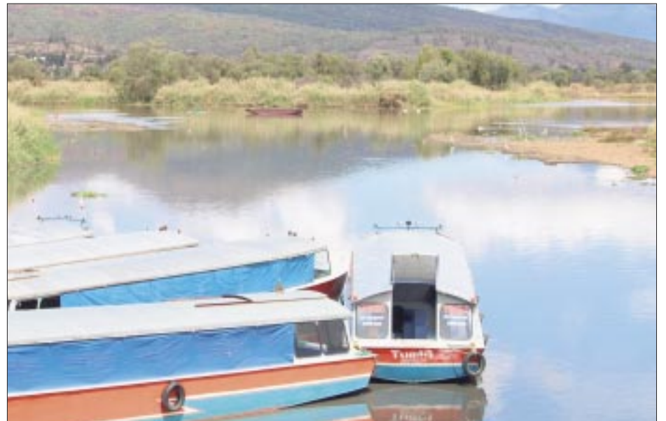
El lago de Pátzcuaro, un tesoro natural y cultural en el corazón de Michoacán, enfrenta una grave crisis ambiental que amenaza su existencia.

El profesor-investigador decano del Instituto de Investigaciones sobre los Recursos Naturales (Inirena) de la Universidad Michoacana de San Nicolás de Hidalgo (UMSNH),