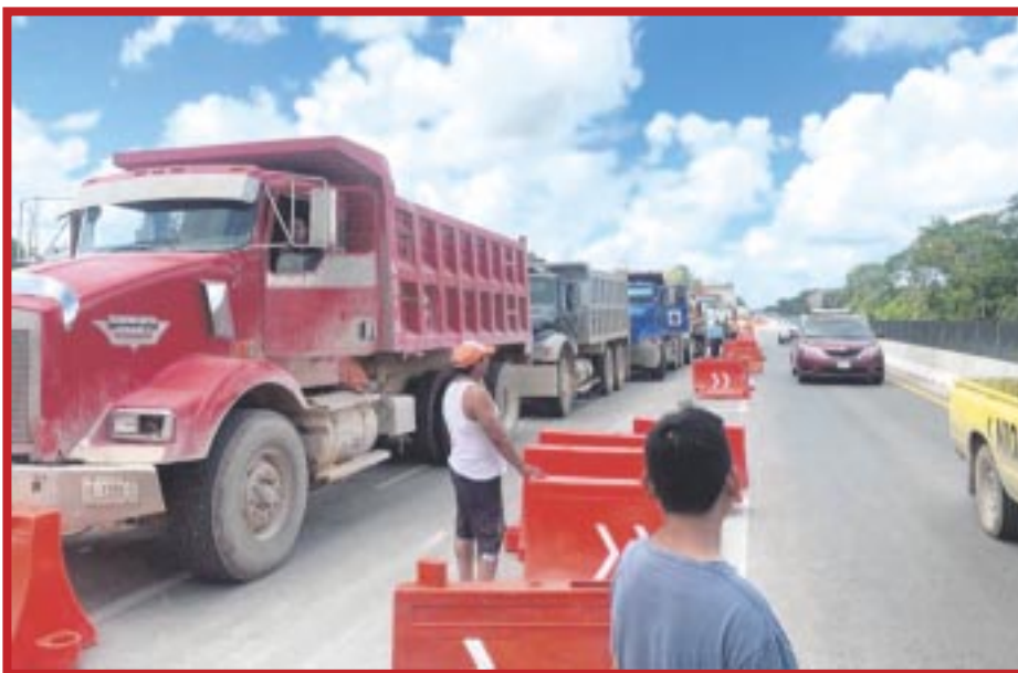
En el sur de Quintana Roo, los volqueteros están protagonizando enfrentamientos para hacerse de contratos en el Tren Maya.

El informe de Profepa también incluye el colapso del techo de un cenote que no tiene nombre, el lavado de la olla de revolventoras en sitios no autorizados, extracción de agua sin autorización y las modificaciones en las cavernas por las perforaciones para la construcción de pilotes, entre otras afectaciones.