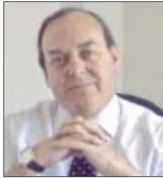
Por Ramón Zurita Sahagún

Para dejar en claro cómo son esas advertencias que no producen ningún tipo de temor, se encuentran las fotos de Claudia Sheinbaum, tan relajada cuando fue detenida por embozados en una de las tantas peligrosas carreteras de Chiapas.