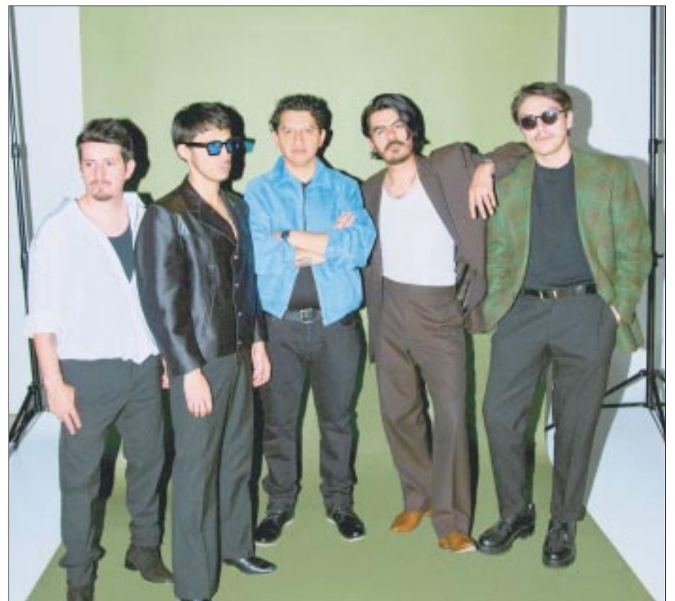
“No Te Puedo Adivinar”, una canción cargada de emociones intensas, con electrizantes guitarras.

En estos meses Odisseo se prepara para el concierto más importante de su carrera en el mítico Auditorio Nacional de la Ciudad de México.