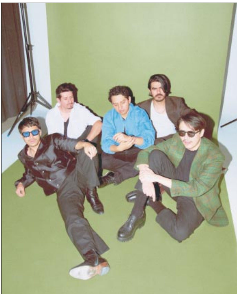
Este tema es el vivo ejemplo del nuevo rock latino que propone Odisseo, con un sonido emocionante que desborda adrenalina.

Odisseo también estrena el videoclip oficial de “No Te Puedo Adivinar” dirigido por el experimentado cineasta Marcelo Quiñones. Filmado en el análogo y nostálgico formato Súper 8.