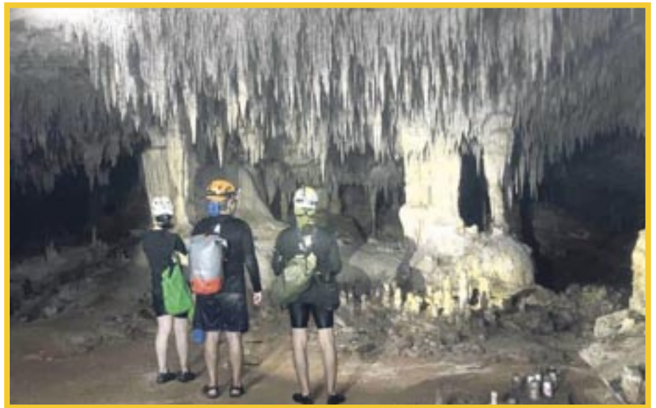
La Profepa confirma relleno de cavernas y derrame de cemento en acuífero del Tramo 5 Sur del Tren Maya.