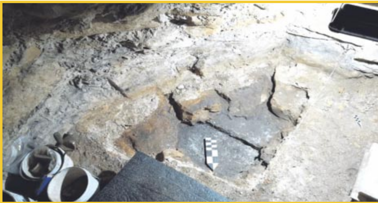
En la Zona Arqueológica de Tulum se halló un chultún, de 2.48 metros de diámetro y 2.39 metros de profundidad.

En la Zona Arqueológica de Tulum se halló un chultún, de 2.48 metros de diámetro y 2.39 metros de profundidad, con entrada de forma rectangular, al interior del Edificio 25, denominado Casa del Halach Uinic, cuya particularidad es que se trata del único encontrado dentro de una edificación.