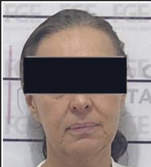
Las imputadas Rebeca “N” y Cecilia María “N”, fueron capturadas en Tijuana, Baja California, cuando pretendían cruzar hacia los Estados Unidos de América.