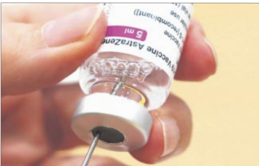
El gigante farmacéutico británico AstraZeneca anunció este miércoles que retira de la venta su vacuna contra la Covid-19, la Vaxzevria, una de las primeras que salió al mercado durante la pandemia.

“Aquí se ha combatido mucho la pobreza, pero hay sectores, no se trata de toda la clase media pero hay sectores de la clase media, que son muy conservadores y aspiracionistas”.