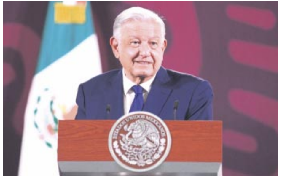
El presidente Andrés Manuel López Obrador lamentó que la Ciudad de México se haya convertido en conservadora y achacó a varias razones ese cambio de posición.

La escasez de datos acerca de la eficacia de la vacuna entre personas mayores llevó a algunos países a restringir inicialmente su aplicación a los más jóvenes, antes de levantar la limitación. Millones de dosis de esta vacuna se distribuyeron en países más pobres a través de un programa coordinado por Naciones Unidas, ya que su producción y distribución era más barata y fácil. Pero los estudios posteriores demostraron que las vacunas que contenían ARN mensajero, más caras y elaboradas por Pfizer-BioNTech y Moderna, proporcionaban una mejor protección contra el covid-19 y sus muchas variantes, y muchas naciones cambiaron a estas opciones.