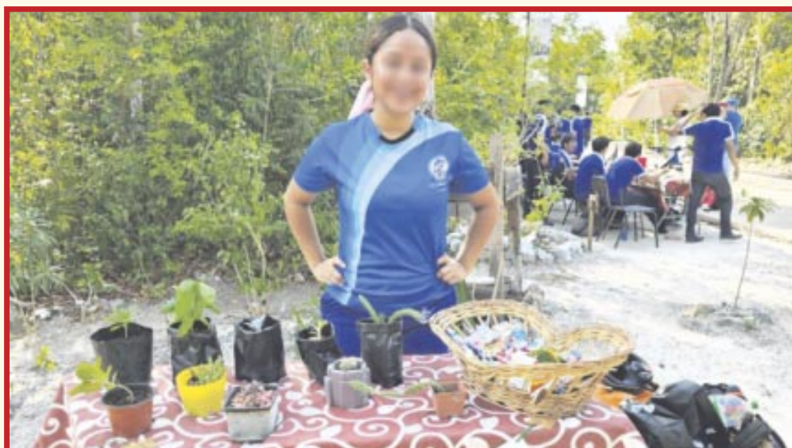
Estudiantes del Centros de Estudios Tecnológicos del Mar (Cetmar) llevaron a cabo la feria ambiental “Salud integral y su relación con el medio ambiente” en el Parque Urbano Corazón, en Cozumel.

Cozumel.- La Fundación de Parques y Museos de Cozumel (FPMC) brindó facilidades para que estudiantes del Centros de Estudios Tecnológicos del Mar (Cetmar) llevaran a cabo la feria ambiental “Salud integral y su relación con el medio ambiente” en el Parque Urbano Corazón, donde se reunieron para explorar y promover la conciencia sobre la importancia de la protección medioambiental.