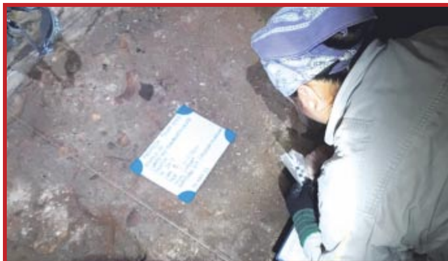
Los rellenos posteriores al chultún apuntan a que hubo un posible saqueo, durante la época prehispánica o colonial.

Al respecto, el arqueólogo y colaborador del proyecto, Felipe Nava Ahuatzin, enfatizó que “se tiene la teoría de que el compartimiento subterráneo data de la primera ocupación de Tulum, lo que se corroborará con el análisis de los sedimentos encontrados, mismos que también pueden revelar el tipo de alimentos que se consumían y cuál era la vegetación de la época, entre otros datos relevantes”.