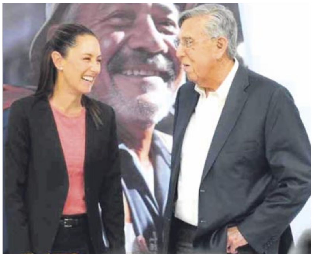
Cuauhtémoc Cárdenas , anunció que votará por Claudia Sheinbaum, pese a que no le agradan las acciones de la 4T ni ve avances en ningún lado.