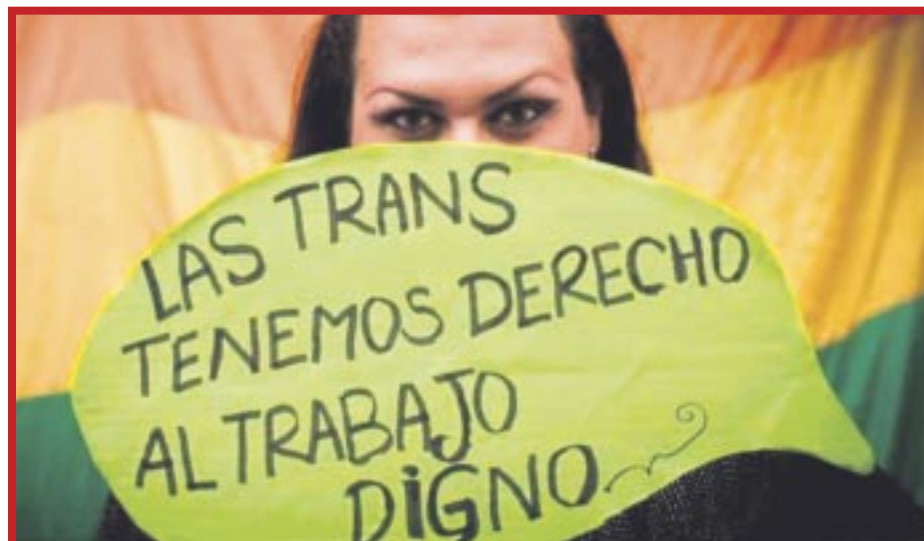
“Mariposas Trans Quintana Roo” se encuentran preparando la entrega de una iniciativa de ley de inclusión laboral.

Y asegura que lleva más de un año dando a conocer esta iniciativa en varios círculos políticos, por lo que tiene confianza que finalmente pueda ser aprobada “Yo no tengo problema de quién la presente o la abandere, pero sí tengo problema de que sea presentada ante el Congreso y se pueda refutar”, finalizó.