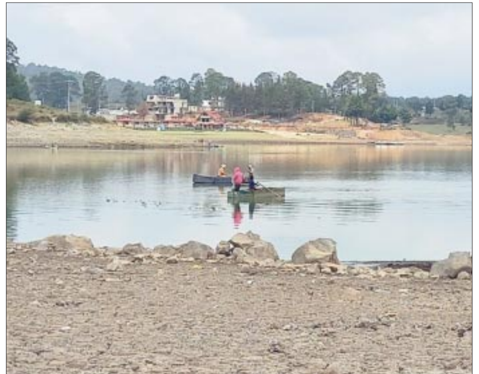
La falta de lluvias y las temperaturas extremas ocasiona que se siga reduciendo la capacidad del Sistema Cutzamala, que actualmente se ubica en 29.1 por ciento de su nivel total de llenado.

En esta semana, las tres presas de almacenamiento del Sistema Cutzamala (El Bosque, Valle de Bravo y Villa Victoria), que suministra 25 por ciento del consumo del Valle de México, en promedio, se ubican en 29.1 por ciento de su nivel total de llenado, informó, este martes,