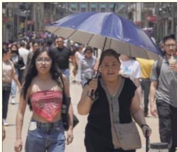
La temporada de calor en México este año finalizará hasta inicios de octubre, señalan expertos.

tamos viviendo se reflejara en unos años con respecto al cambio climático. Evidentemente eso impacta de ma-