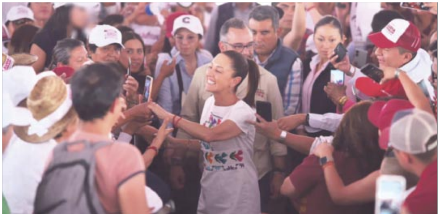
Claudia Sheinbaum invitó a la ciudadanía a votar seis de seis por Morena, dejando de lado a sus aliados del Verde y PT.