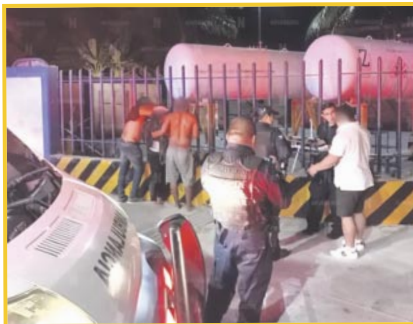
La Policía Municipal en Cancún logró el rescate de siete personas, seis de ellas de nacionalidad brasileña y un mexicano.

Las víctimas detallaron que los agresores subieron a otra unidad al conductor, para trasladarlo, junto con las víctimas, a una zona abandonada sobre la avenida López Portillo, donde los golpearon y les robaron sus pertenencias, así como dinero en efectivo, para luego dejarlos en ese lugar donde fueron rescatados por elementos de la Secretaría de Seguridad Ciudadana y Tránsito de Benito Juárez (Cancún).