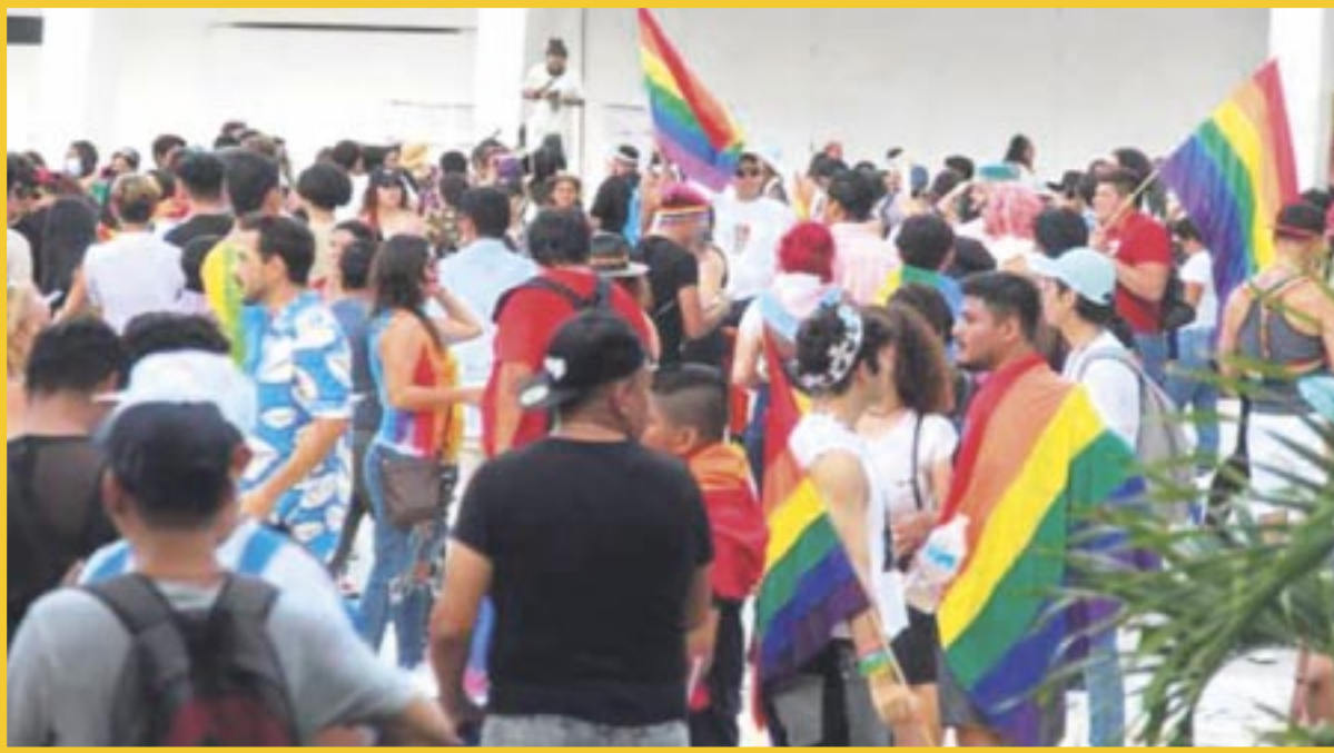
Colectivos esperan que en la edición 2024 del festival Pride va a reunir entre 4 o 5 mil personas en Cancún.