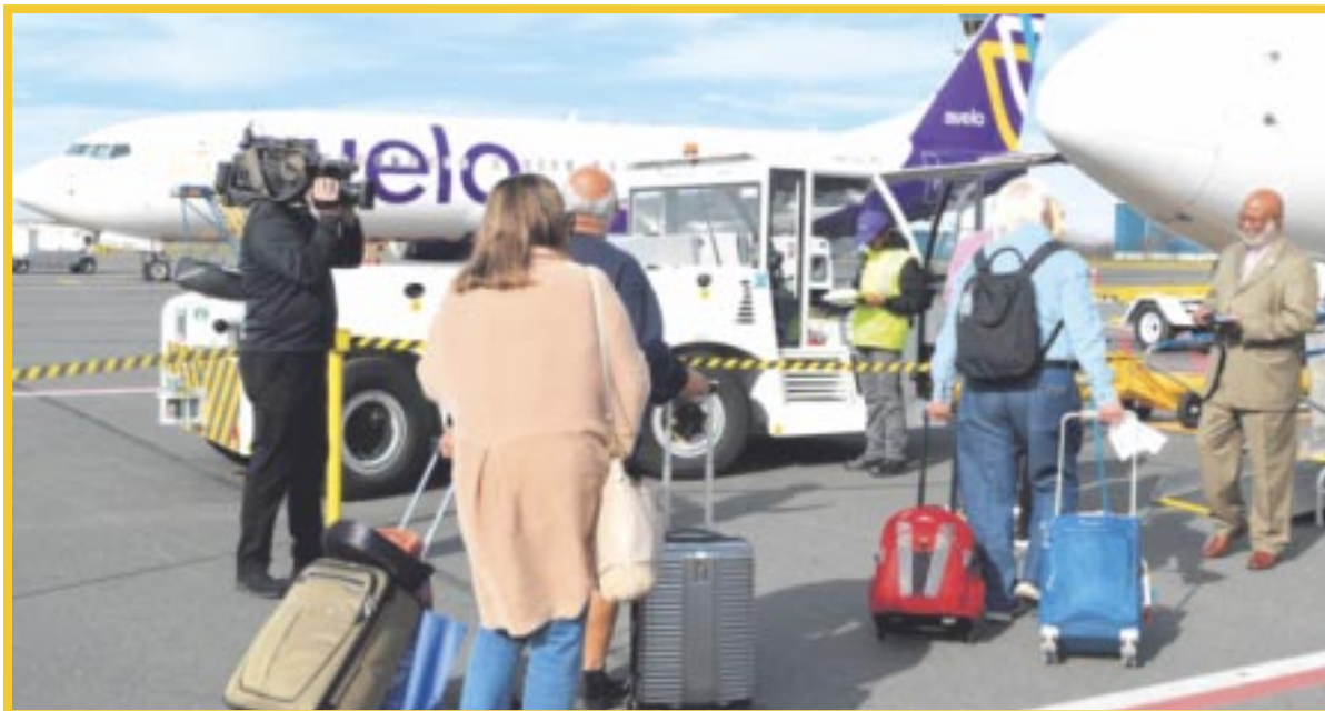
El Aeropuerto Internacional de Cancún se prepara para recibir a la aerolínea Avelo Airlines, que iniciará operaciones el próximo 20 de noviembre con vuelos directos desde el Aeropuerto Bradley de Hartford, en el noreste de EU.

La aerolínea Avelo operará dos veces por semana, brindando una opción económica para los viajeros que deseen visitar Cancún y la Riviera Maya. Con esta nueva ruta, Avelo refuerza su compromiso con la conectividad internacional de México y con el destino turístico más importante del país.