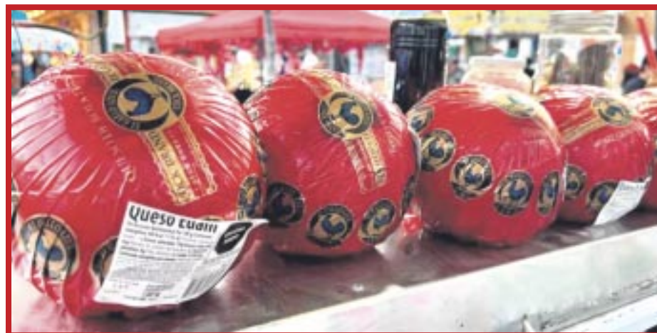
La Feria del Queso de Bola se llevará a cabo en Cancún el 7 y 8 de diciembre de 2024 en el Parque de Las Palapas.

Se dio a conocer que la participación es gratuita, únicamente se solicitará un donativo en especie de juguetes, que posteriormente serán donados a una buena causa. En caso de resultar seleccionados, serán contactados por Trinidad Vélez, quien asignará un folio de participación a más tardar el sábado 23 de noviembre.