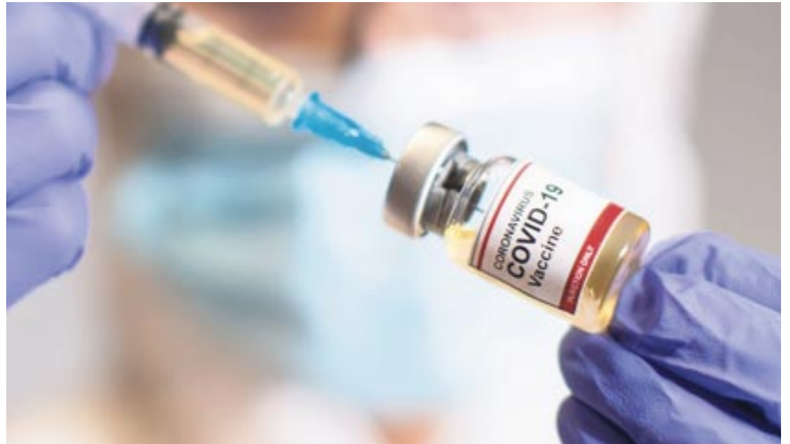
Salud estatal arrancó una campaña de vacunación contra la influenza y la Covid-19 para la temporada invernal 2024-2025.

El Colegio de Contadores de la zona sur del estado advierte que