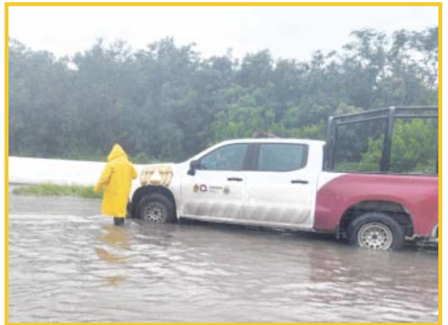
La tormenta tropical "Sara" ha dejado su huella en la región de Quintana Roo, generando lluvias intensas, vientos fuertes y algunas inundaciones.

La Coordinación Estatal de Protección Civil reitera el llamado a la población a mantenerse informada a través de los canales oficiales y a seguir las recomendaciones para evitar riesgos durante la temporada de lluvias.