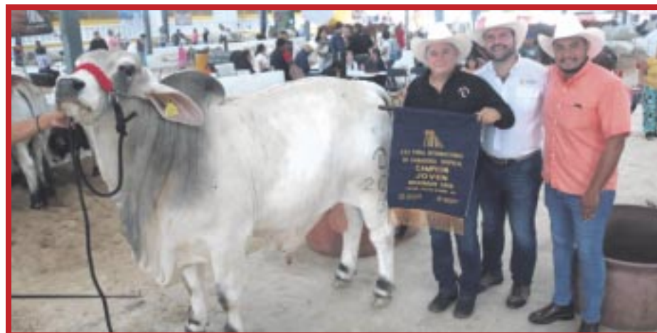
Rancho Santa Lucía se lleva el reconocimiento a "Mejor Ejemplar" en la feria de ganadería tropical de X'matkuil, Yucatán, con un Brahman Gris.

Añadió que el Rancho Santa Lucía ha participado en la feria de ganadería tropical de X'matkuil, desde 2018 y en cada edición hasta la fecha se han logrado diversos reconocimientos, participando ganaderos de toda la península de Yucatán.