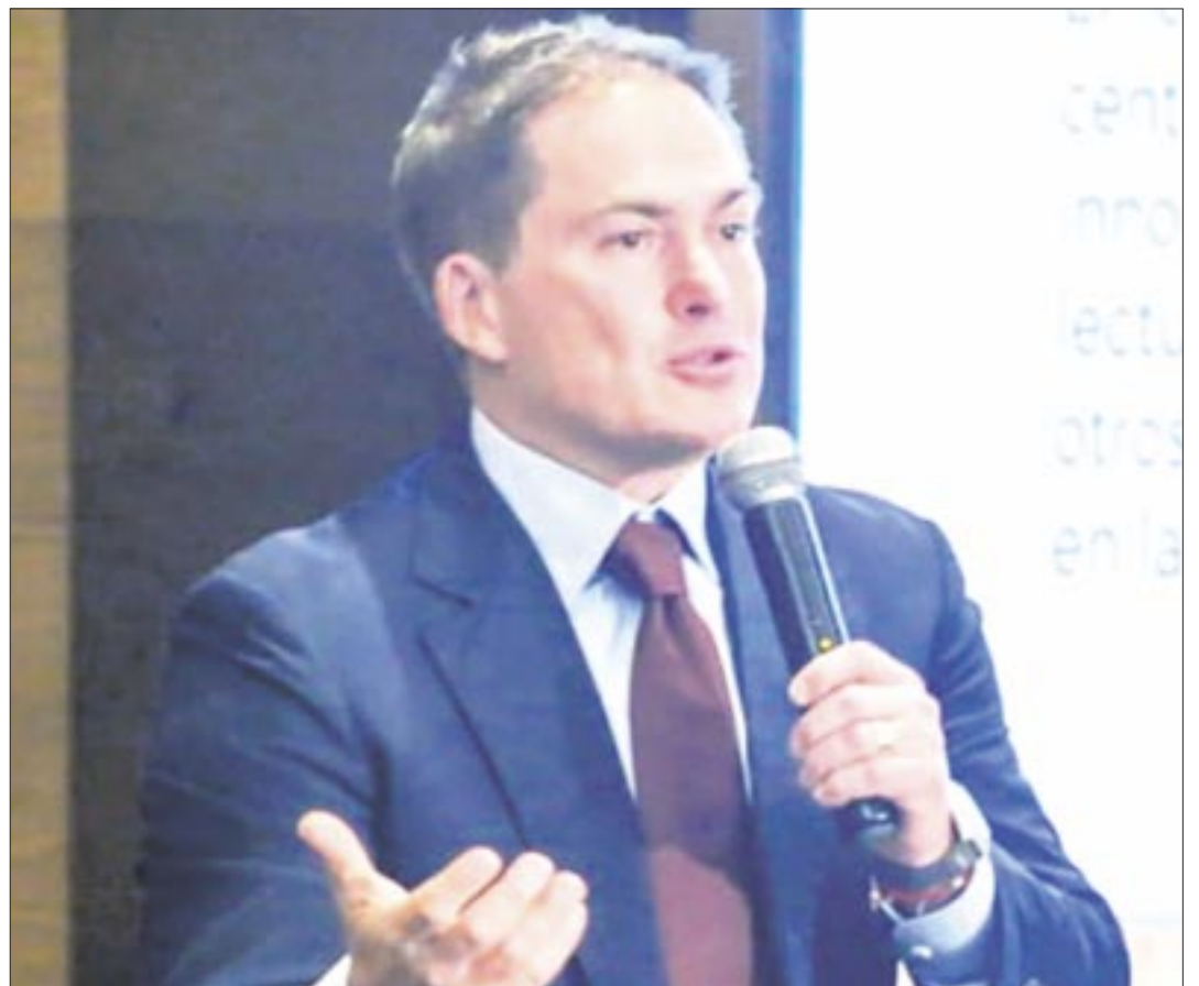
Javier López Casarín , alcalde de Álvaro Obregón, criticó el mal estado de la infraestructura de seguridad de la alcaldía Álvaro Obregón, herencia de la pasada administración panista.

El nuevo alcalde de Álvaro Obregón, Javier López Casarín, decidió tomar el toro por los cuernos, no andarse por las armas y contrató a especialistas en la materia, para atender las necesidades de los habitantes de esa alcaldía.