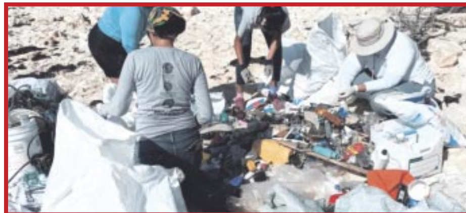
Hoteleros se suman a limpieza de playas en “Mezcalitos” dentro del Campamento Tortuguero San Martín.

Con gran entusiasmo por ayudar a su isla, los colaboradores hoteleros, algunos junto con sus familias, recorrieron cerca de tres kilómetros de playas en el lado oriente de la isla, donde al finalizar y calcular los resultados, se dio a conocer que se recogieron cerca de 282 kilogramos de desechos sólidos como plásticos, bolsas de frituras, botellas de PET, latas, sogas, vidrio, tapitas, entre otros objetos para proteger la vida marina y mantener la salud de los ecosistemas de la isla y además de preservar la imagen del destino.