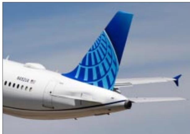
Más conectividad entre Monterrey y San Francisco.

victoriagprado@gmail.com X: @victoriagprado