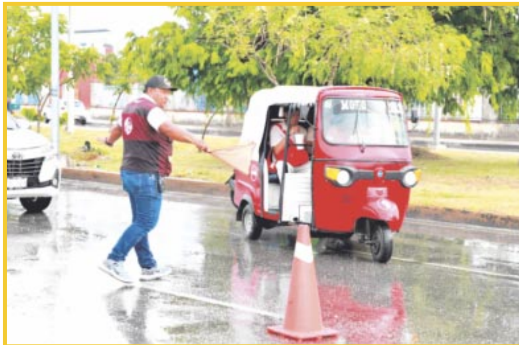
El Imoveqroo reitera su compromiso con la transparencia y seguridad en las inspecciones de transporte público y privado.

Estas acciones buscan fortalecer la confianza y asegurar que el transporte en el estado opere bajo las mejores condiciones, siempre priorizando la seguridad y bienestar de los usuarios.