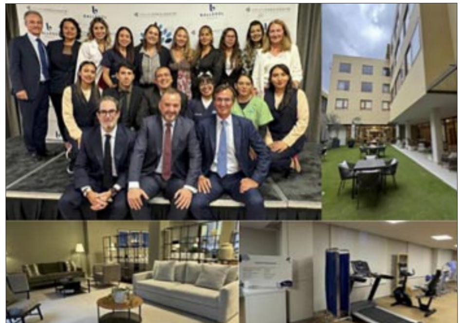
Durante el corte de listón.

Posteriormente se cortó el listón que abrió oficialmente la residencia siendo testigos los numerosos concurrentes y residentes de este nuevo lugar.