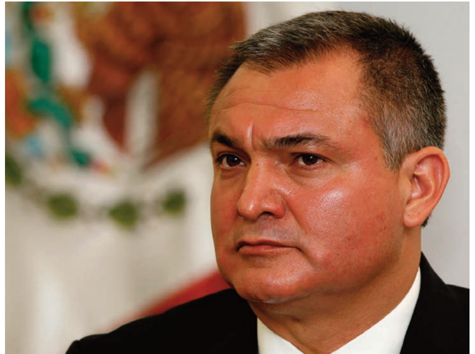
Genaro García Luna, titular de la Secretaría de Seguridad Pública durante el sexenio del entonces presidente Calderón.

256 mdd, pronunciando como amenaza la frase célebre de "Copelas o Cuello".