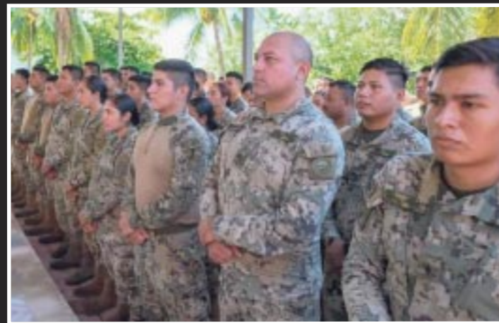
Otros 600 elementos de la Semar llegaron al estado como parte de la estrategia interinstitucional de seguridad acordada entre el gobierno estatal y federal.

Por parte del gobierno municipal, se seguirá reforzando la Secretaría de Seguridad Ciudadana, con proyectos como la entrega de cámaras de solapa (“body Cams”) para que todos los policías del municipio tengan una cámara para vigilar su desempeño.