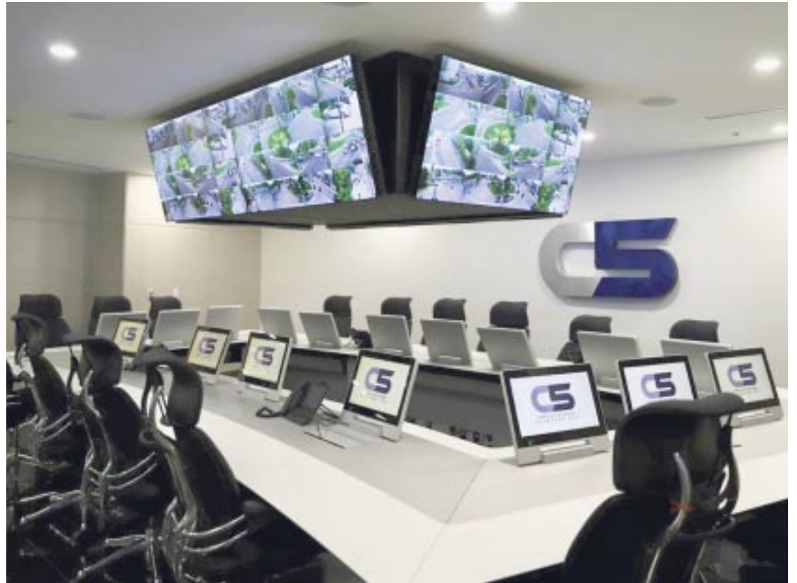
Empresas siguen sumando sus cámaras de vigilancia al C5 en Quintana Roo.