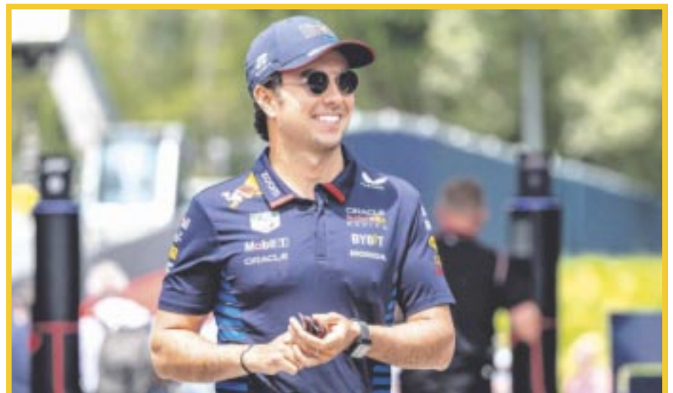
El piloto mexicano Sergio “Checo Pérez” se muestra positivo previo al Gran Premio de Austin, donde espera llegar en una mejor posición el próximo domingo.

La escudería de Milton Keynes tuvo su punto más bajo del año el mes pasado en Monza, pero desde entonces fue un contendiente a la victoria con Sergio Pérez en el Gran Premio de Azerbaiyán y luego logró el segundo lugar con Max Verstappen en Singapur, esta última una cita dominada por