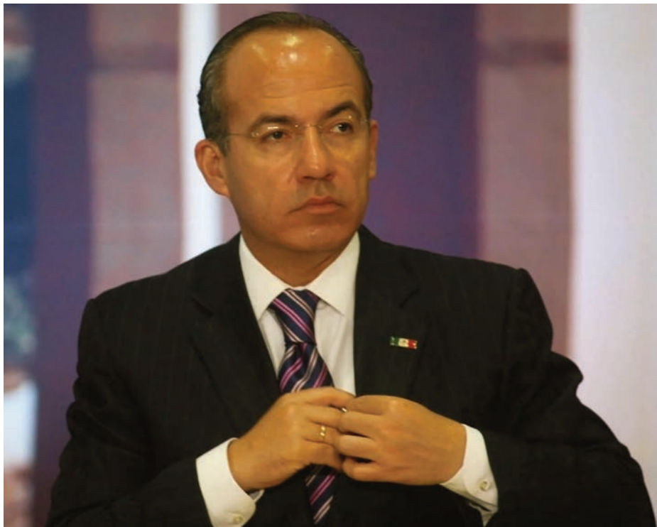
Felipe Calderón Hinojosa, ex presidente de México