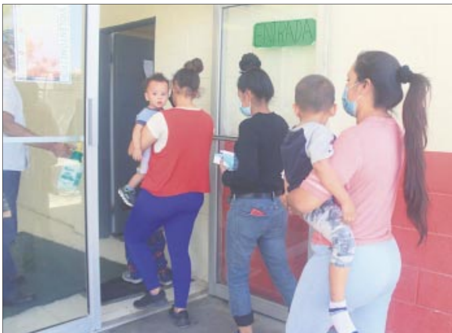
Aumentó 75 por ciento el ingreso de mujeres a refugios para víctimas de violencia en los primeros 7 meses de este año.

Al momento, 2019 se mantiene como el año más violento para las mujeres, con 2 mil 875 víctimas de homicidio doloso, seguido de 2022, que acumuló 2 mil 801 mujeres asesinadas y 2020, el año de la pandemia, con 2 mil 801.