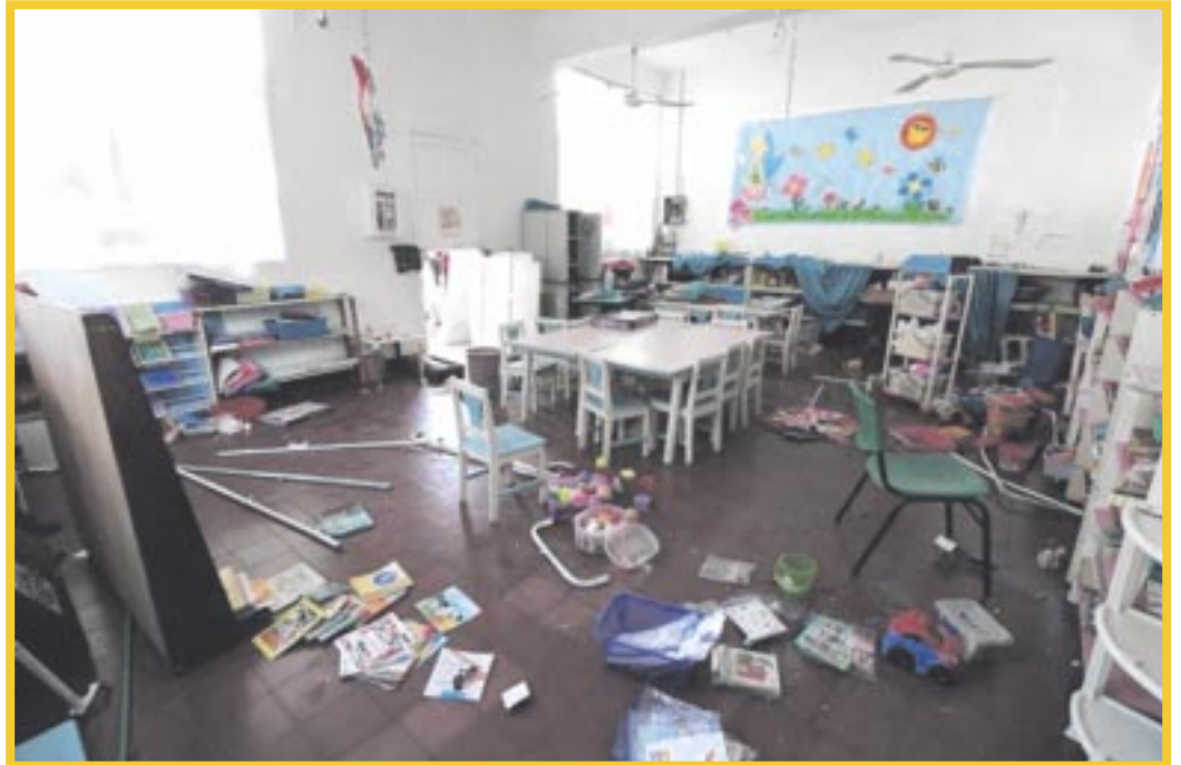
Las SEQ confirma que sólo cuatro escuelas de Quintana Roo fueron robadas durante las vacaciones de verano.

“Los reportes llegaron a las autoridades escolares, luego de que profesores y demás personal educativo, por lo que los directores del plantel ya interpusieron las denuncias correspondientes ante la Fiscalía General del Estado (FGE)2 concluyó Gorocica Moreno.