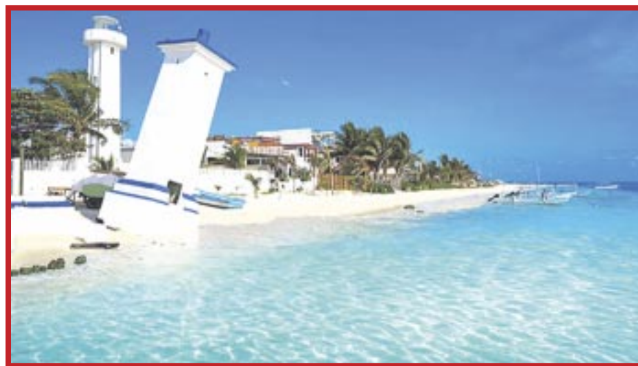
La temporada vacacional de verano 2024 en Puerto Morelos cerró con resultados positivos.

En este escenario, celebra que Puerto Morelos es un destino donde se ha visto un aumento en la preferencia de visitantes, principalmente provenientes de Estados Unidos y Canadá, quienes buscan disfrutar del clima cálido y de las actividades acuáticas, como pesca, buceo y snorkel. “Es muy importante mantener la promoción constante de los atractivos turísticos de Puerto Morelos para asegurar una ocupación óptima durante todo el año. La actividad turística es crucial para la economía local, por lo que la promoción de playas, la Ruta de los Cenotes, el arrecife y la gastronomía sigue siendo una prioridad” dijo el funcionario.