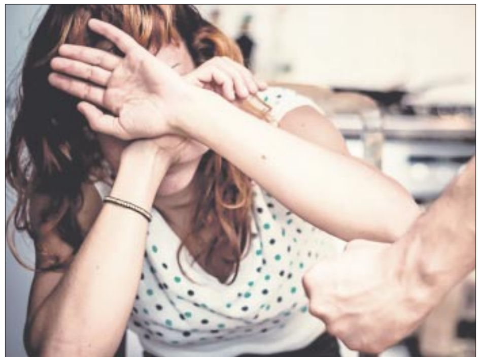
La violencia psicológica, física y sexual contra mujeres persisten en altos niveles en México.

“La mitad de los refugios están sin la segunda ministración de presupuesto que nos deben dar en el año, se les pidió desde hace bastante tiempo y nos han dicho que esperan que el dinero se libere en septiembre, pero eso nos genera problemáticas para la