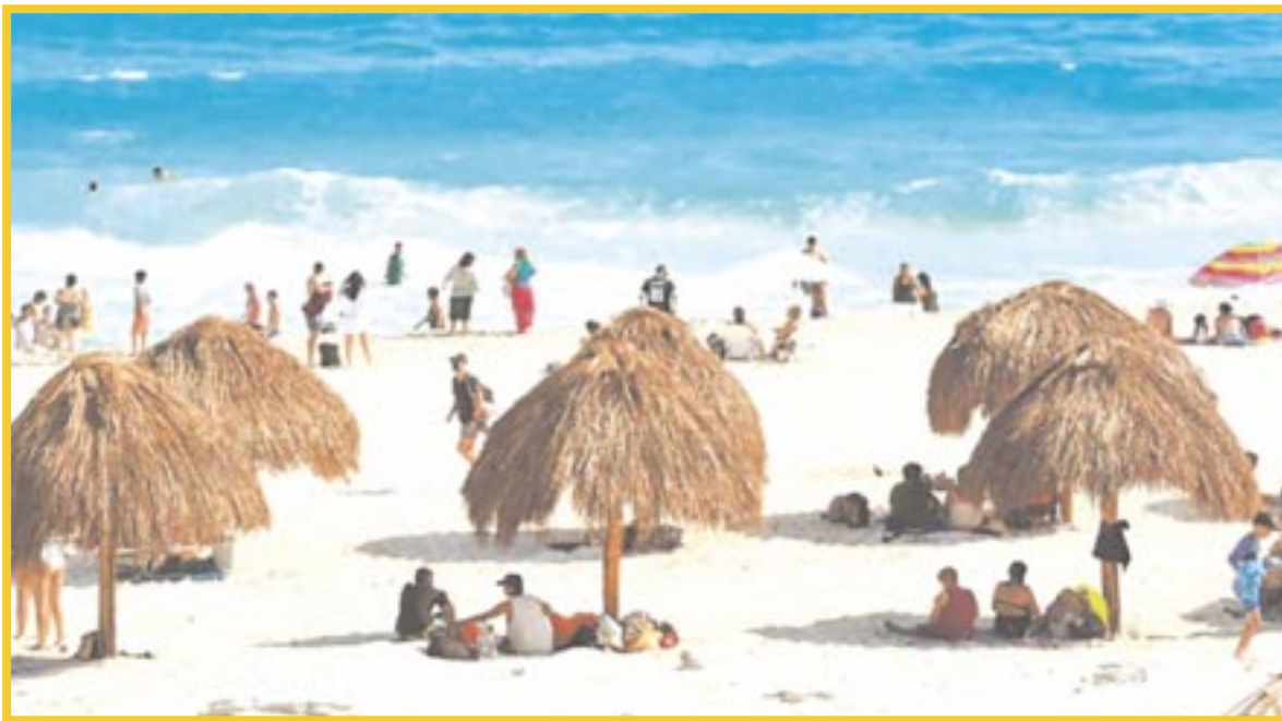
En los 43 días de verano acudieron a las playas de Cancún a cargo del municipio, un total de 168 mil 144 bañistas.

Las estadísticas proporcionadas por la Dirección de la Zofemat, en Benito Juárez (Cancún), refieren que en los 43 días de verano acudieron a las playas de Cancún a cargo del municipio, un total de 168 mil 144 bañistas, mientras que en el mismo periodo, pero del año pasado fueron 132 mil 169.