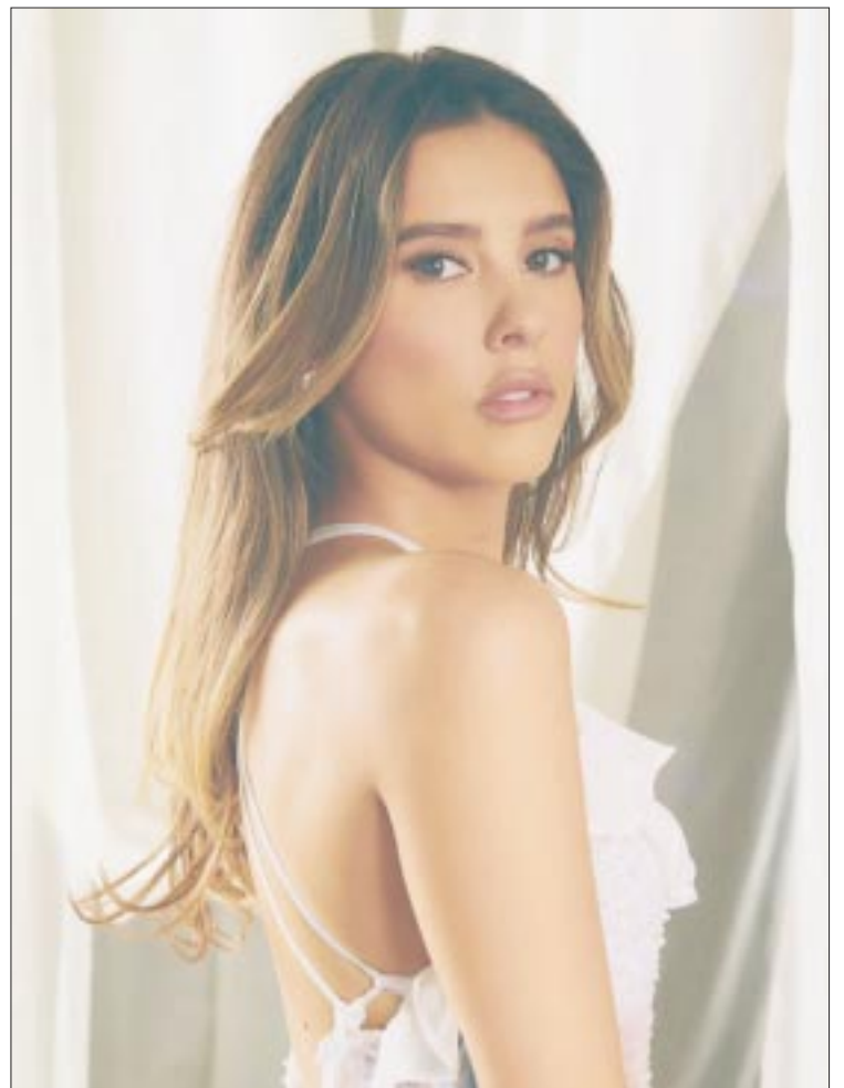
Paulina evoca con este tema una parte fundamental en su vida personal como profesional.

Y reconoce que “Todos los años y la experiencia en la actuación, estar en contacto con mis emociones, permitirme vulnerarme y compartir eso con la gente es bueno, porque es cuando conectas de verdad. Si y no es difícil, para mí hay temas y cosas que tienes más barreras o más escudos para mostrar, para realmente poderte abrir por completo, eso requiere valor siempre. Pero justo a mí la experiencia y el tiempo me han enseñado que hay que perder el miedo a abrir el corazón y a ser vul-