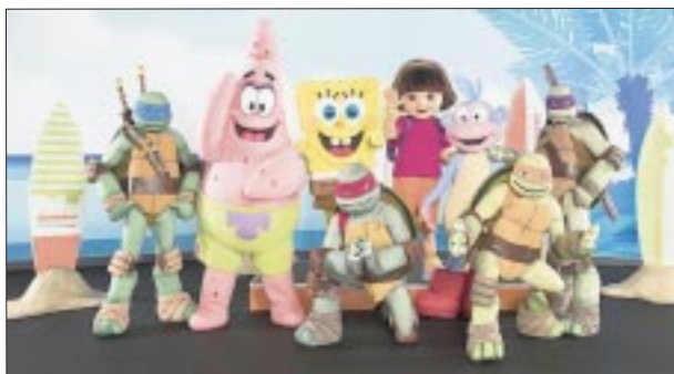
La familia Nickelodeon.

victoriagprado@gmail.com X: @victoriagprado