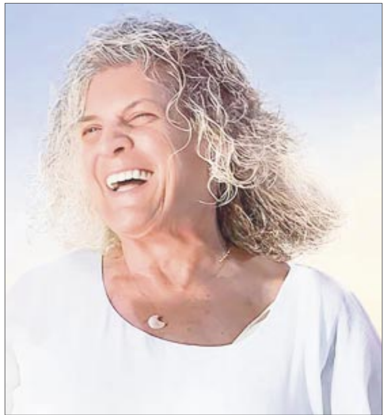
El Lunario del Auditorio Nacional se llenará de magia y nostalgia con la presentación de Denise de Kalafe.

Denise De Kalafe, la brillante compositora y poderosa voz detrás del emblemático Señora, Señora, promete una noche mágica donde cada nota y cada letra te transportarán en un viaje inolvidable. Con melodías inmortales como Sortilegio, Amándote, El Amor... Cosa Tan Rara, Cuando Hay Amor... No Hay Pecado y Cuando Termina Un Amor, el público vivirá una experiencia musical colmada de emociones y recuerdos imborrables.