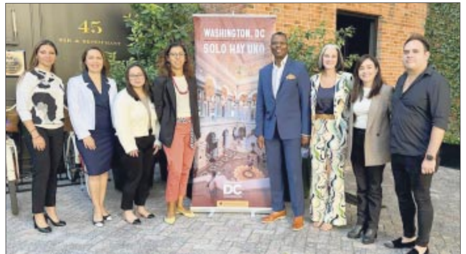
La delegación de Washington.