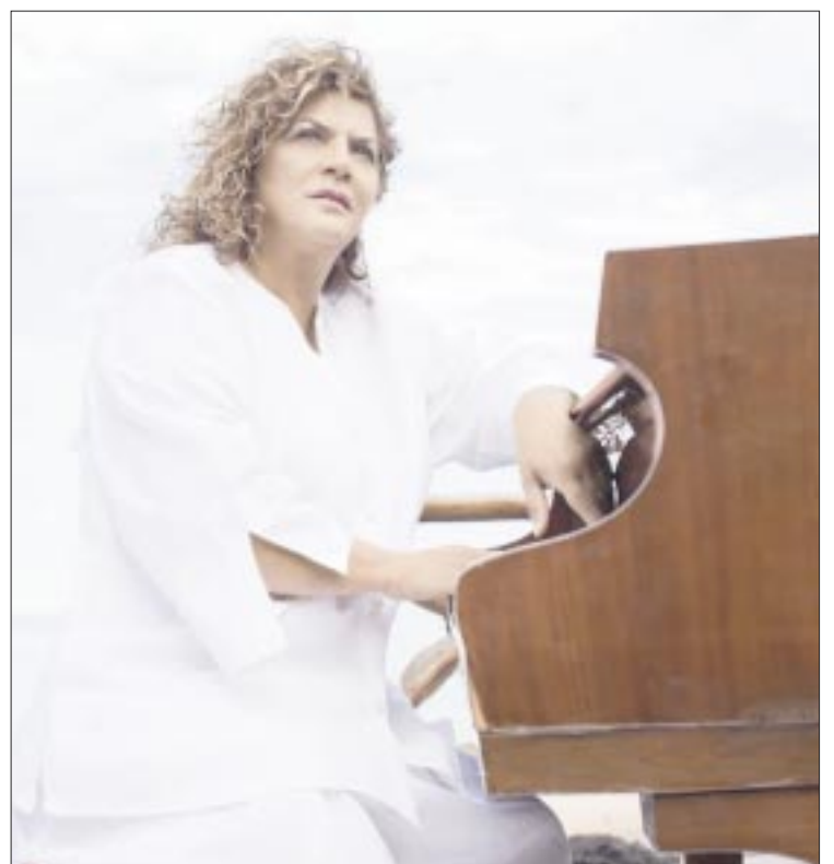
La cantante ofrecerá un repertorio que ha dejado huella en la historia musical de Latinoamérica.