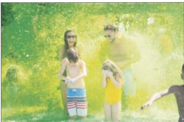
En el parque acuático.