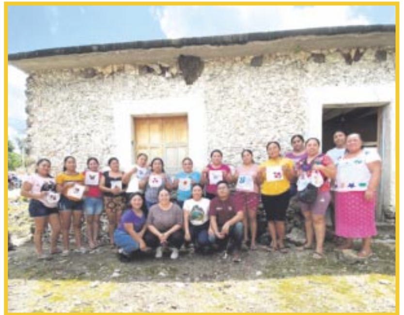
Capacitan a más de 10 mil mujeres en los Centros para el Desarrollo del IQM.

La titular del IQM, María Hadad Castillo, destacó que los CDM son estrategia clave en la promoción de la igualdad de género y el empoderamiento de las mujeres en Quintana Roo, por lo que estos centros están comprometidos con la autonomía y el desarrollo integral de las mujeres, contribuyendo significativamente a la igualdad sustantiva entre mujeres y hombres en el estado.