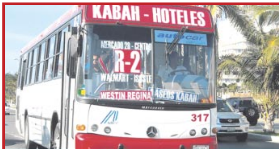
En el municipio de Benito Juárez (Cancún) quedó descartado un aumento en las tarifas de transporte público por ahora.