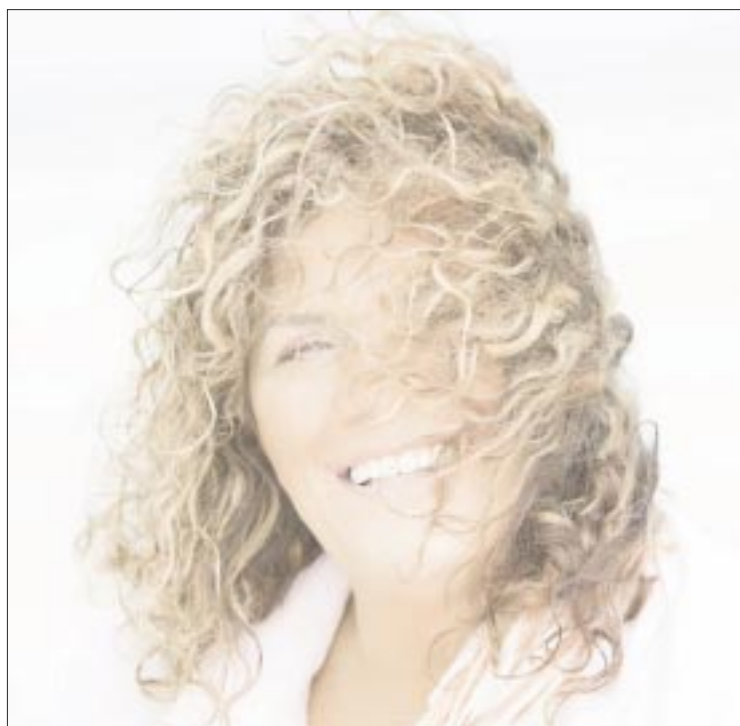
Desde el corazón de Brasil hasta el alma de México, la icónica Denise De Kalafe regresa a los escenarios.