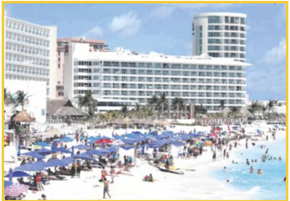
La Sedetur reconoce que durante la temporada de verano se registró la llegada de 1 millón 856 mil turistas, cifra por debajo de las estimaciones iniciales.

Adelantó que van a sostener una reunión con el nuevo cónsul de Estados Unidos en Mérida, Justen A. Thomas, en la que también hará presencia la gobernadora quintanarroense Mara Lezama “No nos debe de alarmar, el Caribe Mexicano sigue siendo uno de los destinos favoritos, siguen las inversiones con planes de más rutas áreas que abrirán a finales del año”, comentó Cueto Riestra.