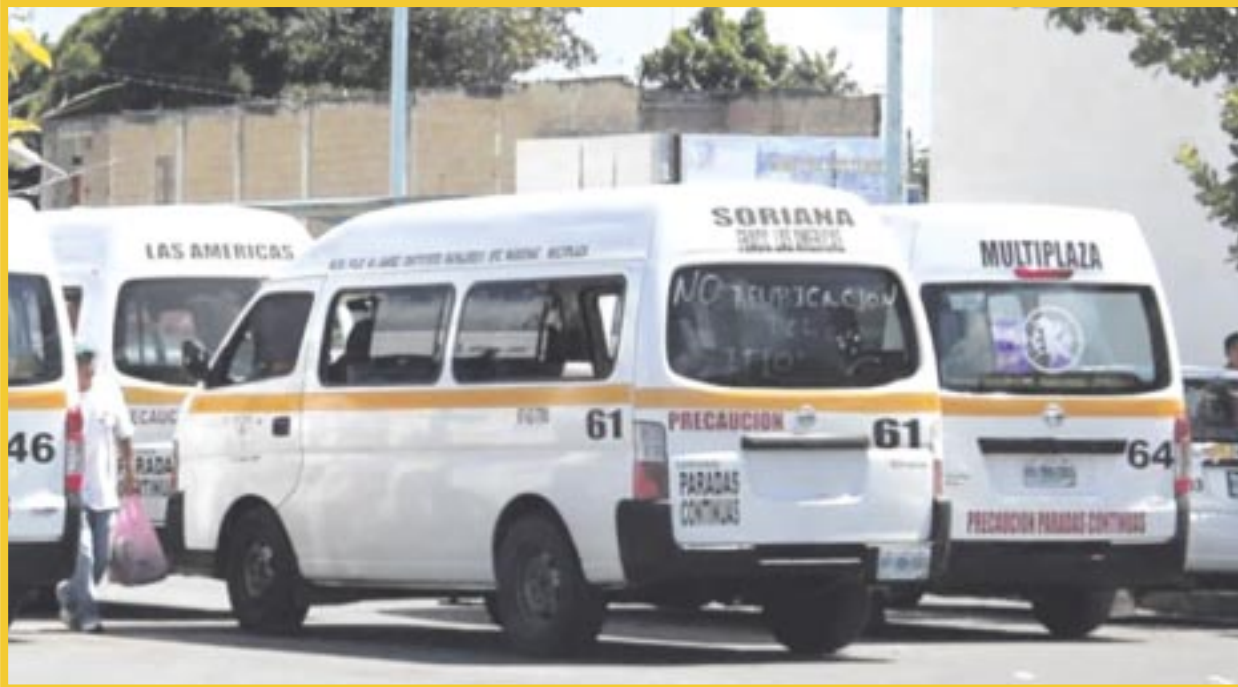
Operadores de transporte colectivo en Chetumal subieron sus tarifas sin la autorización del Imoveqroo.

Los transportistas argumentan que la causa de este aumento de dos pesos al pasaje fue el acelerado incremento que han presentado insumos, como el combustible, además de las refacciones para reparar y dar mantenimiento a sus unidades, por lo que cobran 10 pesos desde el lunes pasado.