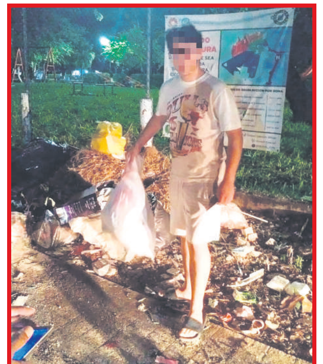
Atienden dos reportes más de mal manejo de desechos sólidos en la vía pública de Cancún.

de Seguridad Ciudadana y Tránsito, le leyó sus derechos y procedió con el traslado del presunto infractor para el deslinde de responsabilidades ante el juez cívico.