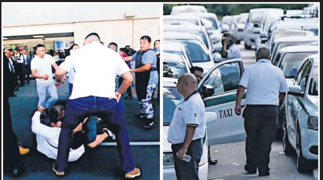
La FGE de Quintana Roo anunció un endurecimiento en las medidas para combatir actos delictivos en sindicatos y organizaciones civiles.

En este escenario, se han llevado a cabo cateos en instalaciones del sindicato, donde se han encontrado drogas y cartuchos de diferentes calibres; asimismo, de acuerdo con López Salazar, han iniciado operativos para capturar a los responsables y restaurar la seguridad en el sector transporte. “No vamos a permitir que delincuentes disfrazados de taxistas sigan manchando la reputación de Quintana Roo. Este es un estado de leyes, no de impunidad”, afirmó el Fiscal, haciendo énfasis en la importancia de las denuncias ciudadanas para actuar aseveró.