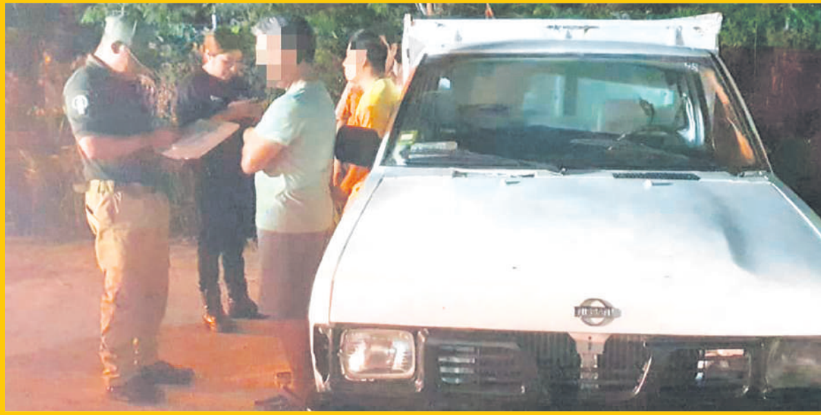
En un esfuerzo cuidar del medio ambiente, se ha propuesto una posible implementación de patrullas verdes en todo el estado.

El gobierno de Quintana Roo ha anunciado la propuesta sobre una posible implementación de “patrullas verdes” en toda el estado. Esta iniciativa busca erradicar los basureros clandestinos y fomentar una cultura de responsabilidad ambiental entre los ciudadanos y las empresas.