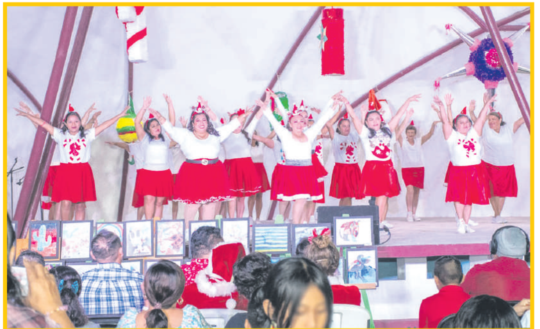
La Fundación de Parques y Museos de Cozumel invita al "Encendido de Luces del Árbol Navideño Comunitario".

Para finalizar, invitó a toda la ciudadanía a asistir a este evento gratuito a partir de las 18:00 horas en un ambiente familiar para propiciar la convivencia comunitaria y especificó que el BiblioAvión Gervasio está ubicado en la 130 av. entre las calles 7 sur y Miguel Hidalgo.