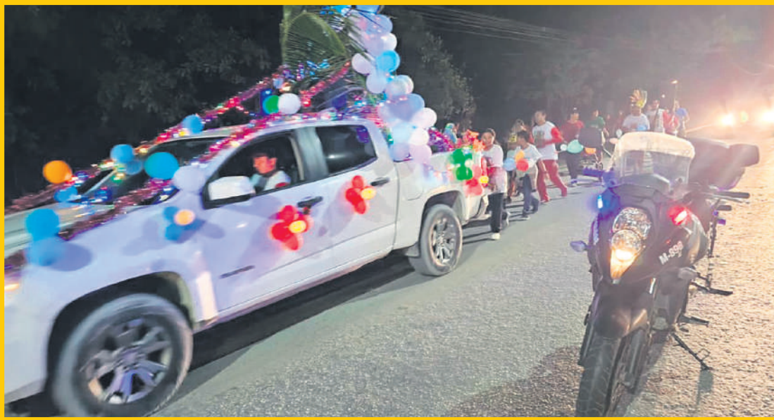
La Dirección de Tránsito Municipal de Cancún ha implementado un dispositivo vial especial para garantizar la seguridad de los peregrinos.

El operativo también contempla el abanderamiento de las Antorchas Guadalupanas, que llegan desde distintos puntos del estado. Una de las antorchas parte del poblado de Leona Vicario hacia la iglesia del Santuario Diocesano de Nuestra Señora de Guadalupe, mientras que otra llega a la Catedral de Cancún desde el kilómetro 303 de la Carretera Cancún-Mérida.