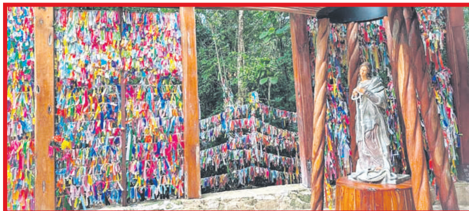
El Santuario de María Desatadora de Nudos en Cancún se prepara para recibir una afluencia significativa de visitantes durante la temporada vacacional.

Para la próxima semana santa de 2025, se espera un incremento de turismo del 33%. La iglesia tiene un promedio de visitas de 12 mil personas a la semana.