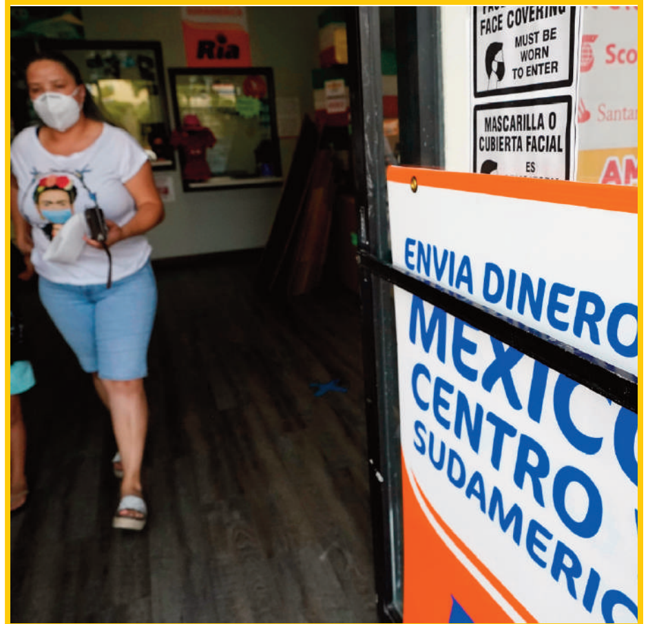
El gobierno de Claudia Sheinbaum Pardo no aplicará ningún impuesto a las remesas que los ciudadanos mexicanos reciban de sus familiares desde países extranjeros.

Distintos rastreos en internet, medios y en la legislación vigente demuestran que no hay previsto ningún tipo de subida impositiva