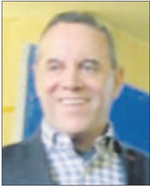
Por José Luis Montañez