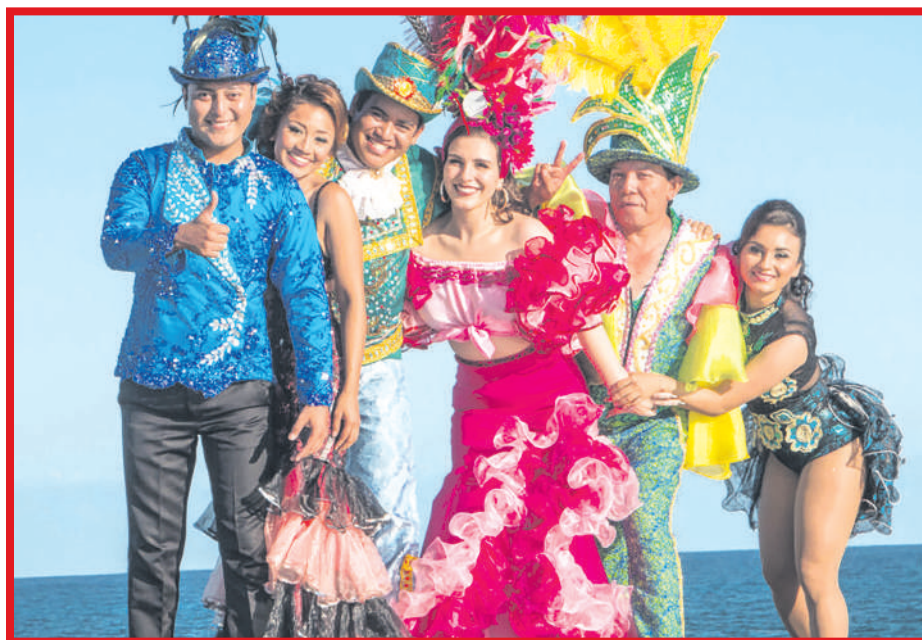
El Consejo Consultivo del Carnaval Cozumel 2025-2027 quedó conformado.

Recordó que para el próximo año el alcalde incrementó los montos asignados a los candidatos en un 20%.