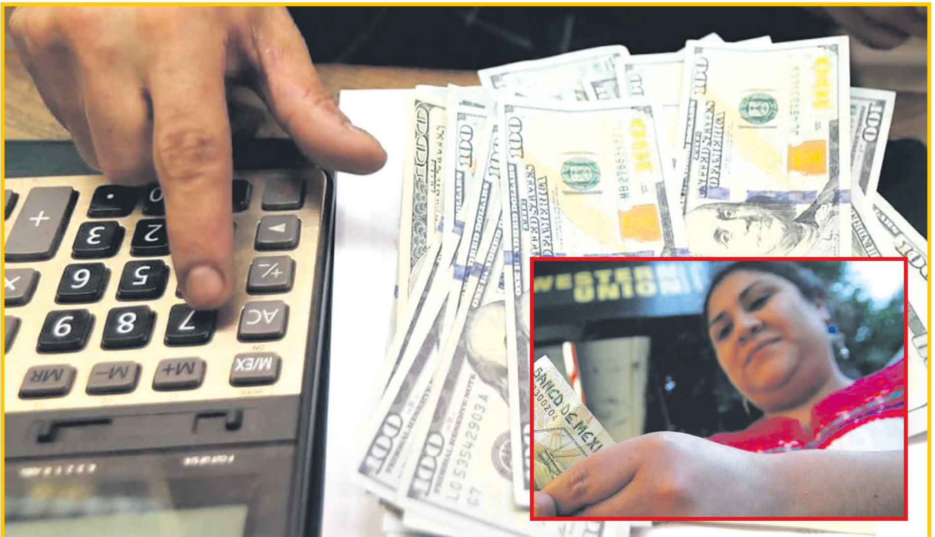
La Secretaría de Hacienda prevé una disminución en la llegada de remesas familiares para el 2025 debido a una leve recesión en el vecino del norte.

En el caso de que el SAT cobrase algún tipo de gravamen sería a través del Impuesto Sobre la Renta (ISR), legislado en la Ley Federal del Impuesto sobre la Renta. Sin embargo, la legislación sólo contempla gravar las remesas que perciban las empresas, mientras que aquellas que se envían a personas físicas se consideran donaciones.