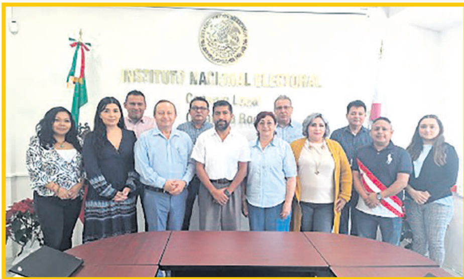
El INE da seguimiento al Proceso Electoral Extraordinario (PEEPJF) 2024-2025.

En un movimiento estratégico, la Secretaría de Relaciones Exteriores (SRE) abrirá sus oficinas para facilitar el trámite de pasaportes y otros servicios consulares para los residentes y turistas de la isla. Las oficinas estarán ubicadas en la Plaza del Sol, en el edificio de los altos.